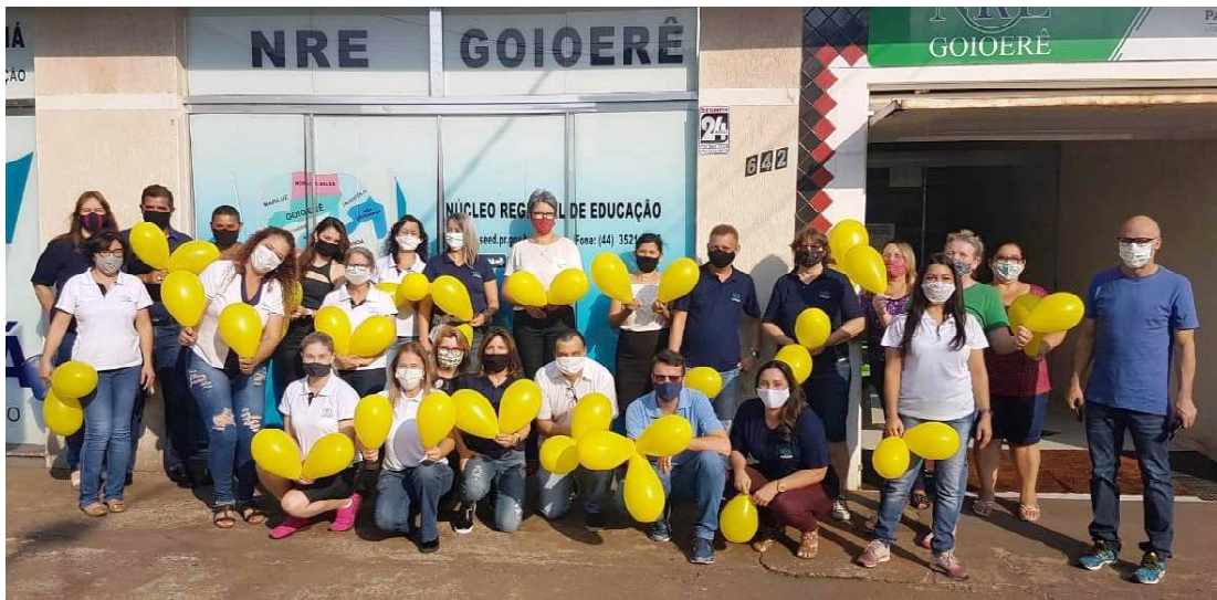
Ações foram realizadas durante esta semana em Goioerê