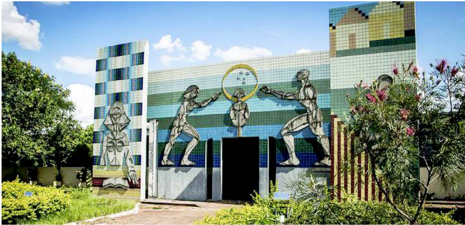
Fachada do prédio principal da UEM em Goioerê: vestibular para Física Médica em Goioerê

De acordo com as informações da Universidade, as inscrições para o vestibular poderão ser feitas até o dia 11 de novembro. As provas vão acontecer nos dias 21 e 22 de março de 2021. As inscrições serão apenas online no site