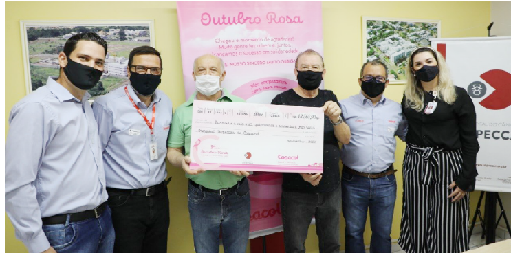
Doação foi feita durante esta semana: apoio ao hospital do câncer de Cascavel e Umuarama

de outubro, foram 120 toneladas de tilápias comercializadas, que resultou em R$ 200 mil em doações. Os valores arrecadados foram divididos entre hospitais que