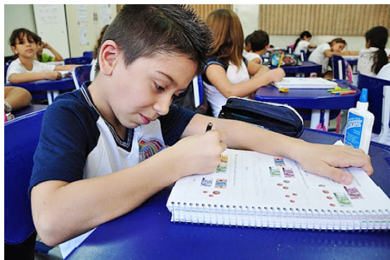
Por conta da pandemia do coronavírus, aulas estão sendo remotas

NÍVEL NACIONAL: De acordo com o último levantamento da Unidme - União Nacional dos Dirigentes Municipais de Educação - em agosto, cerca de 50% dos municípios brasileiros ainda não tinham estruturado um protocolo de retorno às aulas,