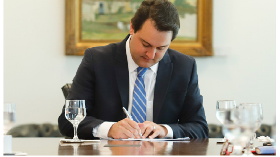
Ratinho Junior afirma que o valor será depositado integralmente na conta de aproximadamente 265 mil servidores ativos, pensionistas e aposentados. A folha adicional chega a R$ 1,701 bilhão.

O governador Carlos Massa Ratinho Junior determinou nesta quarta-feira (11) a antecipação do pagamento do décimo terceiro salário dos funcionários estaduais para o próximo dia 04 de dezembro. O valor será depositado integralmente na conta de aproximadamente 265 mil servidores ativos, pensionistas e aposentados. A folha adicional chega a R$ 1,701 bilhão, sendo R$ 925 milhões para ativos e R$ 776 milhões de inativos. O pagamento antecipado espelha a política adotada já no ano passado e leva em consideração o esforço dos servidores públicos durante a pandemia provocada pela Covid-19. "Antecipamos o pagamento em respeito ao compromisso que temos com o funcionalismo público, sobretudo neste ano de dificuldades, em que os servidores foram desafiados a ajudar a população em todas as áreas, inclusive com novas tecnologias e formas de atendimento", disse o governador Ratinho Junior. Ele reforça que a medida só é possível graças à austeridade da gestão financeira do Estado, das reformas administrativas que continuam em andamento e do controle sobre o custo da máquina mesmo em um ano de queda na arrecadação. Ratinho Junior destaca que o governo manteve prioridade para investimentos relevantes