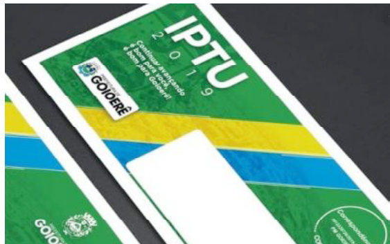
Interessados têm até amanhã para fazer o requerimento

Os contribuintes que se encaixarem nos requisitos exigidos, deverão comparecer