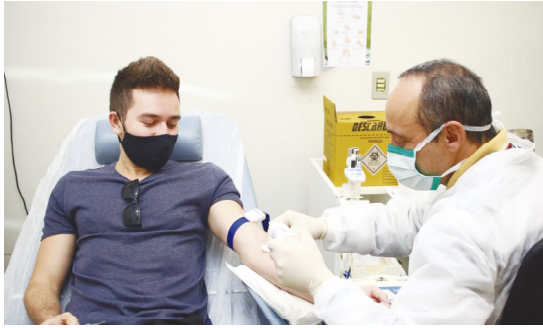
Diversas homenagens serão feitas aos doadores de sangue

Em Campo Mourão, o volume de doações está normal, mas foi lançada