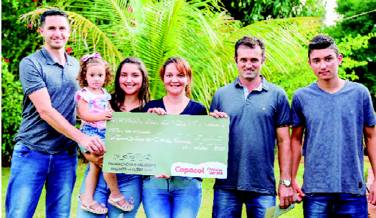
Em cada setor houve premiação para os cooperados

Além disso, um cooperado de cada atividade recebeu uma premiação