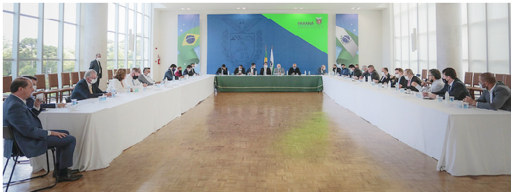
O encontro com a bancada aliada serviu para perfilar as necessidades do Paraná. Entraram na pauta investimentos, ações de controle da Covid-19 e projetos prioritários para o Estado

O governador Carlos Massa Ratinho Junior e o chefe da Casa Civil, Guto Silva, discutiram nesta terça-feira (24) com os deputados estaduais, no Palácio Iguatçu, o Orçamento de 2021, a continuidade das políticas de enfrentamento da Covid-19 e projetos prioritários para a modernização do Estado. O encontro com a bancada aliada também serviu para perfilar as necessidades do Paraná diante das dificuldades impostas pela pandemia nas contas públicas.