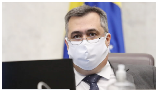
Beto Preto, secretário de Saúde do Paraná

Beto Preto diz que o Governo do Paraná está atuando de maneira firme e descentralizada para assegurar estas estruturas. "Mais leitos disponíveis não são a