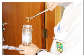
Os escorpiões estão sendo encontrados nas casas