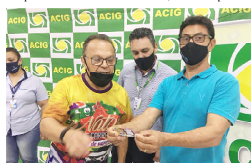
Diretores da ACIG durante sorteio ontem

O terceiro sorteio do mês de dezembro será realizado no dia 27, quando acontecerá também o encerramento da campanha. No total serão