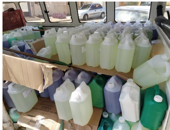
Os últimos produtos que serão distribuídos aos municípios

RANCHO ALEGRE: O professor disse, no entanto, que para o próximo ano, a ideia é dar continuidade ao projeto em um barracão cedido pelo município de Rancho Alegre do Oeste, considerado