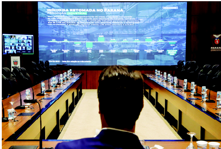
Cenário foi apresentado pelo governador Carlos Massa Ratinho Junior na reunião do Conselho de Desenvolvimento Empresarial e de Infraestrutura

“A nossa administração apoia o setor produtivo, facilitando a vida de quem gera emprego. Estamos conseguindo sair desta crise de maneira rápida, fruto de um