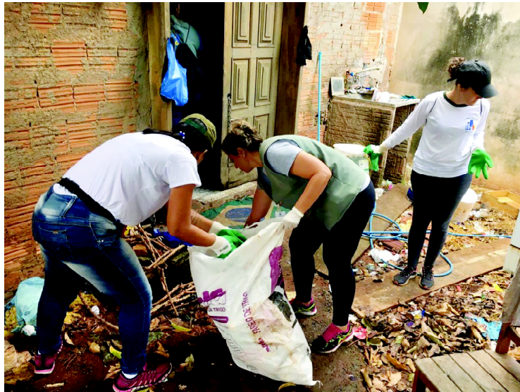
O alerta serve para toda população: números têm aumentado todos os dias no município

Deste total, 905 são ocorrências autóctones,