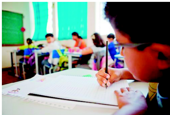
Confirmação da matrícula pode ser feita até sexta-feira

DOCUMENTOS —Nalora de preencher o formulário, será necessário ter em mãos a certidão de nascimento ou carteira de identidade do estudante (se houver), declaração de vacinação, declaração ou histórico escolar, além de um comprovante de endereço e RG do responsável.