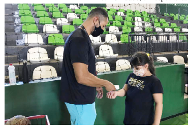
Temperatura dos alunos é verificada antes dos treinos

As aulas são gratuitas e estão abertas à toda comunidade. Quaisquer dúvidas, entrar em contato pelo (44) 3522-1991.