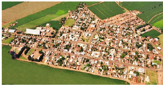
Vista aérea da cidade de Quarto Centenário, que completa 25 anos este mês

Akio lembra que o apoio do governo estadual, através