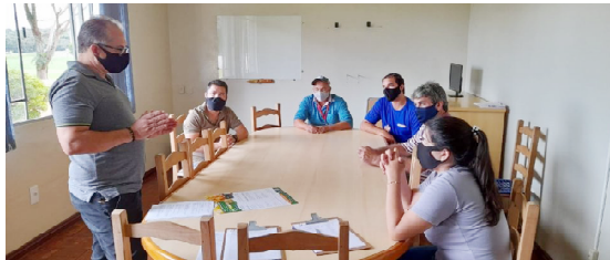
Assembleias itinerantes: trabalhadores aprovam início das negociações salariais

Este índice de inflação é medido pelo Instituto Brasileiro de Geografia e Estatística (IBGE) e muito usado como referência em ajustes salariais.