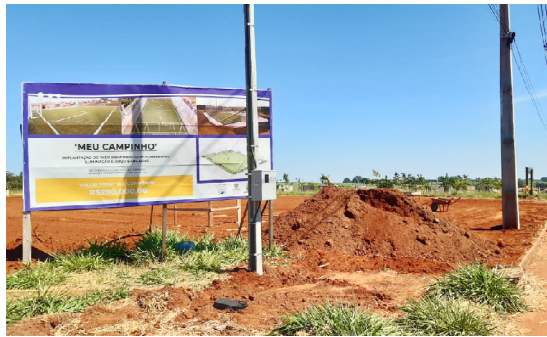
O campo começou a ser construído: nova área de lazer para a população

Nesta primeira etapa, o prefeito explica que estão sendo feitos os taludes e terraplenagem e que na sequência serão feitos a implantação de arquibancada e iluminação.