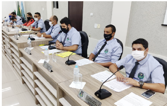
A plenária dos vereadores está marcada para a próxima segunda-feira, dia 12