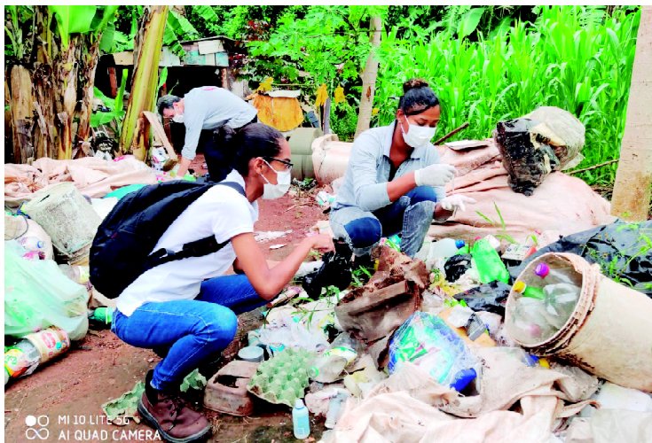
Neste sábado, agentes de endemias e servidores da prefeitura, farão um arrastão de limpeza no Jardim Universitário

Por conta do aumento de casos, a Prefeitura realizou no mês passado, mais precisamente nos dias 12 e 13, um grande arrastão de limpeza