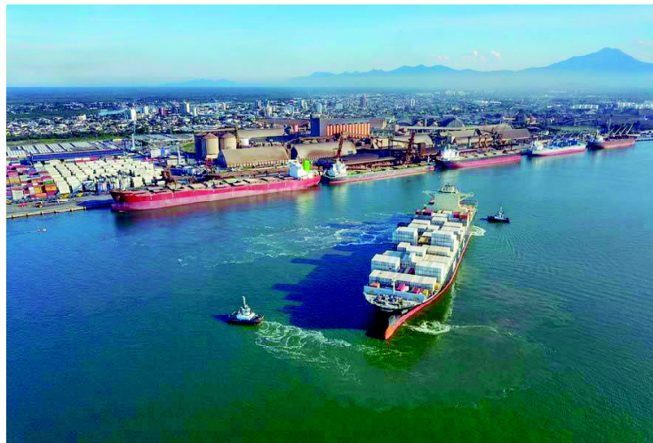
Principal investimento será no projeto do chamado Moegão Leste, que vai unificar a recepção de cargas ferroviárias. O valor da obra, prevista para ser licitada no segundo semestre deste ano, é de R$ 450 milhões.

ESPECIAL – O projeto da Nova Ferroeste foi esmiuçado ao longo desta semana em cinco reportagens especiais. A primeira, sobre o traçado, foi publicada na segunda-feira (5). Na terça-feira (6), foi reforçado o impacto econômico do modal e a quarta e a quinta (7) e (8), como a obra ganhou apoio do setor produtivo, tanto no Paraná quanto no Mato Grosso do Sul. O objetivo da série foi destacar a importância da implementação deste novo corredor de exportação que vai unir duas potências do agronegócio mundial.