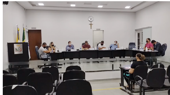
Indicação foi aprovada na sessão plenária desta segunda-feira: direito dos servidores municipais