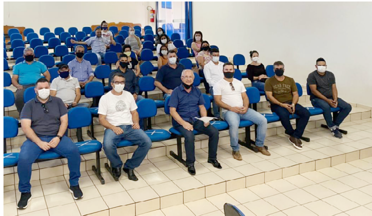
A prestação de contas foi realizada ontem à tarde no centro de eventos da cidade

Ainda segundo o prefeito, é preciso, cada vez mais,