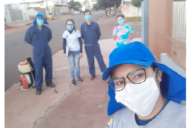
Integrantes da Equipe de Endemias: trabalho árduo

A orientação é para que os moradores coloquem na frente de suas casas todo material inservível e também aqueles que possam servir de local para a reprodução do mosquito que transmite a doença.