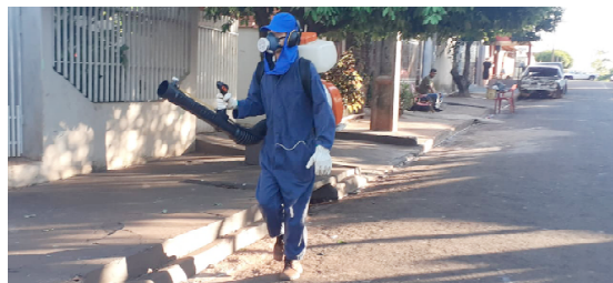
Vigilância tem realizado bloqueio em diversos ponto da cidade

De acordo com a coordenação do setor de combate à dengue, os índices estão alto porque o período