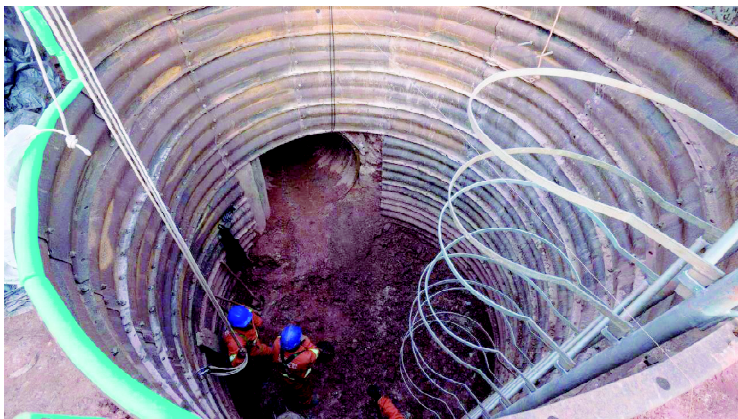
Índice refere-se ao primeiro semestre em comparação com o mesmo período do ano passado. Companhia investiu R$ 552 milhões em obras de água e de esgoto em todo o Estado, com mais 28.700 famílias atendidas com sistema de coleta e tratamento

Também está em fase de conclusão a construção de quatro novos reservatórios de água tratada em Curitiba, que vão reforçar o sistema de distribuição na Região Metropolitana. As novas