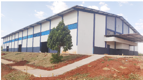
O prédio do ginásio ganhou telhado e pintura novas, além de outras melhorias