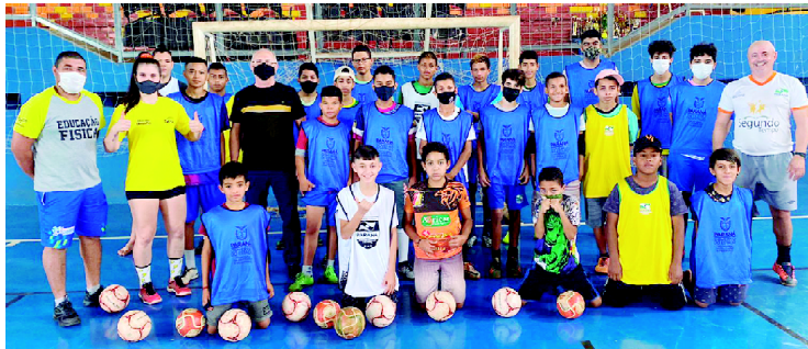
Os treinos foram retomados nesta semana: escolinha conta com cerca de 100 alunos na sua totalidade

Os treinos são realizados em dois turnos, no período da manhã, das 8 às 12 horas e à tarde, das 13 às 15:30 horas. "Estamos bastante felizes em podermos retomar estas atividades e esperamos que a pandemia passe e tudo volte à