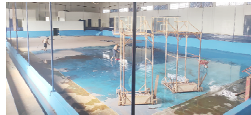
A área interna também foi revitalizada

esportiva espera por esta melhoria”, disse.