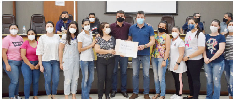
No total foram repassados ao município recursos da ordem de R$ 1,8 milhão

Ao todo, R$ 1,8 milhão foi repassado para o município através de uma ambulância zero-quilômetro, bem como recursos para custeio da saúde, uma motoniveladora e dinheiro para a agricultura que, segundo o deputado, estarão auxiliando nos serviços prestados para a comunidade.