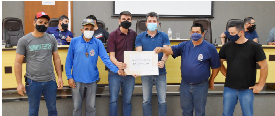
Recursos foram liberados para atender os mais diversos setores da administração municipal: prefeito e outras lideranças agradecem o empenho do deputado Sérgio Souza

que os avanços registrados na nossa administração, têm a mão do deputado Sérgio Souza”, destacou. A secretária de Saúde do município, Roberta Carpiní lembrou que a nova ambulância vai reforçar a frota da saúde, garantindo mais segurança, conforto e comodidade para os pacientes transportados e para a comunidade.