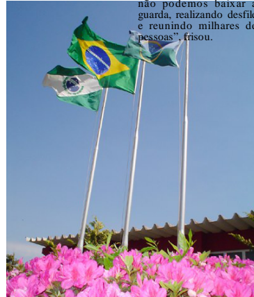
No dia 7 de setembro, haverá ato cívico na Biblioteca

tempo difícil, apesar da queda nos números da pandemia. Mesmo assim não podemos baixar a guarda, realizando desfile e reunindo milhares de pessoas”, frisou.