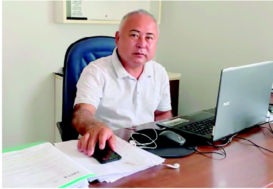
O prefeito Akio Abe: obra já foi licitada e será iniciada nos próximos dias

O anúncio da obra foi feito nesta semana pelo prefeito Akio Abe. “Uma conquista muito importante para nosso município, pois com o prédio próprio teremos melhores condições de atendermos idosos, pessoas com deficiência, vítimas de violência sexual, população em situação de rua e comunidade em geral”, diz ele.