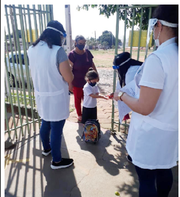
A volta às aulas do maternal acontece dia 30

Ela lembra ainda, que a volta às atividades do Maternal e Berçários, se dá