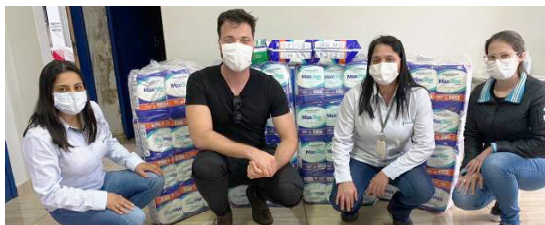
A entrega das fraldas aconteceu durante esta semana: apoio aos idosos acamados

A direção da cooperativa informou que ao todo foram arrecadados