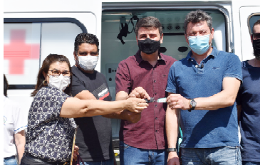
Município recebeu uma ambulância zero-quilômetro

“Com muita alegria que retorno a Moreira Sales trazendo esses recursos que haviam sido firmados em compromisso com a população”, destacou o deputado, parabenizando a administração municipal. “Moreira Sales cresce e avança cada dia mais”,