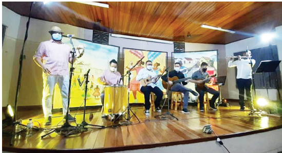
O evento aconteceu na semana passada em Moreira Sales e foi um sucesso

O projeto foi aprovado pela Lei de Incentivo à Cultura do Estado do Paraná