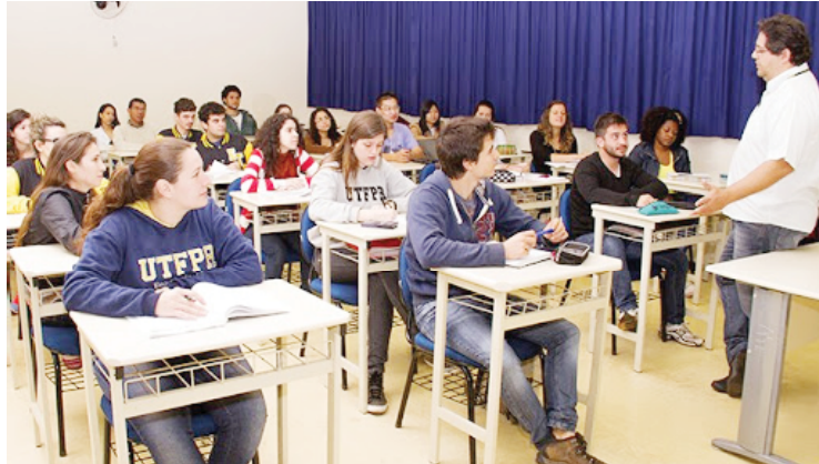
Novo sistema passa a valer à partir do próximo ano: mudanças no ensino médio

Serão elas: linguagens e suas tecnologias; matemática e suas tecnologias; ciências da natureza e suas tecnologias; ciências humanas e sociais aplicadas; divisões vão abranger Língua Portuguesa, Arte, Educação Física, Língua Inglesa, Matemática, Biologia, Física, Química, Filosofia, Geografia, História e Sociologia. Ou seja, nenhuma disciplina será excluída do currículo atual, elas