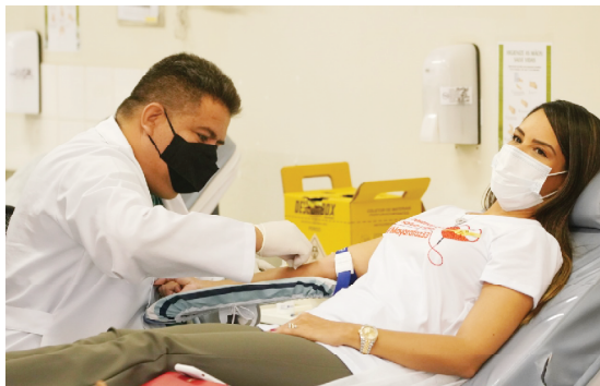
Doadores poderão entrar em contato com a Secretaria de Saúde do Município