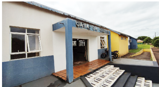
O curso será realizado na casa da cultura: interessados deem fazer inscrições

O curso vai acontecer na própria Casa da Cultura, no horário das 13 às 18 horas. As inscrições podem ser feitas na Casa da Memória, que fica na rua José Bonifácio, nº 1.200 próximo ao Posto de Saúde Central. Maiores informações poderão ser obtidas através do telefone 3522 6687.