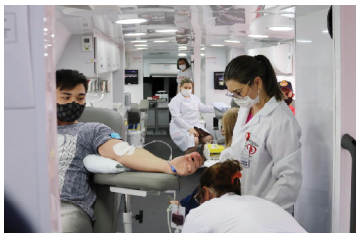
No total foram coletadas 50 bolsas de sangue