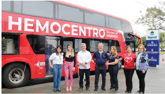
O ônibus do Hemocentro esteve em Goioerê ontem

Adaptado para portadores de necessidades especiais, o ônibus possui recursos, equipamentos e mobiliário personalizado, construídos seguindo critérios funcionais de ergonomia e garantindo uma operação inteligente