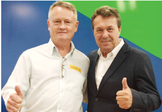
O prefeito Ismael com o deputado Márcio Nunes e ao deputado Márcio Nunes e ao governador Ratinho Junior. Ele lembra que todos os projetos têm contrapartida do Município.

Os recursos que são do programa Paraná Mais Cidades destinam ao Município um caminhão Baú para Coleta de Recicláveis no valor de R$ 243.200,00; um caminhão Coletor de Lixo Compactador na ordem de R$ 321.383,48; dois poços artesianos (Marabá e Bredópolis) que somam R$ 140.000,00 e um caminhão