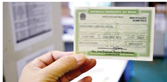
A regularização de eleitor pode ser feita no site do Tribunal Superior Eleitoral

A regularização de eleitor pode ser feita no site do Tribunal Superior Eleitoral (TSE). O prazo também vale para quem vai pedir a primeira via do documento para votar pela primeira vez,