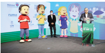
Agrinho vai distribuir até 1.344 smartphones

“A gente quer fazer o maior Agrinho da história, em um concurso com muita capilaridade. Os alunos do 6º ano só vão concorrer com o 6º ano e assim por diante, ou seja, cada um vai concorrer dentro do seu nível de estudo, com chances iguais para todos”, explicou o secretário da Educação, Renato Feder.