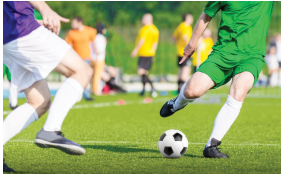
Competição é organizada pelo departamento de esporte

Segundo a organização do evento, as fichas de inscrição podem ser retiradas na subprefeitura de Paraná do Oeste, sendo que a