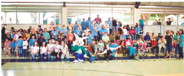
Apresentação contou com a participação de todos os alunos e professores da Apae de Goioerê: alegria e entretenimento

Ainda na oportunidade, além de dançar, os