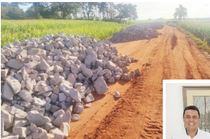
A estrada já recebeu os primeiros carregamentos de pedras para o calçamento

Betinho cita que a pavimentação deste trecho será muito importante, pois desta forma será