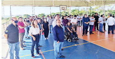
Evento foi prestigiado por várias lideranças