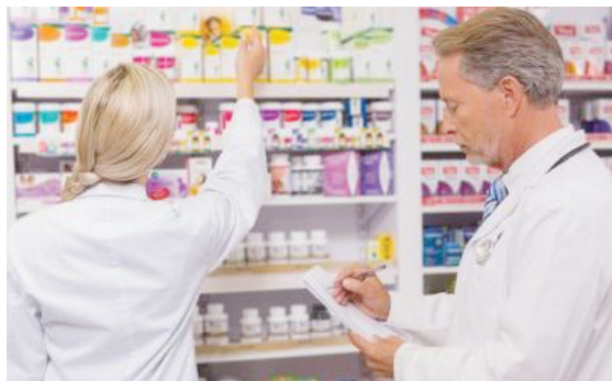
Entre os cursos oferecidos, está o de atendente de farmácia

Os interessados em participar deverão fazer as