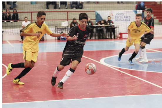
A abertura oficial acontece neste sábado

A competição é realizada pela Secretaria de Estado do Esporte e do Turismo, com