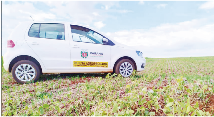
A partir desta sexta-feira fica proibido manuseio das lavouras de soja