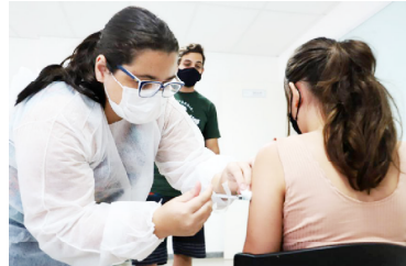
Vacinação será realizada durante todo o dia de sábado