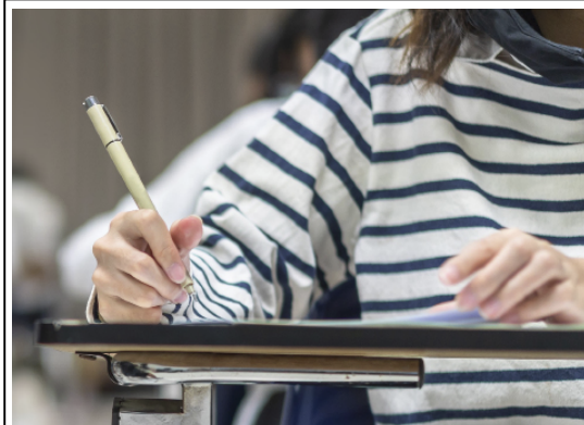
As inscrições gratuitas para a prova presencial vão até 22 de julho, já para a on-line, até 26 de agosto.