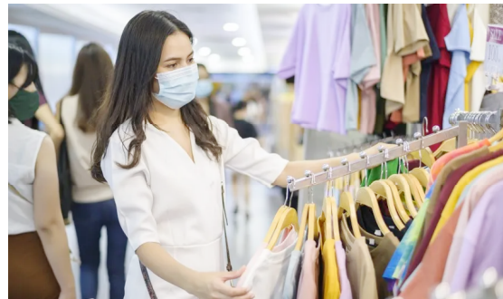
Sorteio da premiação será na próxima segunda-feira

Além dos setores de confecção e calçados, a expectativa é de que o Dia dos Namorados seja movimentado principalmente pelo comércio de flores, perfumes, doces e restaurantes.