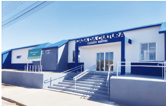
O prédio da casa da cultura foi totalmente revitalizado: obras serão entregues na semana que vem

Dhionatan ressaltou que a reforma também contemplou