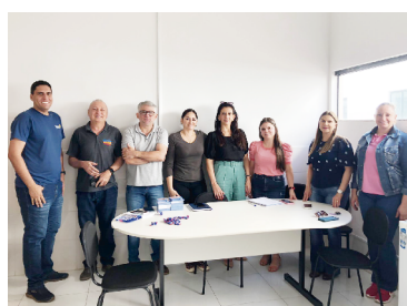
A campanha terá seu ápice neste sábado em Goioerê

FruFest Em duas semanas tem início umas das maiores feiras temáticas do Paraná: a FruFest será realizada em Carlópolis entre os dias 1º e 4 de setembro e com uma programação repleta de atrações nacionais. A feira na Ilha do Ponciano terá rodeio, parque de diversões, exposições e praça de alimentação, entre uma série de atrações e grande estrutura que prometem fazer da 11ª edição a maior FruFest já realizada. A entrada é gratuita.