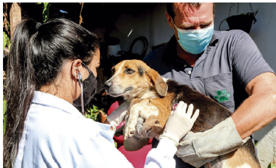
Os interessados no programa devem procurar a secretaria de agricultura até amanhã

Ainda segundo as informações, o cadastramento segue até esta sexta-feira, 19, sendo que as vagas são limitadas. Outras informações podem ser obtidas pelo telefone 3532-1626 e 99949-7091.