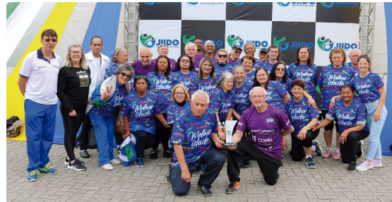
A equipe da terceira idade que conquistou medalhas em Guaratuba