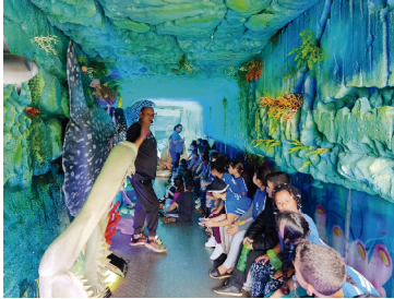
O evento encerrou nesta segunda-feira

O objetivo do projeto é ajudar na conscientização