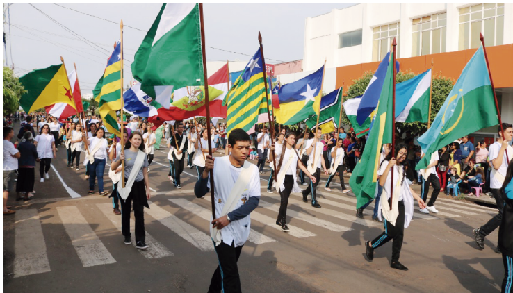
O desfile está programado para ser iniciado às 8 horas, tendo como ponto de partida, a Praça da Rodoviária