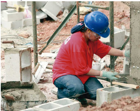
Interessadas devem procurar a secretária de Indústria e Comércio

O curso está programado para acontecer entre os dias 12 e 28 de setembro, com aulas sendo realizadas de segunda a quinta-feira, sempre das 19 às 23 horas.