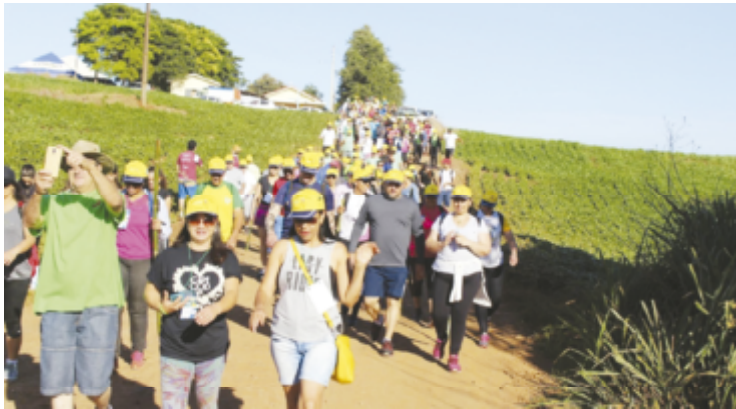
Evento que acontece neste domingo, promete reunir centenas de pessoas

"Estamos esperando pessoas de toda a região para participar da nossa caminhada e toda a nossa equipe está unida em prol desse dia especial", comenta o prefeito