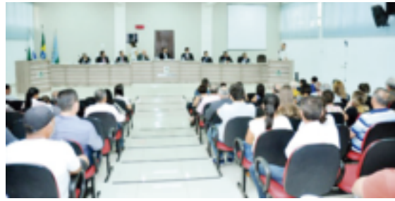
Os vereadores se reuniram na noite de ontem: diversas proposições aprovadas

De acordo com os vereadores, a situação dessa rua não é