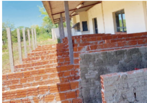
O abrigo está sendo construído com recursos municipais