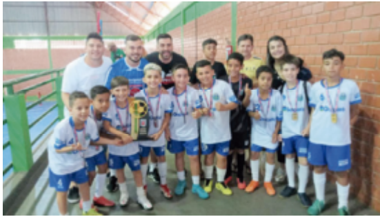
Os jogos aconteceu no último sábado

cipação das nove cidades na competição, o que deixou a edição de 2022 muito forte e equilibrada em quadra, proporcionando assim excelentes partidas para o público que