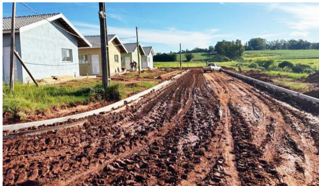
As obras estão a todo vapor: entrega deve acontecer ainda no primeiro semestre

Além da colocação do meio-fio, a empresa responsável está realizando os serviços de terraplanagem das ruas, que em seguida receberá a emulsão asfáltica.