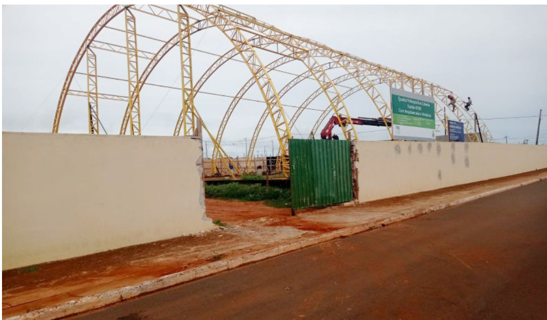
Expectativa é que as obras sejam concluídas até o mês de março

cação é uma das nossas prioridades e os investimentos feitos são resultados de um planejamento