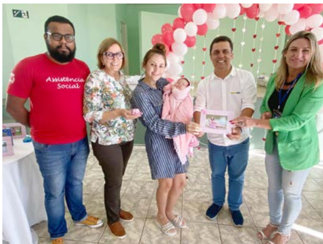
A entrega Kits aconteceu ontem no Centro Múltiplo Uso