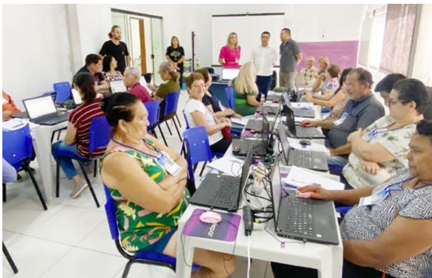
O curso está sendo ministrado no Centro de Convivência do Idoso

“Às vezes, os familiares não têm tempo para