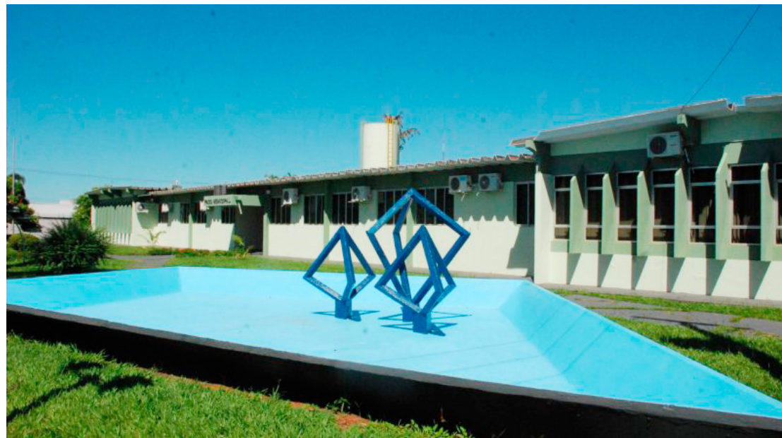
Negociação de juros e multas com descontos é até dias 31 deste mês

Brito lembra que o 'PRO 100' abrange diversos tipos