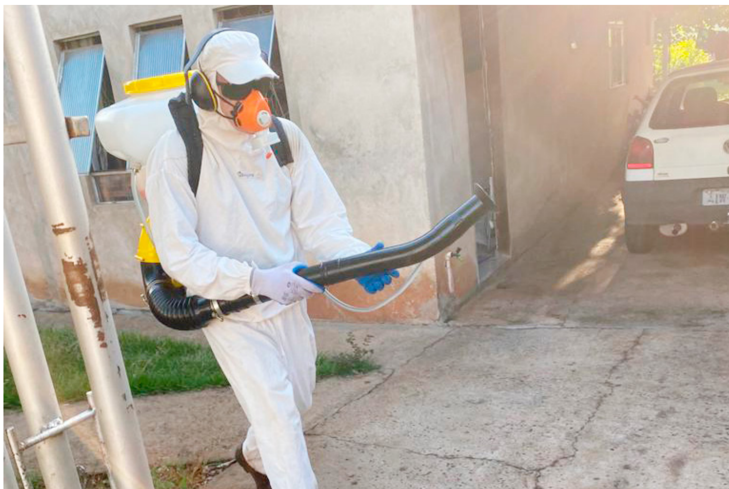
As ações contra a dengue seguem de forma intensa em todos os bairros de Goioerê

A partir dos resultados da pesquisa, o município pode otimizar e direcionar as ações de controle de vetor, delimitar as áreas de maior risco, avaliar as metodologias de controle e contribuir para as atividades