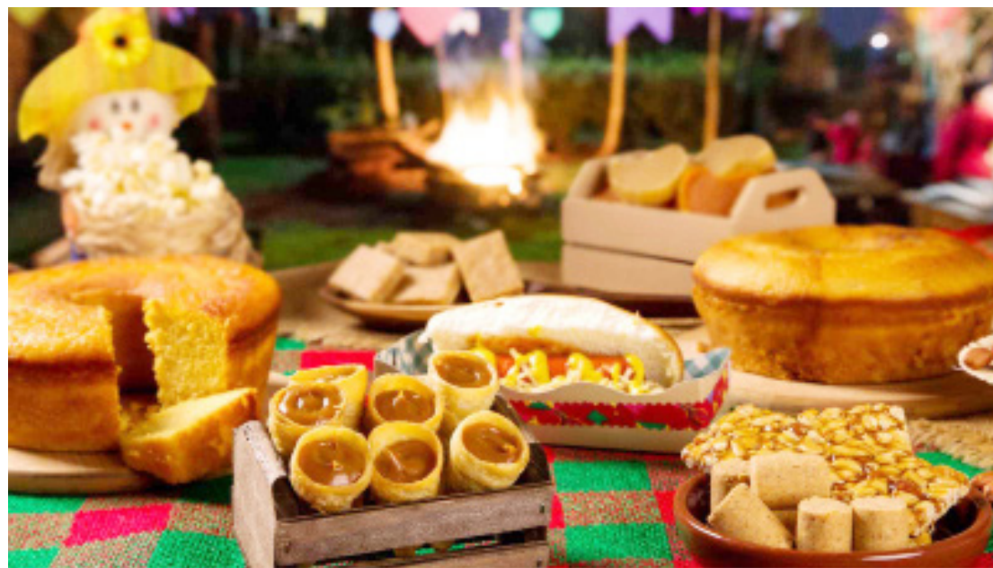
A quermesse contará também com comidas típicas

Para mais informações e detalhes sobre a programação, acesse as redes sociais da Paróquia Nossa Senhora das Candeias ou entre em contato pelo telefone 3522-1732.