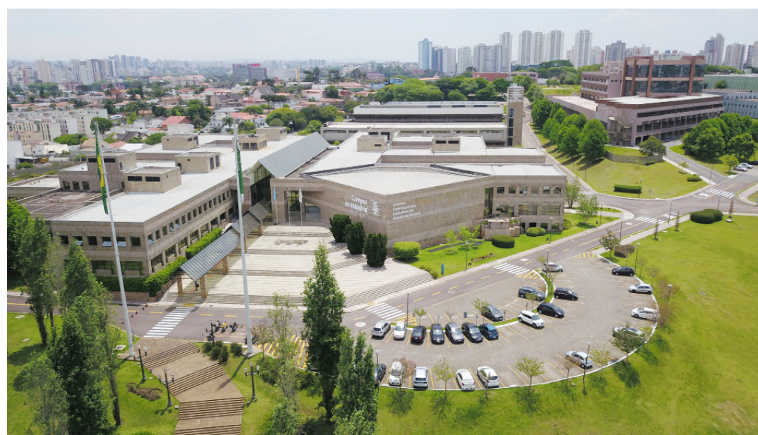
Uma das quatro unidades do UniSenai PR fica no Campus da Indústria, em Curitiba

Para mais informações ou auxílio nas inscrições entrar em contato pelo telefone (44) 3522-2266 ou comparecer a Casa da Cultura na Rua Cuiabá, 720.