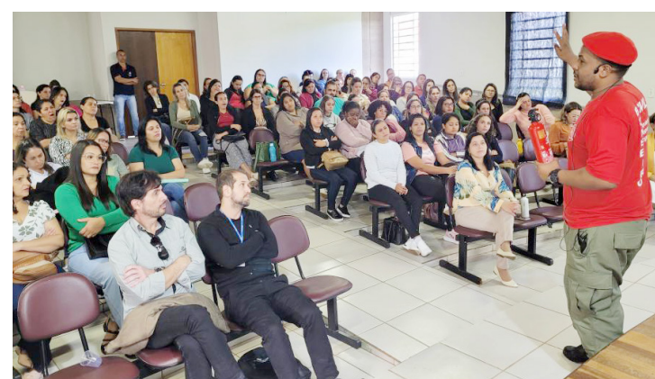
Houve palestra com bombeiros sobre como proceder durante os primeiros socorros na escola