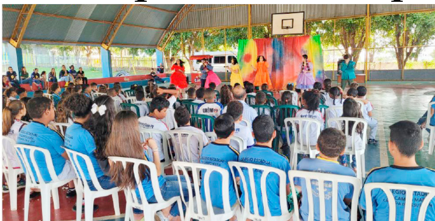
O evento realizado teve o apoio da CMDCA, Conselho Tutelar e Assistência Social

O evento foi preparado pelo CMDCA, Conselho Tutelar e Assistência Social, onde foi realizado na quadra da Escola Municipal Luciane, onde estive-