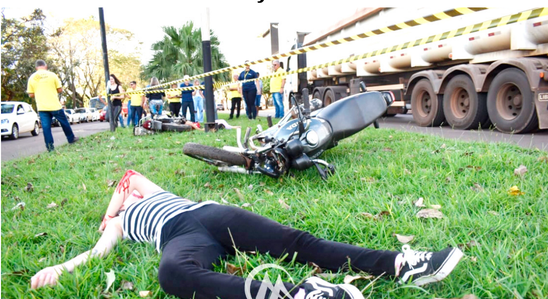
A simulação aconteceu na última segunda-feira

na hora da simulação, acabou impactado pela ação. “Essa foi a intenção, impactar as pessoas que passavam pelo