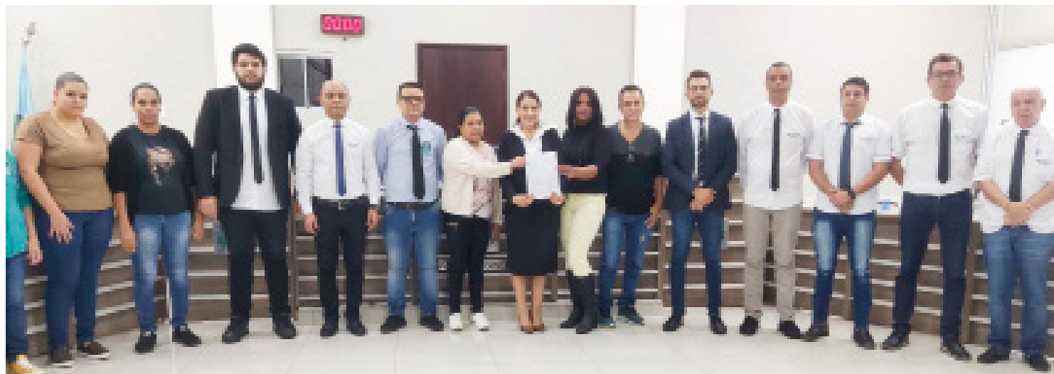
As famílias entregaram pedido de apoio aos vereadores para não serem despejadas

Coluna publicada simultaneamente em 22 jornais e portais associados. Saiba mais em www.adipr.com.br