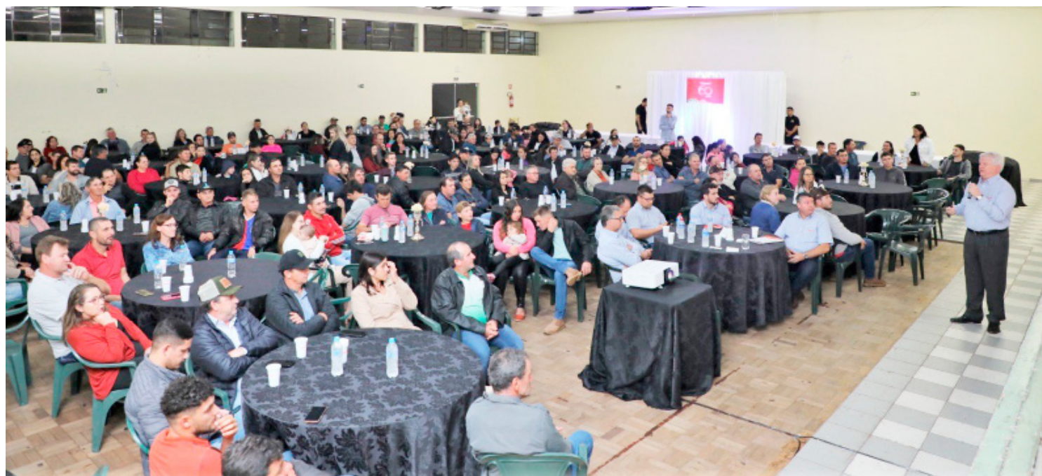
O evento foi realizado com produtores em Salto do Lontra

A Copacol vem expandindo a sua atuação no Sudoeste do Paraná, oferecendo oportunidades para gerar o desenvolvimento agrícola na região. Dessa forma, a Diretoria Executiva esteve com produtores rurais de Salto do Lontra para apresentar as metas da Cooperativa na região. “Nós definimos na nossa estratégia de crescimento e busca por matéria-prima para as nossas integrações investir no Sudoeste do Estado. Essa é uma importante região e o nosso objetivo é também participar do mercado aqui, contribuir com o desenvolvimento do local. Estamos em ritmo de crescimento e maior participação no Sudoeste, atendendo ao produtor, levando a nossa prática do cooperativismo e proporcionando oportunidades aqueles produtores que desejam associar-se a Cooperativa e buscar as mesmas