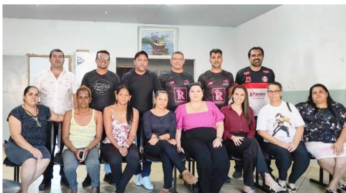
A nova diretoria da entidade foi eleita no último sábado

Durante sua fala, na solenidade de posse, a nova presidente anunciou que estará se reunindo com os integrantes da nova diretoria e com a equipe de colaboradores para definir