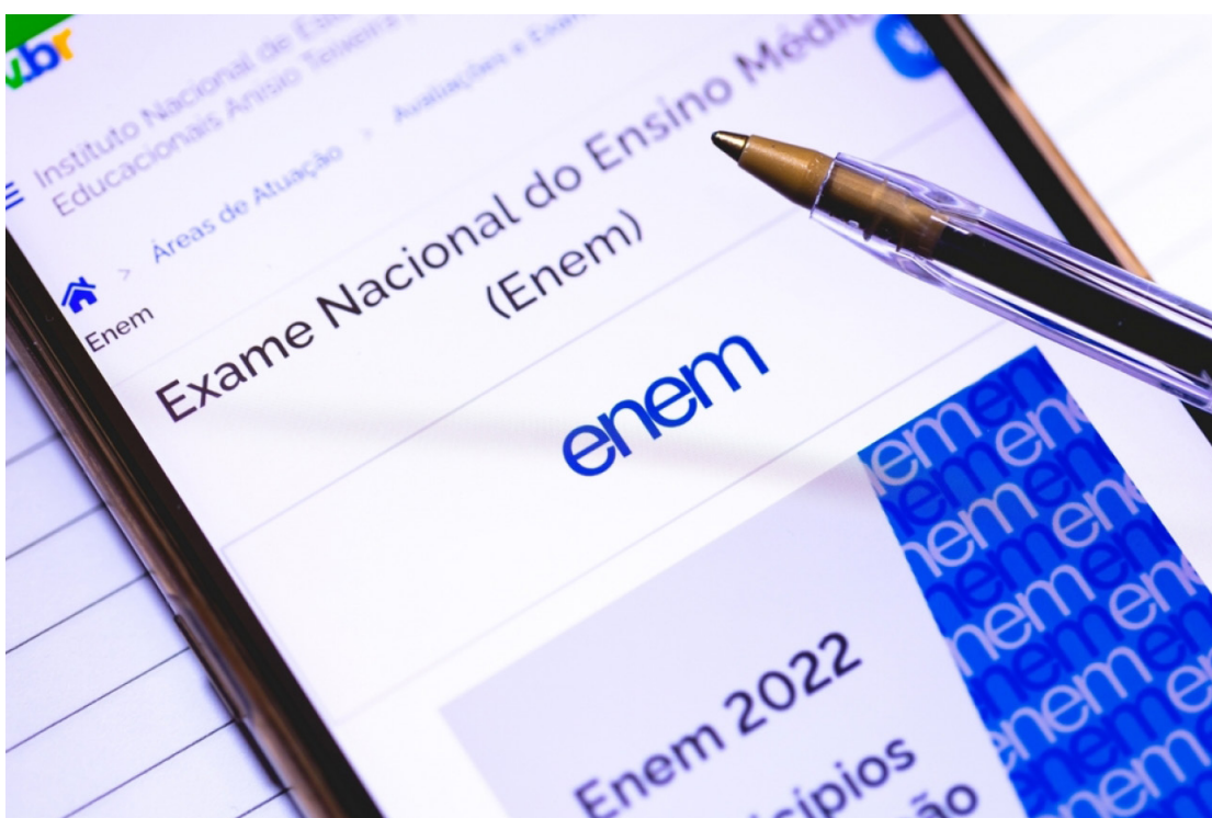
- As inscrições seguem abertas até o próximo dia 16 deste mês

PROVADAS: - Segundo o Inep - Instituto Nacional de Estudos e Pesquisas, os gabaritos das provas serão publicados no dia 24 de novembro no portal do próprio Inep. Já os resultados