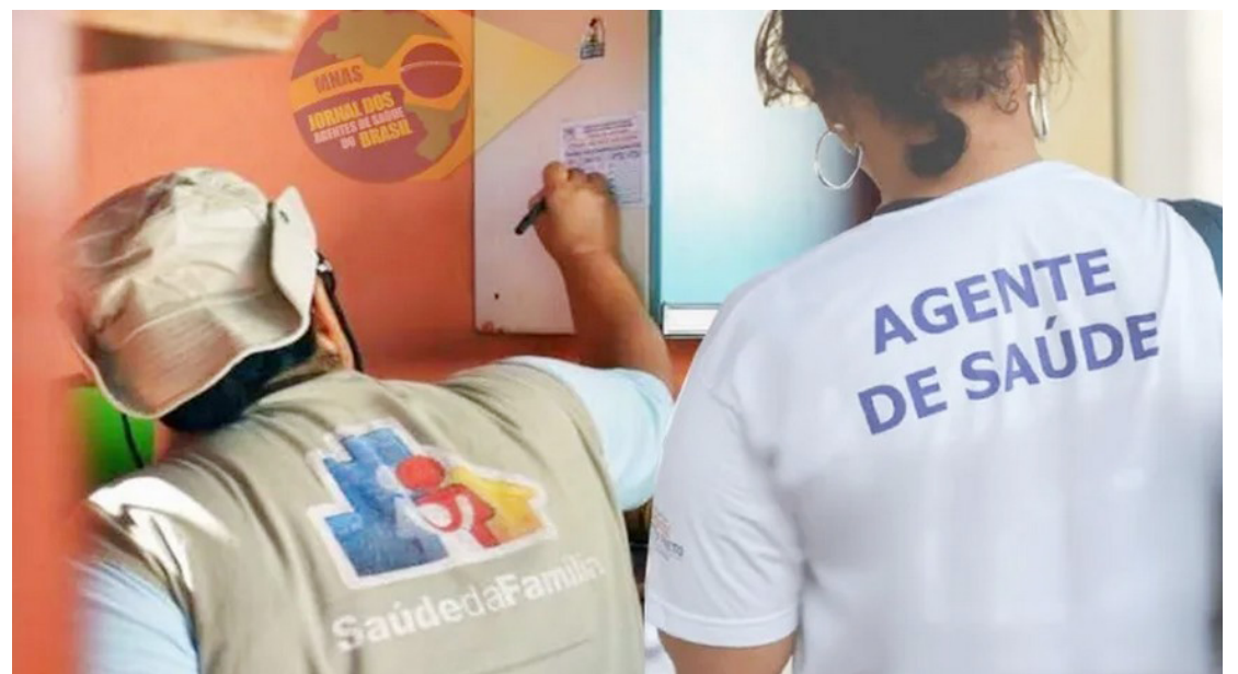
No total 14 agentes serão contratados pela prefeitura

Com a autorização, acredita-se que a Prefeitura publique nos próximos dias o edital do Processo Seletivo Simplificado, com as normas para a contratação,