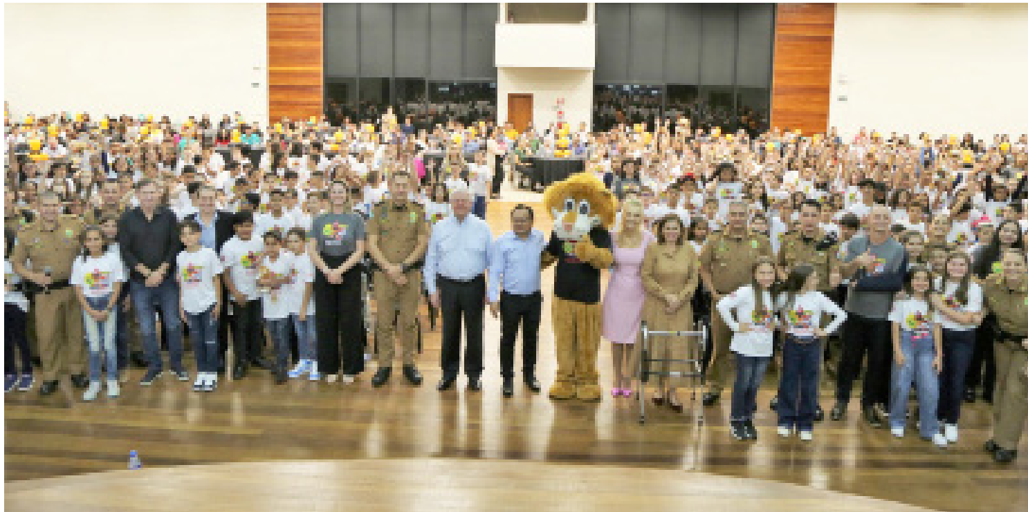
Ao todo, 800 crianças receberam o certificado de conclusão do Proerd

As formaturas foram realizadas nos municípios, com a participação de familiares, policiais militares e autoridades municipais. O entusiasmo em receber a certificação foi grande em cada solenidade, onde as