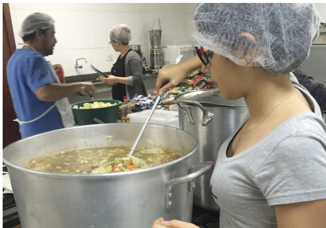
Os pedidos já pode ser feitos através de WhatsApp

O valor do convite é de apenas R$ 30,00 e os interessados em fazer pedidos poderão ligar para o telefone (44) 9905-0733, falar com a Eliza. "Desde já queremos agradecer a todos que colaborarem conosco", disse ela.