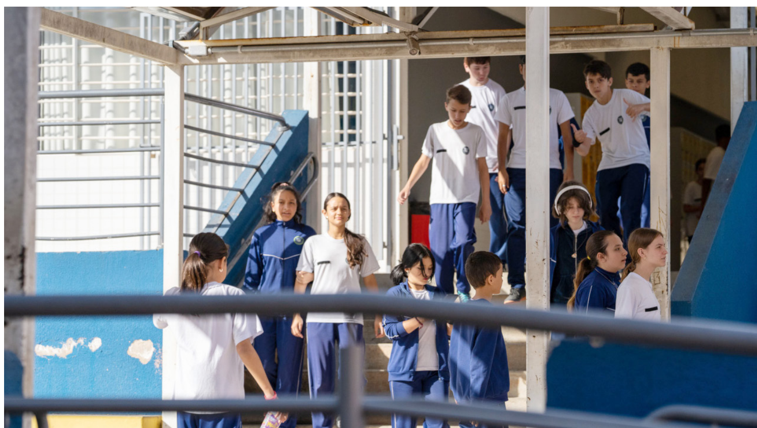
As aulas do primeiro semestre se encerram nesta sexta-feira em todo o Paraná

Antes de os estudantes retornarem às aulas, os professores e demais profissionais da equipe pedagógica vão se dedi-