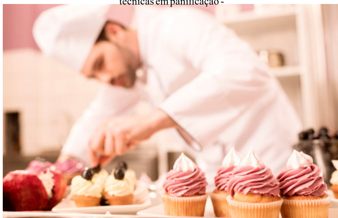
O curso será ministrado através de parceria da Prefeitura com o Senac

Interessados poderão obter maiores informações na Secretaria de Indústria e Comércio, que fica localizada na Avenida Tiradentes, 150, ou pelo telefone 3522-2790.