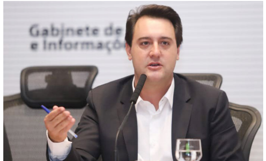
Três a cada quatro paranaenses aprovam a gestão de saúde pública de Ratinho Junior.

A pesquisa Radar também mapeou outras informações relevantes