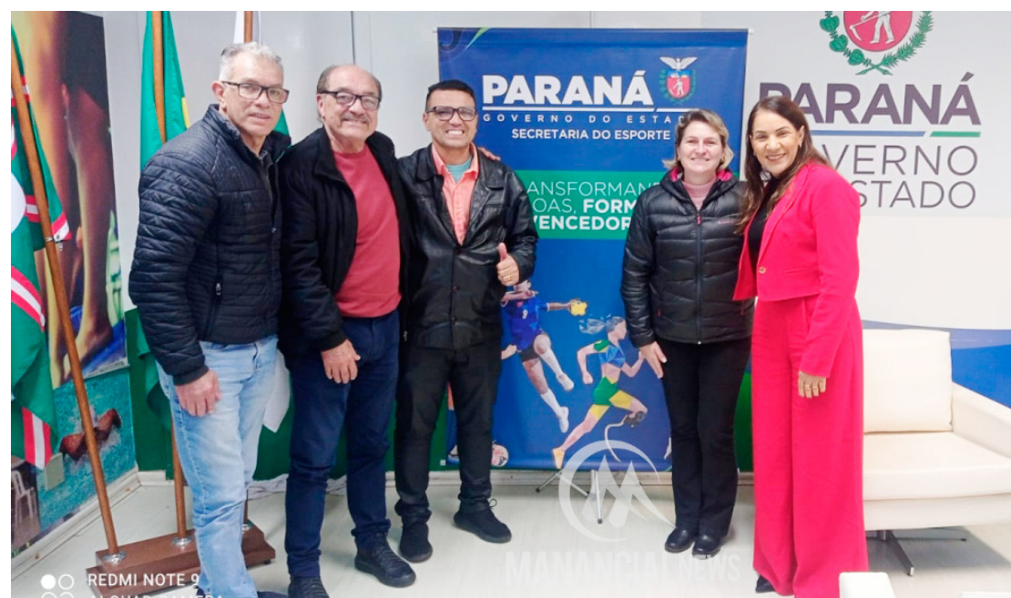
Os pedidos foram apresentados na Secretaria de Esportes: materiais para as entidades

O vereador ‘Paraíba’ explica que esses materiais são muito importantes para auxiliar as entidades na realização das atividades para as crianças e adoles-