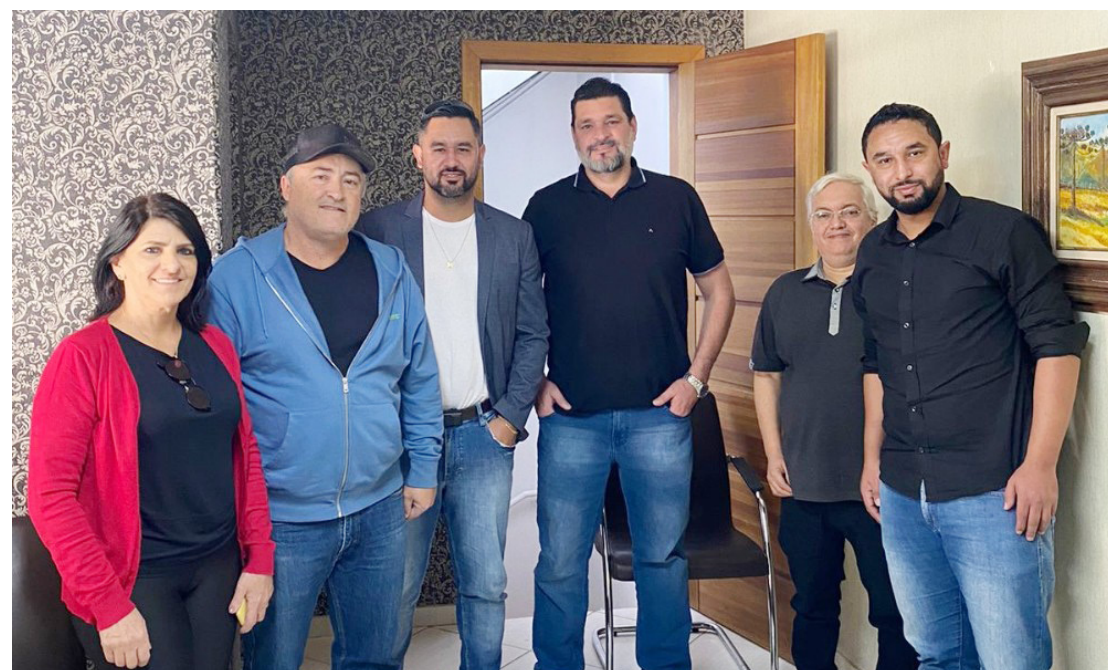
Diretores do CIS-Comcam durante visita feita em casas de apoio na capital do estado