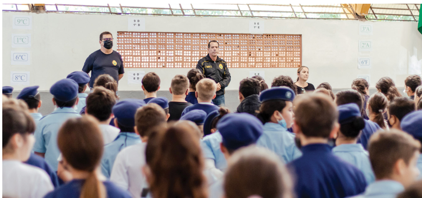
Período de inscrições vai até o dia 30 de julho. Resultado sai 29 de setembro. Os militares atuarão nas 12 escolas federais que passam à gestão do Estado e nos 194 colégios que já fazem parte do programa estadual.

O processo seletivo leva em consideração os requisitos estabelecidos na Lei nº 21.327, de 20 de dezembro de 2022, entre eles, o número de vagas, locais de atuação e demais informações (veja o edital). O período de inscrição se encerra no