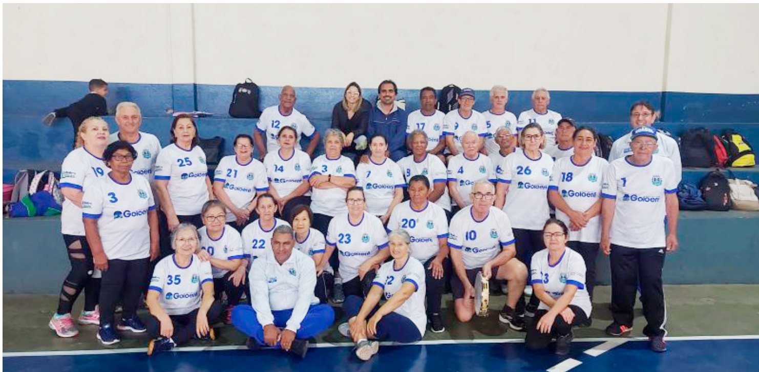
As equipes de Goioerê alcançaram bons resultados em Cafezal do Sul

O torneio em Cafezal contou com a participação da equipe da casa, além de times de Goioerê, Araruna e Peabiru, com partidas muito disputadas nas modalidades de vôlei câmbio, vôlei no