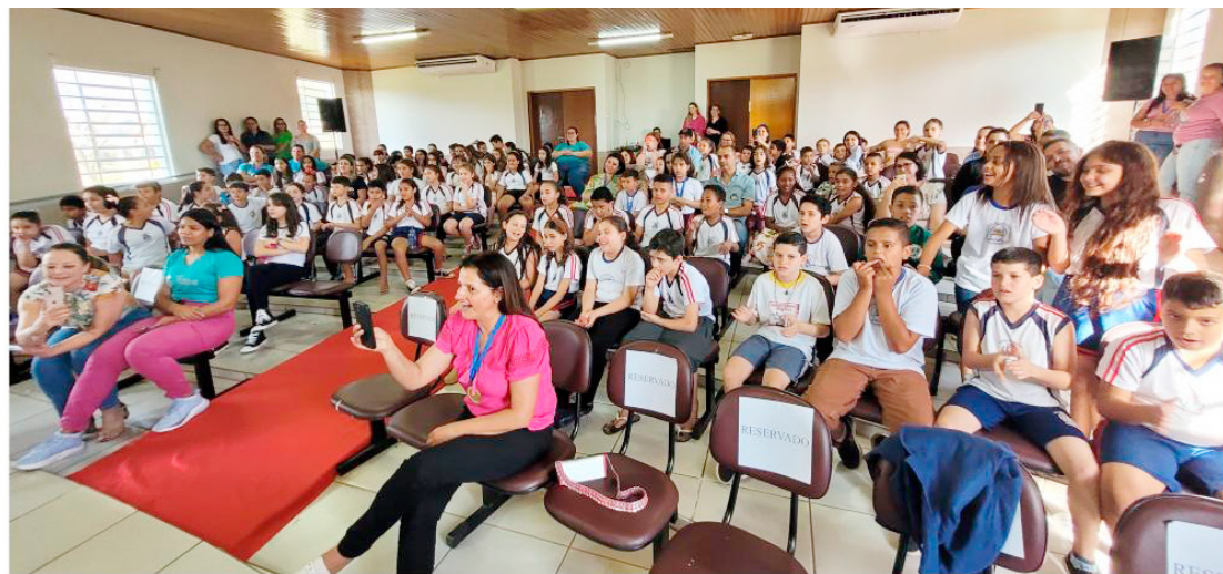
Professoras, diretoras e pais de alunos vibraram com os resultados do concurso

Após o desfile foi feita a entrega da premiação, que contemplou alunos nas categorias de redação, desenho e relato escola Agrinho.