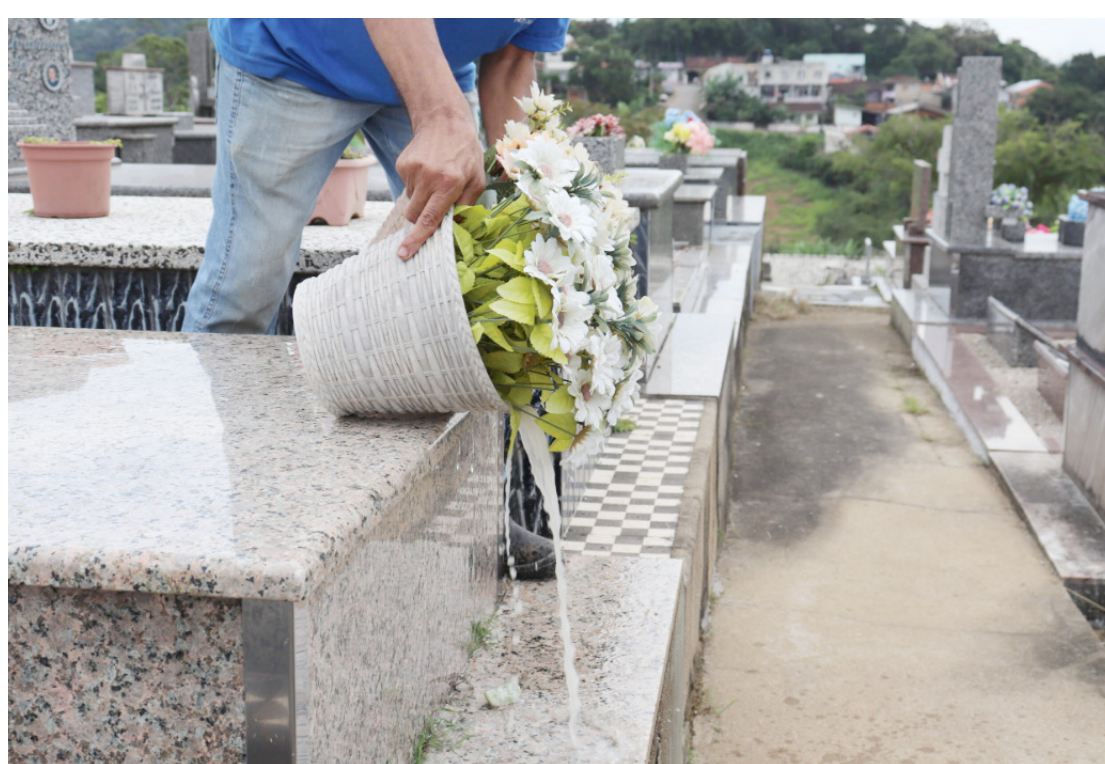
Orientação é não deixar vasos com água parada para evitar a proliferação do mosquito da dengue