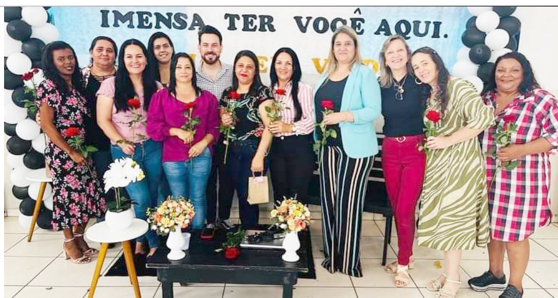
As merendeiras foram homenageadas pelo seu dia em Quarto Centenário

A secretária aproveitou a noite festiva para agradecer o empenho e dedicação das merendeiras do município, e reforçou ser um compromisso da administração, a valorização destas profissionais que muito contribuem para os avanços