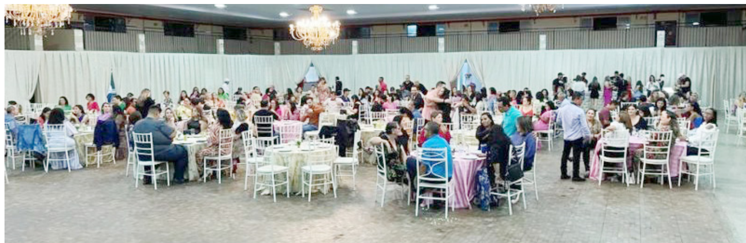
Centenas de servidores participaram do evento realizado no Clube de Campo na sexta-feira

Uma bonita festa foi realizada na última sexta-feira, para comemorar o Dia do Servidor em Goioerê. O evento foi no salão social do Clube de Campo, onde foi