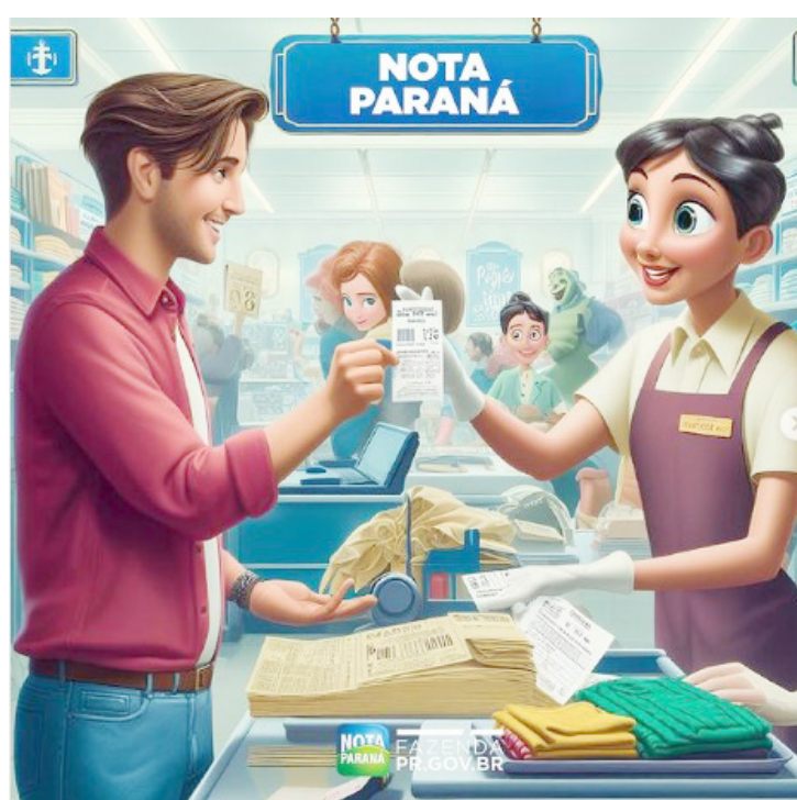
O evento será realizado em Goioerê

Com o tema “Controle Social e Reforma Tributária: E eu com isso?”, o encontro presencial ocorrerá na sede do Rotary Club de Goioerê, e ambos os dias do evento serão transmitidos ao vivo pelo canal da Efaz-PR no YouTube.