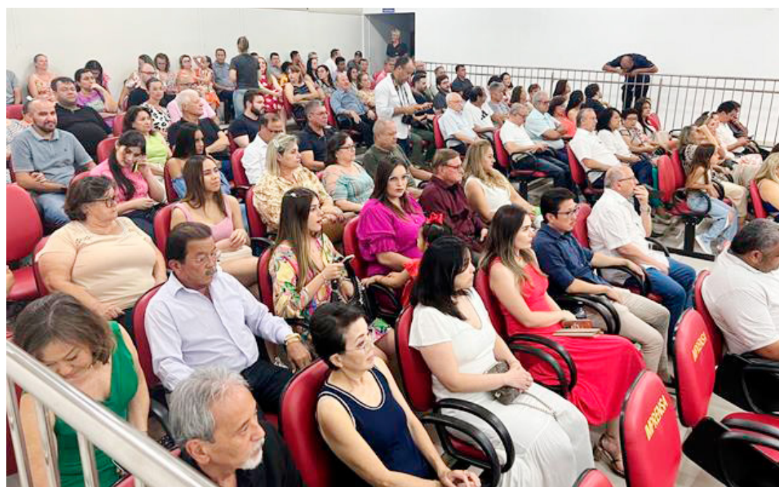
Muita gente prestígio a sonalidade de homenagem aos médicos pioneiros de Goioerê