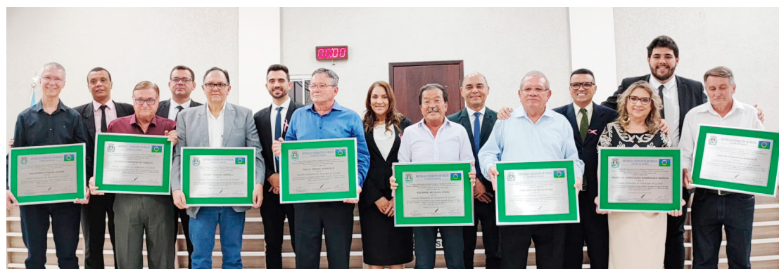
No total 10 médicos foram homenageados em noite festiva na Câmara Municipal

“É o momento de agradecer a estes médicos por tudo que fizeram e ainda fazem pela saúde da nossa comunidade e também de tornar público a importância do trabalho que cada um deles realizou nestes mais de 30 anos de atuação