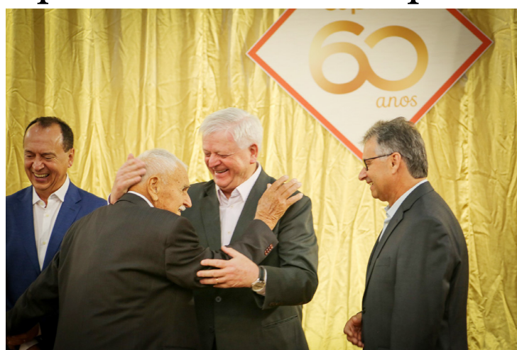
A homenagem aconteceu no último final de semana em Cafelândia