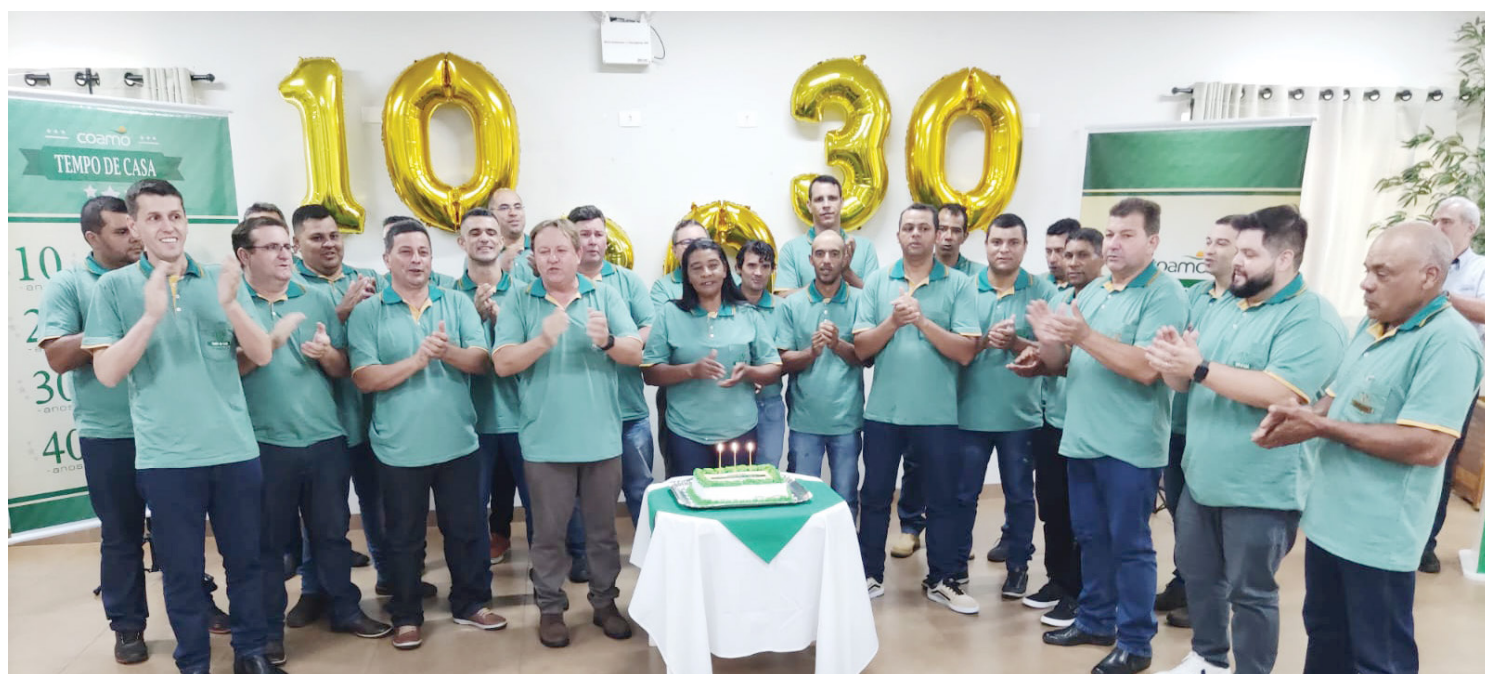
No total 26 funcionários foram homenageados na Regional da Coamo em Goioerê

Em Goioerê, 26 colaboradores foram homenageados pela Coamo, sendo que 16 trabalham há 10 anos na cooperativa, 9 prestam serviços há 20 anos e um completa 30 anos. "É uma homenagem justa e merecida. Estamos felizes pelos nossos cola-