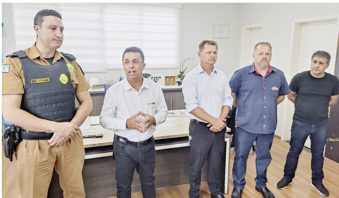
Apresentação do novo oficial foi prestigiada por lideranças da cidade

Durante sua fala, o novo comandante disse que chega em Goioerê para ficar, acrescentando que colocará a experiência e conhecimentos que adquiriu ao longo da carreira, para garantir mais segurança na cidade.