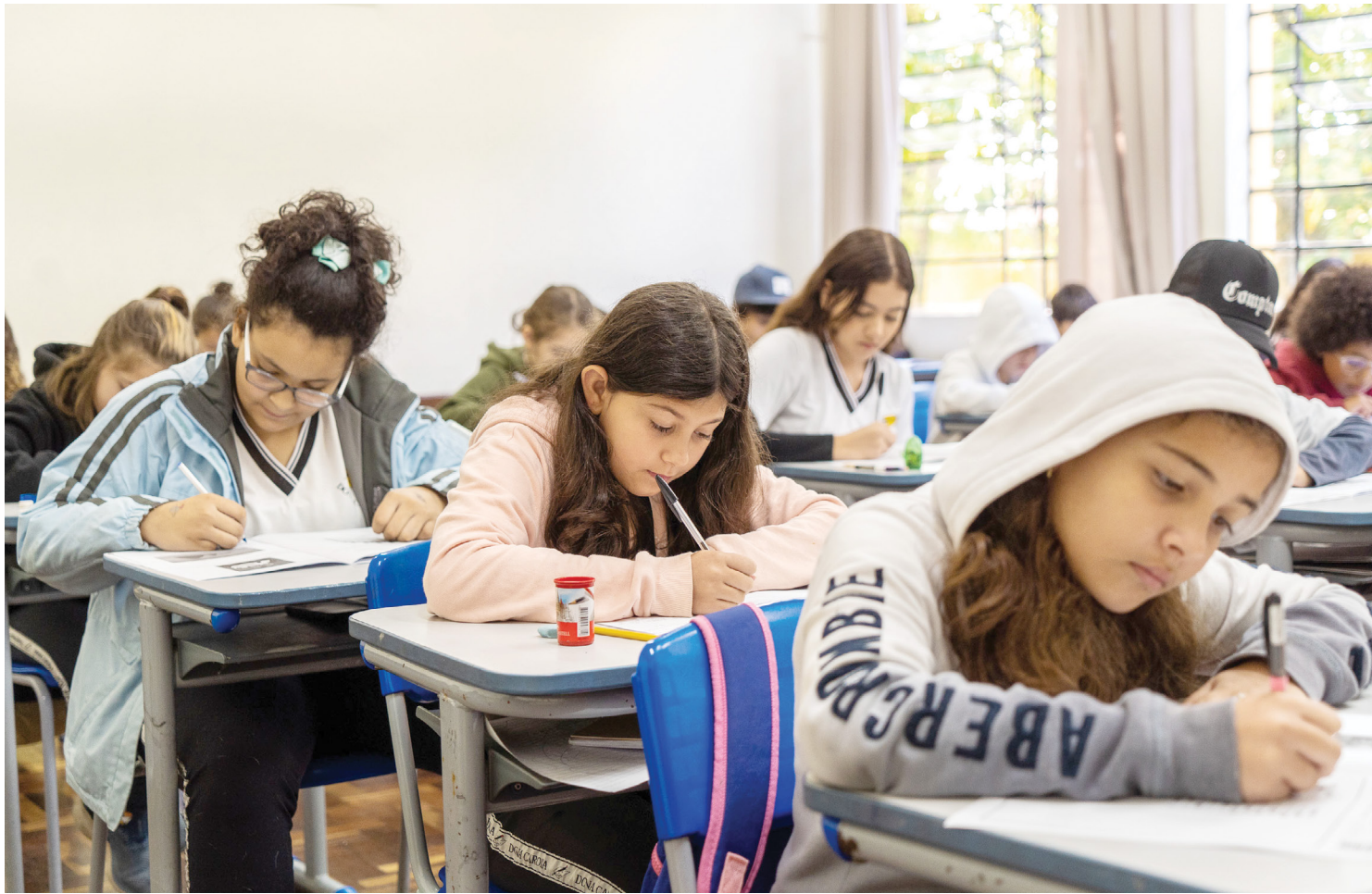
Aplicação do Saeb 2023 vai até 10 de novembro. Sistema é um conjunto de testes para obter um diagnóstico da educação básica brasileira, incluindo escolas públicas e privadas.

Os testes abrangem o desempenho dos estudantes nos componentes curriculares de matemática e língua portuguesa, servindo como ferramenta de monitoramento da aprendizagem. Além das provas realizadas pelos estudantes, o Saeb contempla também questionários que devem ser respondidos por secretários municipais da Educação, diretores de escolas, pro-