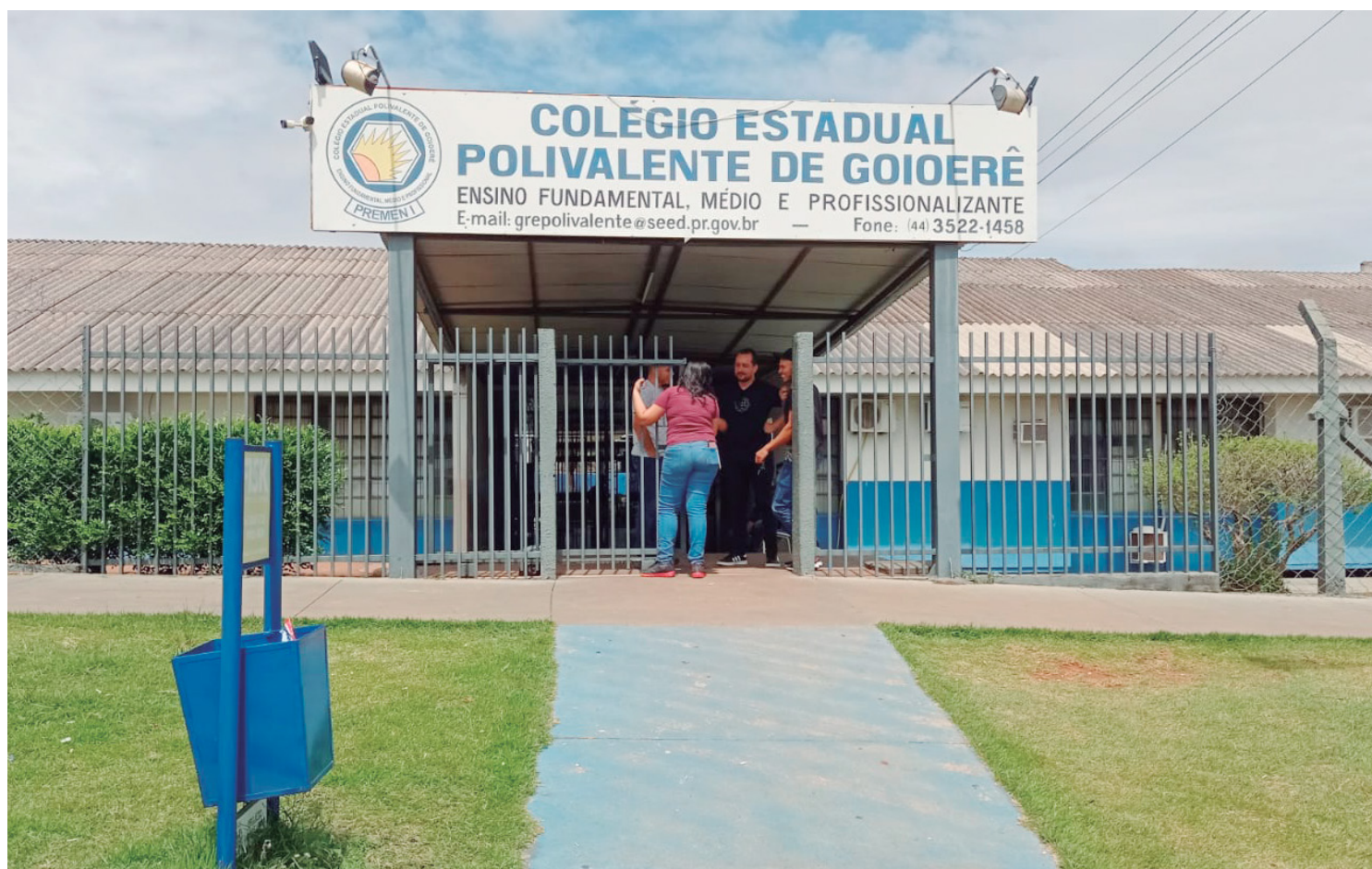
As matrículas estão abertas e interessados devem procurar a secretaria do colégio

No período em que os alunos estão no colégio, são oferecidas 5 refeições, inclusive café da manhã. Em seguida, às 10 horas é servido um lanche e às 12 horas o almoço, com cardápio diferenciado para todos os dias. No período da tarde, às 14:40 horas, é servido mais um lanche, assim também como na saída do colégio.