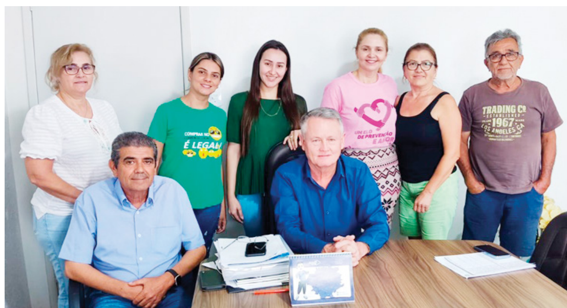
A definição da programação foi feita pela comissão que organiza os festejos da cidade