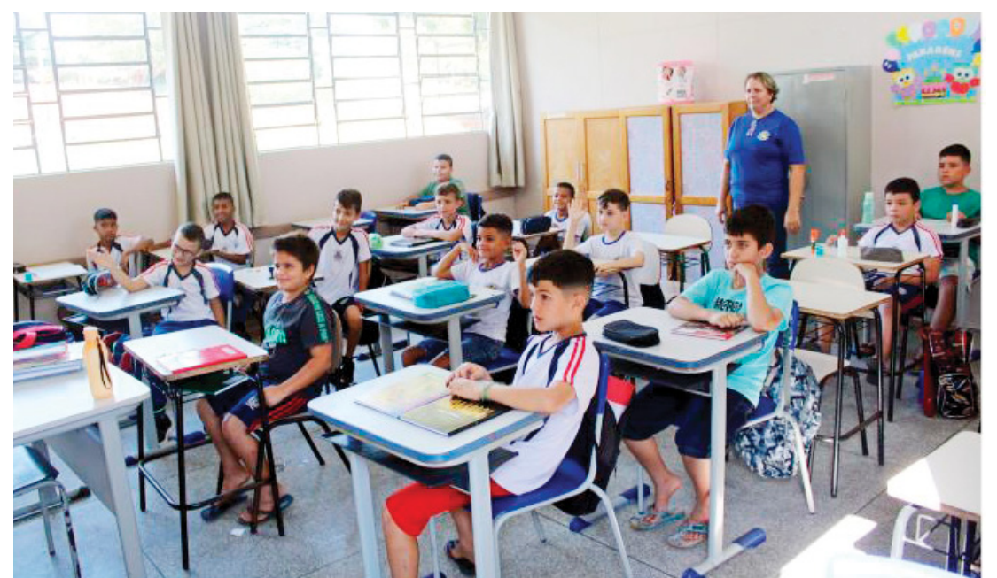
O período de matrícula e rematricula já começou em Moreira Sales

A Prefeitura do Município de Moreira Sales, através da Secretaria Municipal de Educação, está informando aos pais e responsáveis, que já foi iniciado o período de matrículas e rematrículas para o ano letivo de 2024.