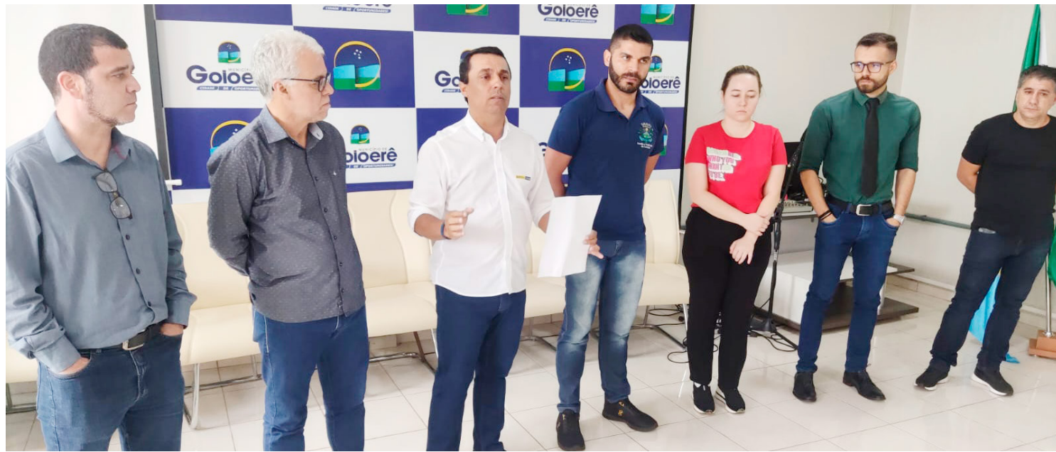
O anúncio da comissão foi feito nesta quarta-feira: intervenção