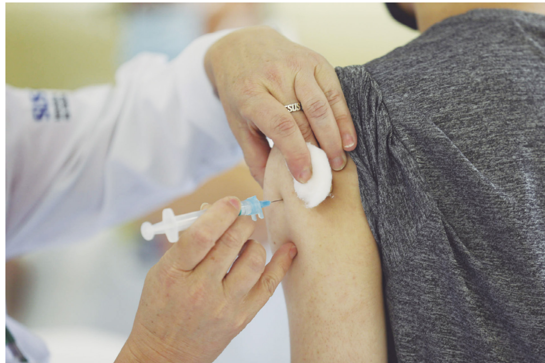
A vacinação está programada para o próximo sábado nas UBS de Goioerê

graves de Tuberculose) para menores de 1 ano estará disponível no sábado, das 8 às 12 horas e das 13 às 17 horas.