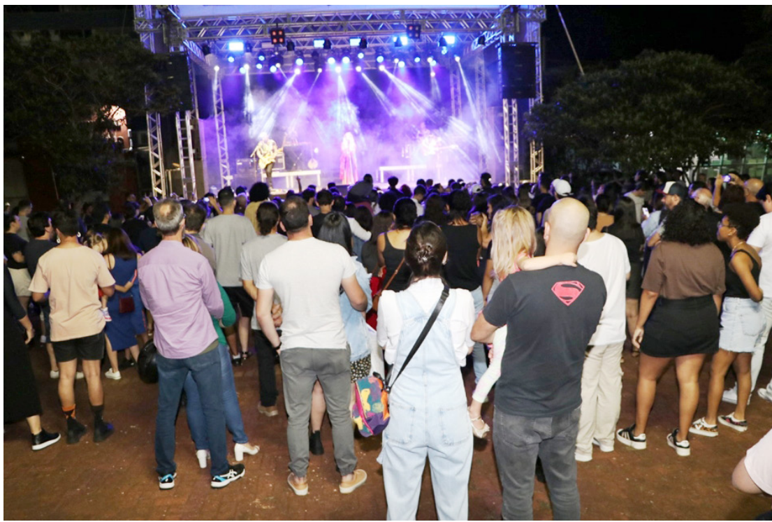
A abertura do evento aconteceu no último domingo, com show em praça pública

A Festa Literária é uma das demonstrações do investimento do município na produção li-