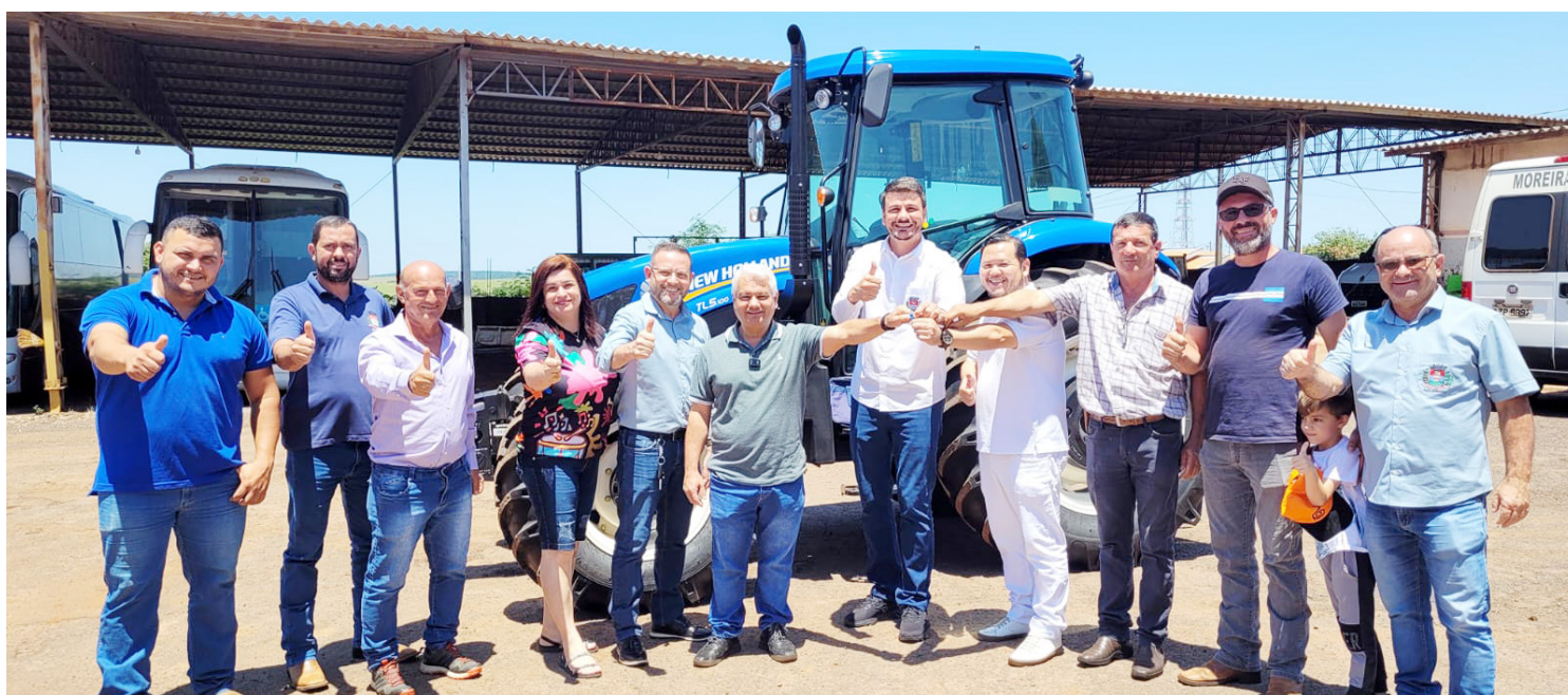
- O trator foi entregue na última segunda-feira: conquista importante

Coluna publicada simultaneamente em 22 jornais e portais associados. Saiba mais em www.adipr.com.br