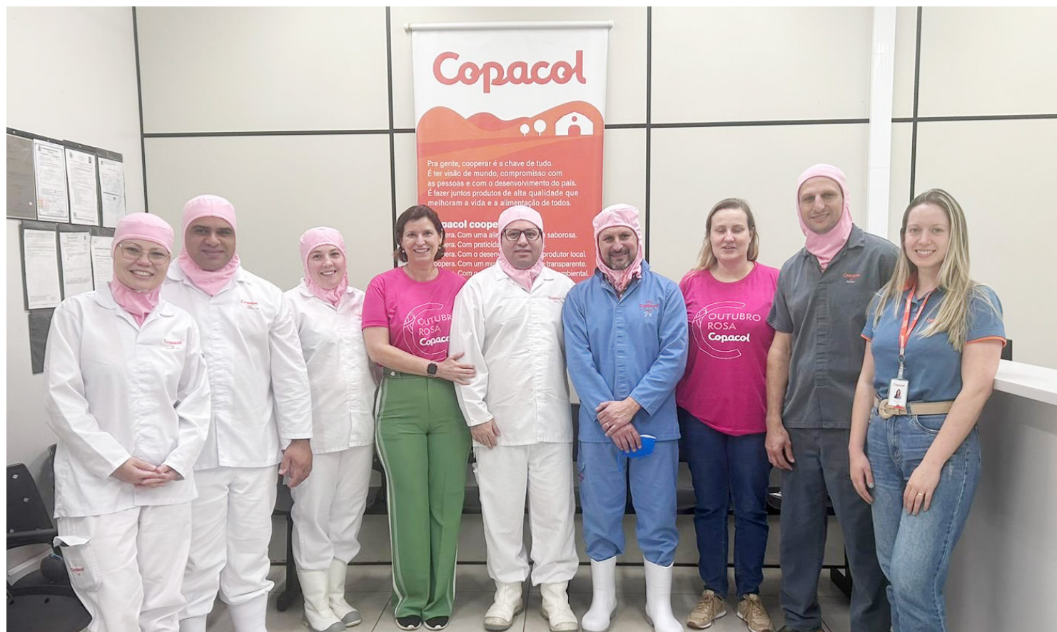
A estrutura da Cooperativa em Nova Aurora conquista a certificação pelo quinto ano consecutivo.