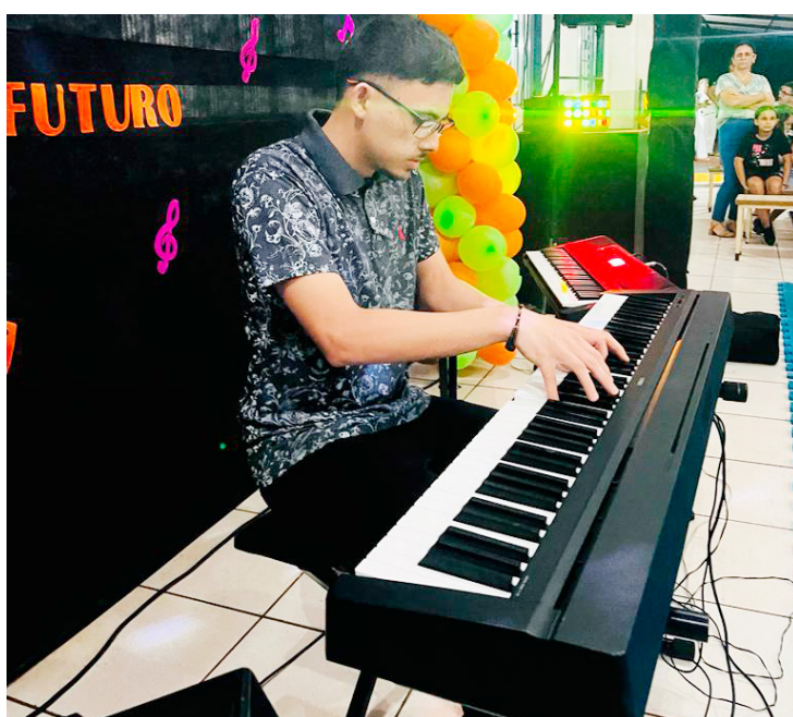
As apresentações aconteceram na última quarta-feira: show de talentos

nizou aos alunos, mostrar aquilo que aprenderam durante o ano de 2023. O projeto oferta diversas atividades musicais e instrumentais, como xilofone, boomwhackers, violão, teclado.