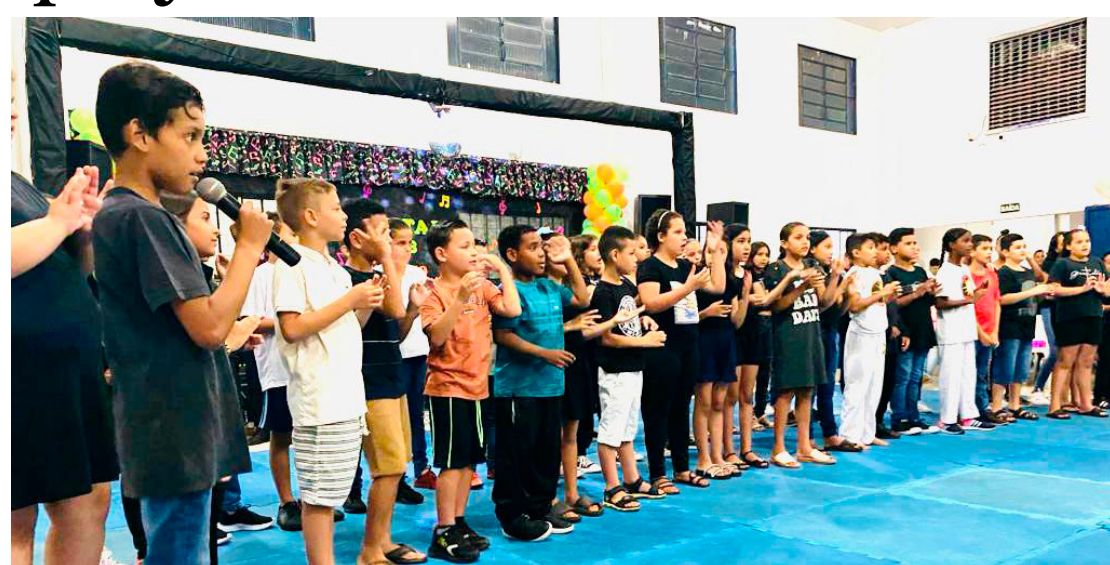
Centenas de crianças são atendidas pelo projeto Cidadãos do Futuro de Quarto Centenário

O recital foi na sede do projeto e oportu-