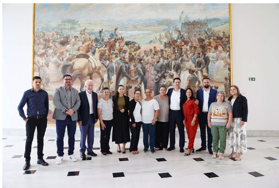
De alto desempenho agrônomo, a IPR Cardeal é semiprecoce (ciclo de 78 dias), tem potencial produtivo que pode passar de 3,5 toneladas por hectare e apresenta bom comportamento frente às principais doenças que afetam a cultura.

MODERNIZAÇÕES – O projeto altera a Lei Complementar 123/2008, que instituiu o Quadro de Funcionários da Educação Básica no Estado. Os quadros funcionais indicam o plano de cargos, carreiras e vencimentos