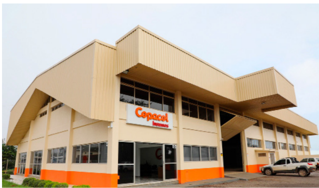
Nova unidade de insumos na cidade de Barracão

Além de Barracão, a estrutura instalada na BR-163, entrada da cidade, passa a concentrar atendimentos ao município de Bom Jesus. Essa é a mais recente estrutura exclusiva a comercialização de produtos. Outras estão em operação nos municípios de Ampére, Salto do Lontra e Realeza.