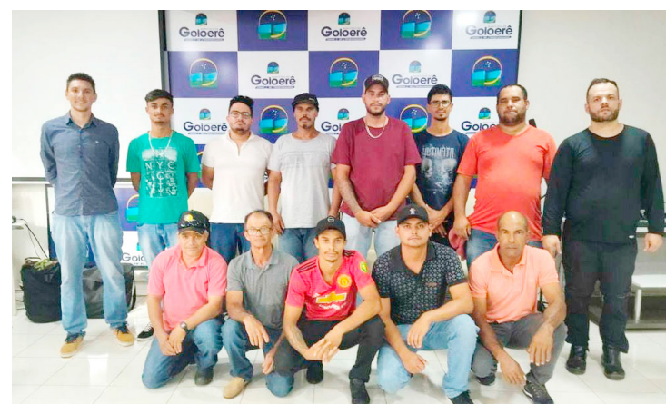
12 pessoas participaram do treinamento

No total 12 candidatos participaram do treinamento, que teve como alvo trabalhadores rurais, de cooperativas, pintura e telefonia, entre outros, que exerçam atividades em altura.