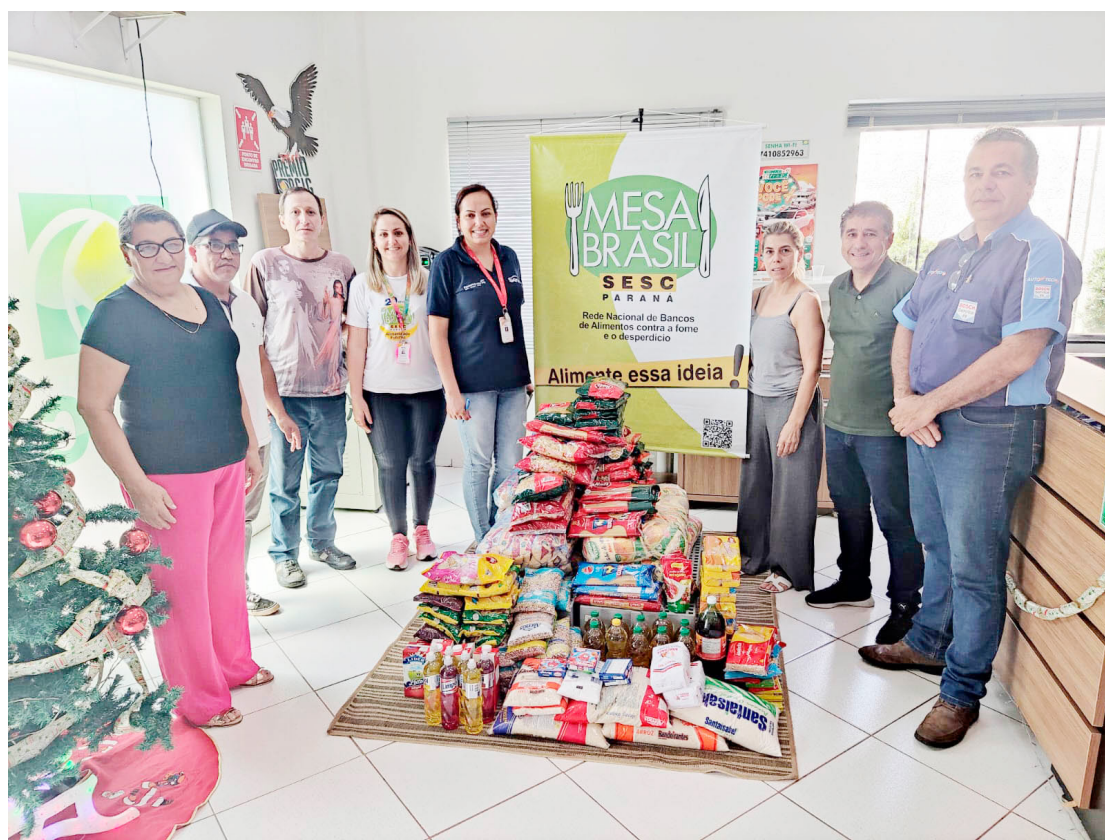
No total nove entidades foram beneficiadas com a distribuição dos alimentos