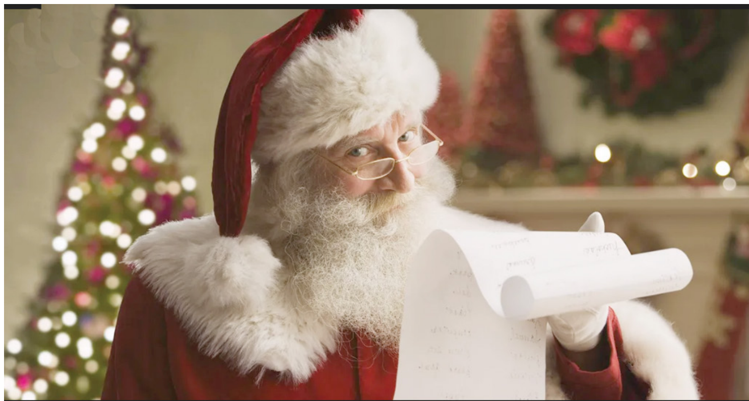
A chegada do Papai Noel também acontece nesta sexta-feira à noite

A chegada do Papai Noel é uma tradição no Município que está ligada à festividade do dia de Natal, ou seja, o 25 de dezembro, e ao nascimento de Jesus Cristo. A crença no Papai Noel está associada a