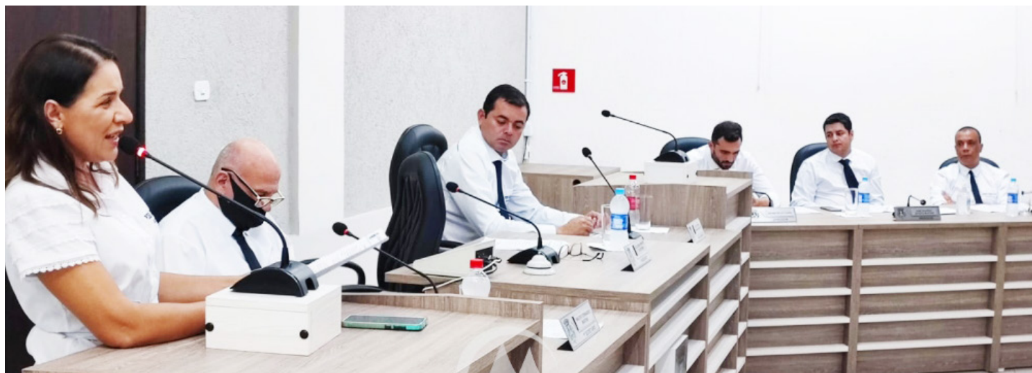
No total mais de R$ 1,4 milhão será repassado para as entidades pelos vereadores de Goioerê

Coluna publicada simultaneamente em 22 jornais e portais associados. Saiba mais em www.adipr.com.br