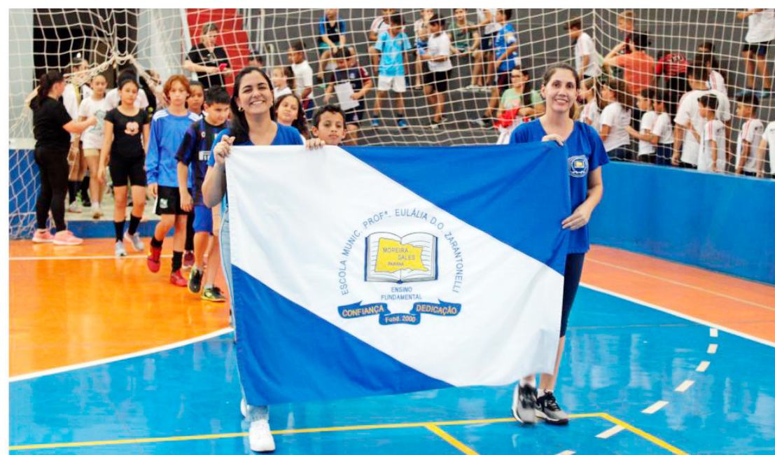
No total são cinco escolas representadas por seus alunos nos Jogos Escolares Municipal