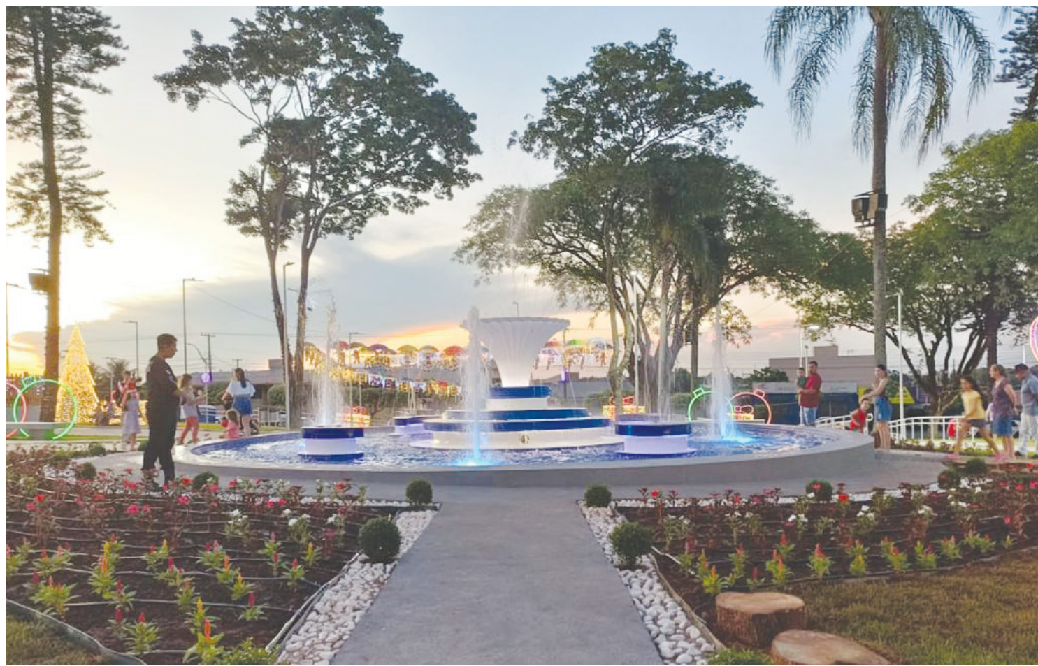
A Fonte Luminosa é uma das principais atrações da Praça da Matriz, que foi totalmente revitalizada

Além da fonte luminosa, a reestruturação