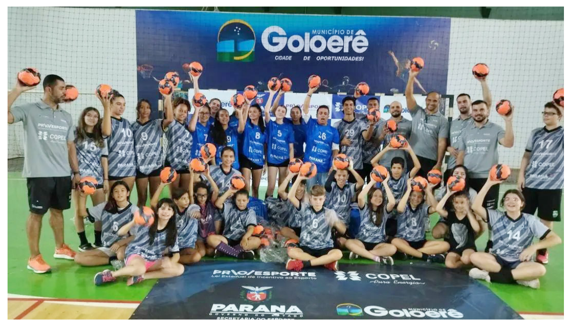
A entrega dos materiais aconteceu na sexta-feira: conquista para o handebol