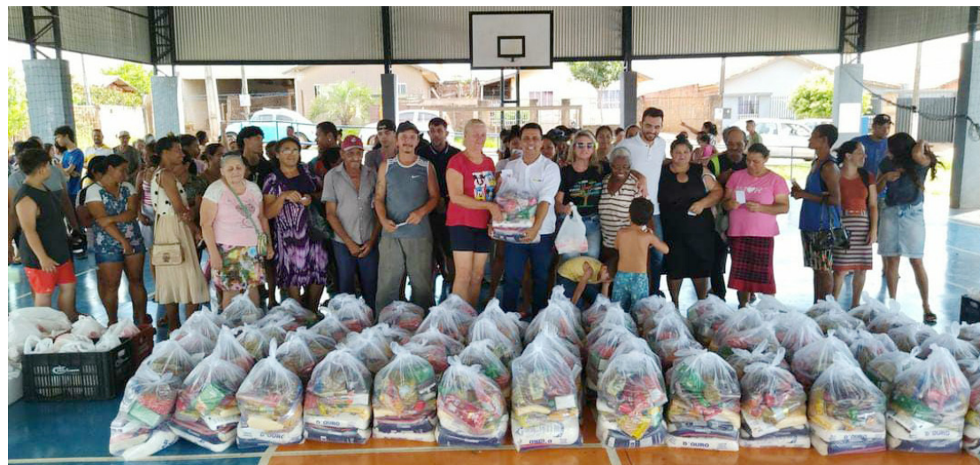
As cestas estão sendo entregues pela prefeitura do município: momento especial de natal

As entregas são de responsabilidade da Secretaria de Assistência Social e seguem nesta terça e quarta-feira nos