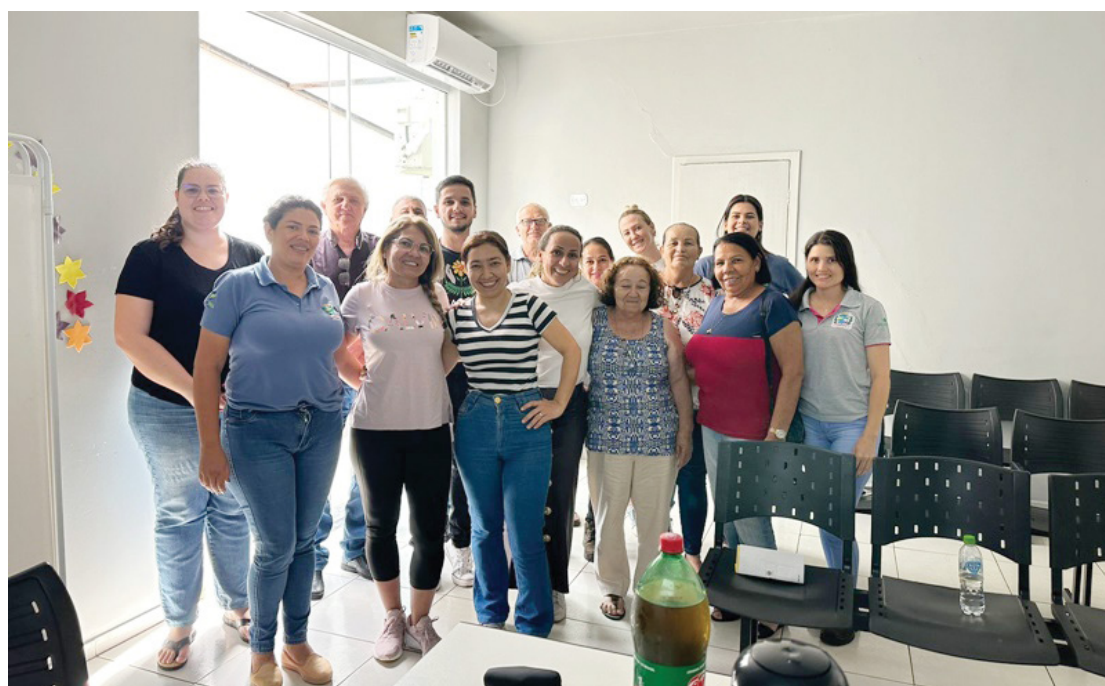
O conselho de saúde de Janiópolis é um dos mais atuantes de toda a região