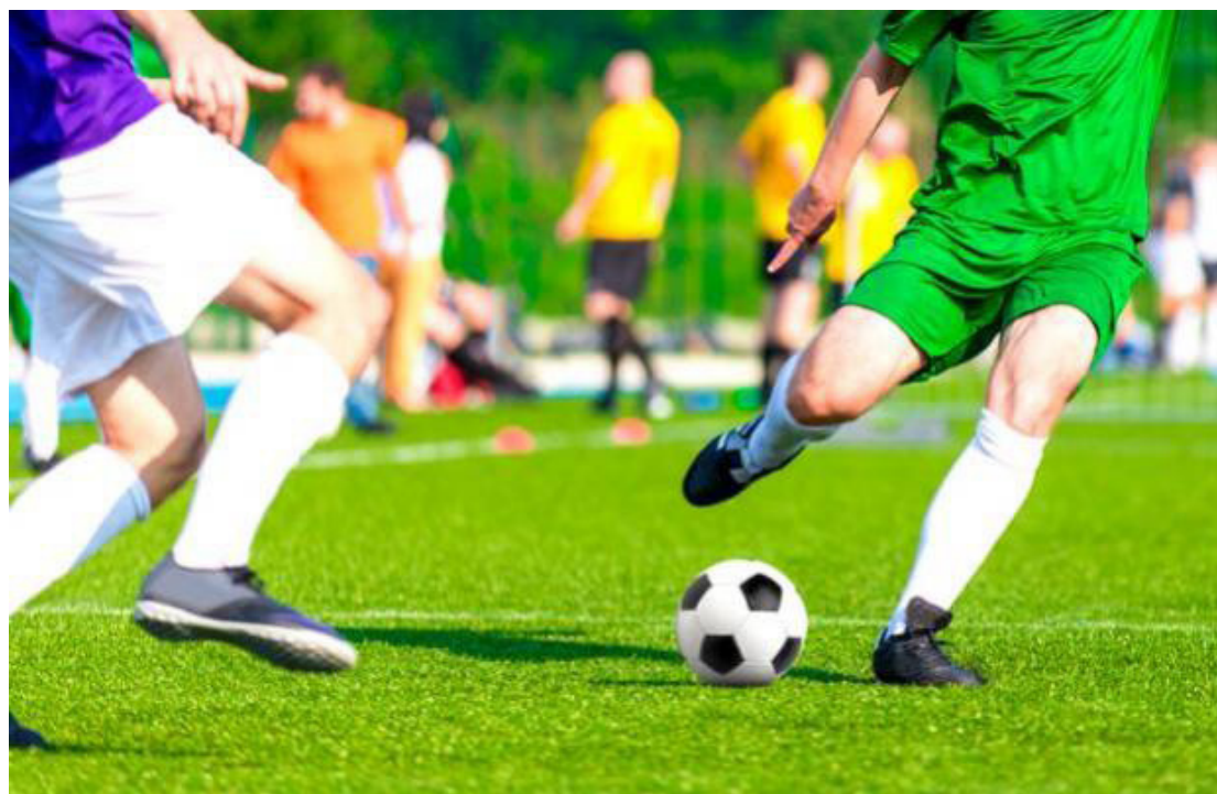
A competição começa no dia 22 de janeiro: mais de mil participantes

De acordo com a organização, a competição, que atinge a sua quinta edição, será disputada em oito categorias no naipe masculino. A Federação Paraguaia de Es-