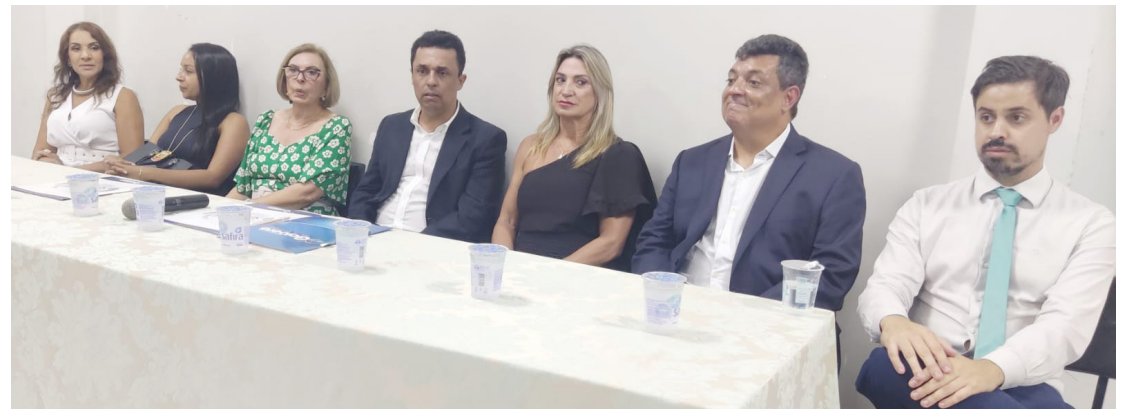
Diversas autoridades estiveram presentes na posse dos conselheiros Os novos conselheiros terão mandato de quatro anos: posse nesta terça-feira

AUTORIDADES: - Entre as autoridades presentes no