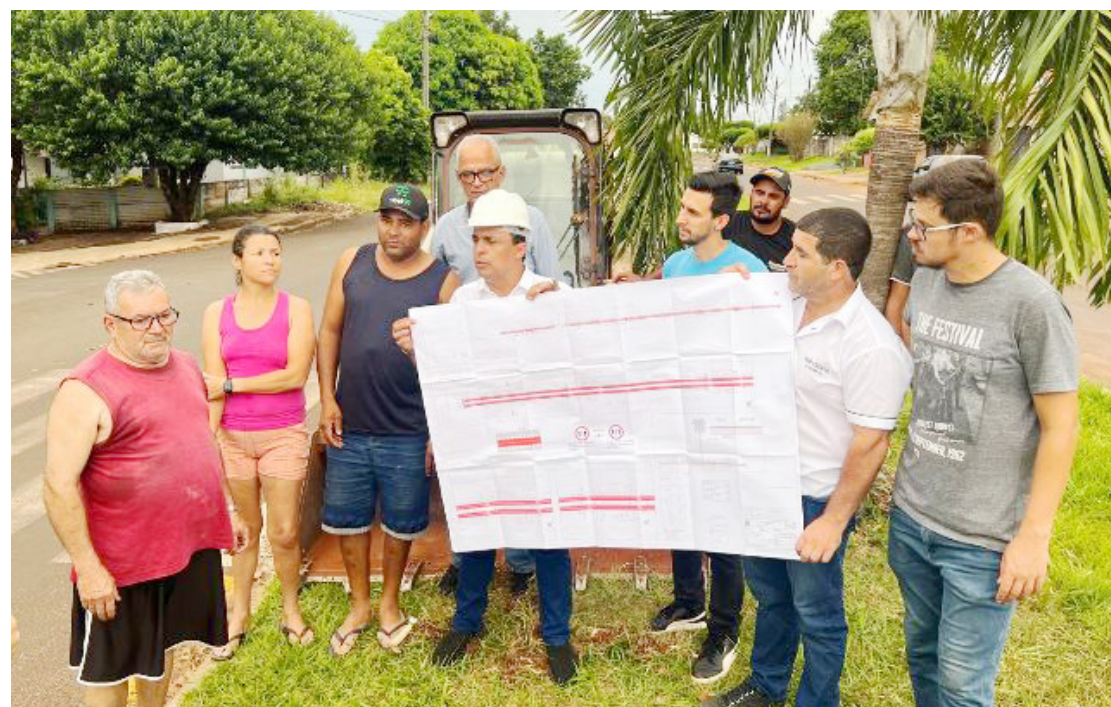
As obras foram iniciadas pela Vila Guaíra: mais qualidade de vida para a população

O investimento na obra é de R$ 1 milhão e 406 mil, sendo R$ 1 milhão e 290 mil liberados pelo Governo