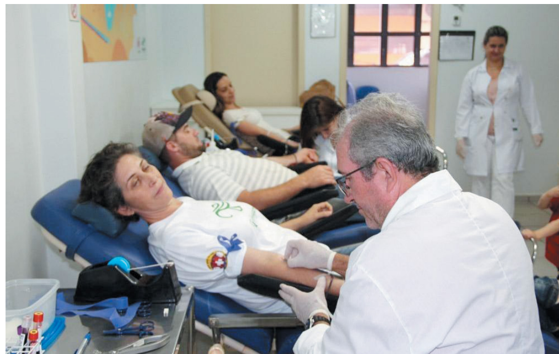
A ida para Campo Mourão está marcada para o próximo dia 18