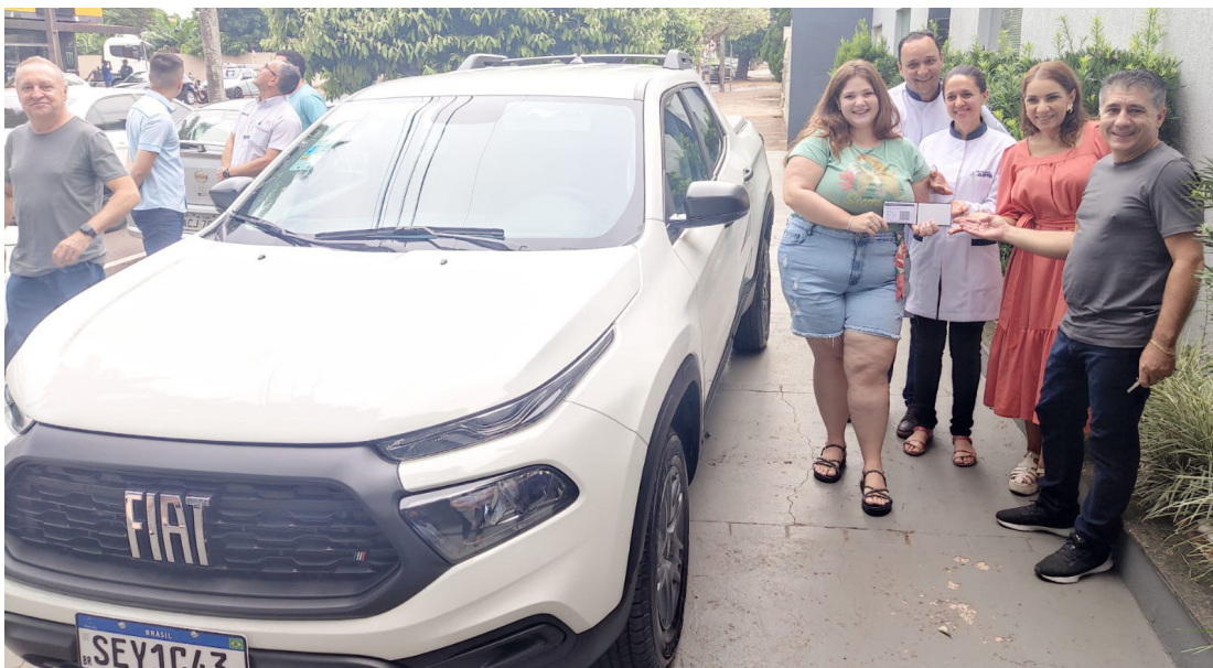
A entrega do carro aconteceu na última terça-feira

A campanha da ACIG foi das mais positivas e movimen-