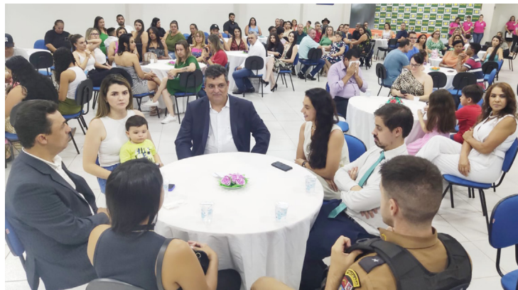
A solenidade foi prestigiada por muita gente da cidade, entre as quais, amigos e familiares dos conselheiros

Entre as atribuições dos conselheiros estão o atendimento e proteção das crianças e adolescentes, prestar aconselhamento aos pais e responsáveis e executar decisões para a prevenção de problemas e violação de direitos.