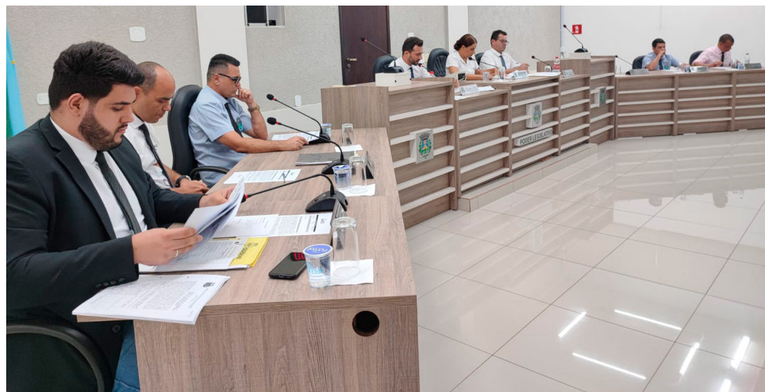
Os vereadores se reunirão na noite desta quinta-feira: várias proposições