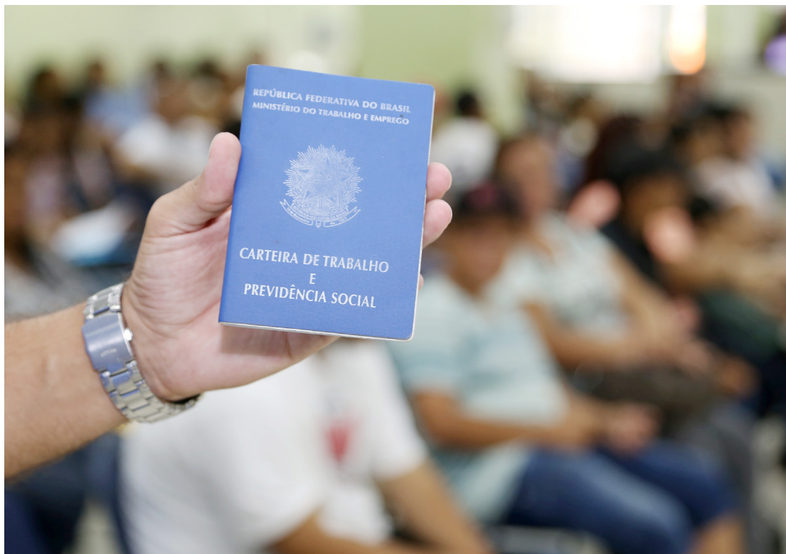
As contratações são para a recolha de aves em Goioerê

Os interessados deverão comparecer na Agência do Trabalhador, no dia e horário estipulados, levando todos os documentos pessoais, especialmente a Carteira de Trabalho.