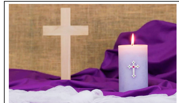
No total ao quarenta dias para intensificar orações, jejuis e penitências