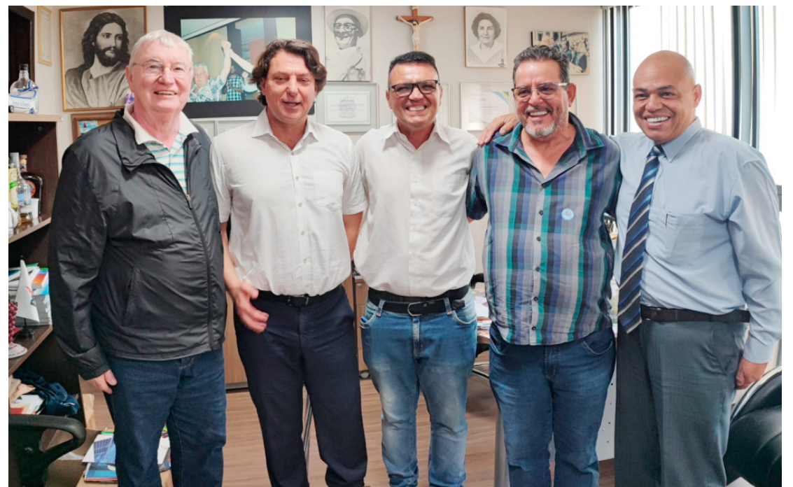
O vereador esteve na capital do estado na semana passada: reivindicações em favor de Goioerê

Além disso, 'Paraíba' participou de uma significativa reunião na Secretaria de Estado de Esporte, onde pleiteou por materiais esportivos destinados a entidades que trabalham com crianças e adolescentes em Goioerê. Essa iniciativa visa