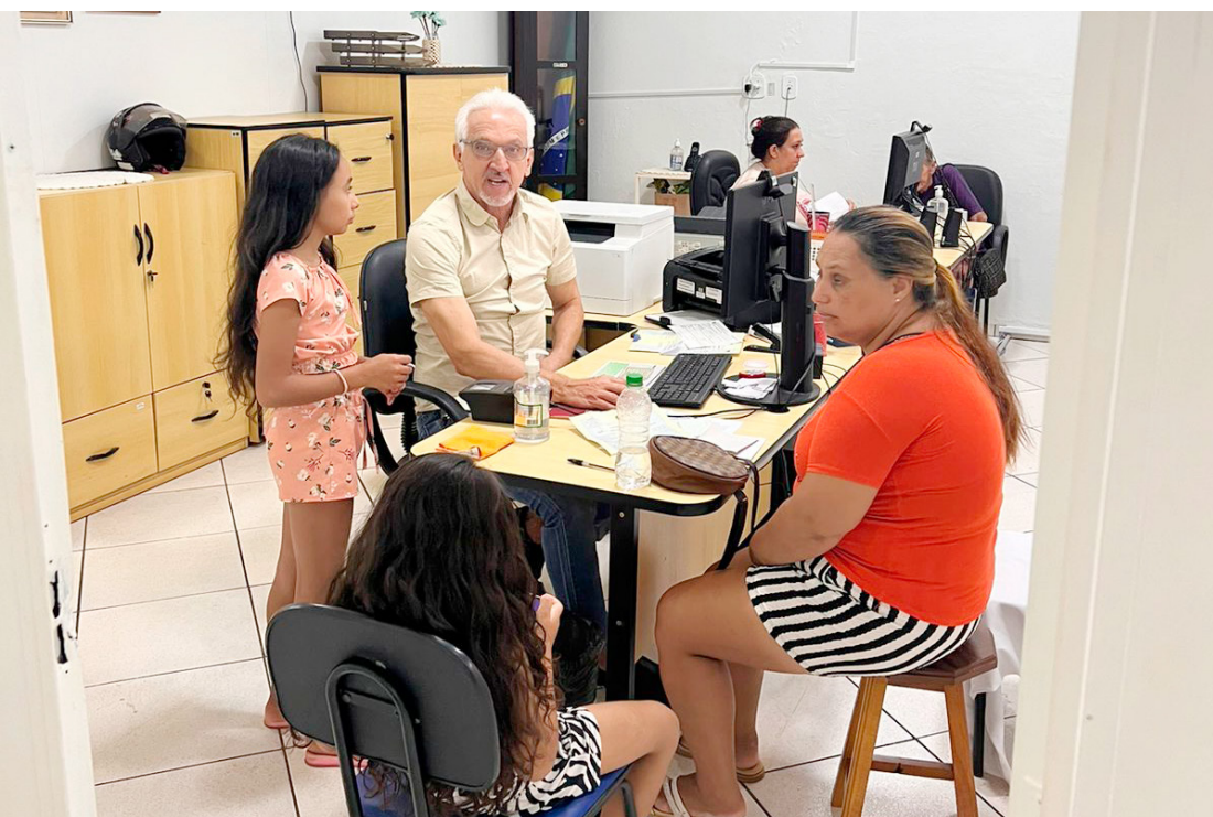
As ações foram realizadas nos últimos dois meses de 2024

AGÊNCIA DO TRABALHADOR : - AAgência do Trabalhador, que conec-