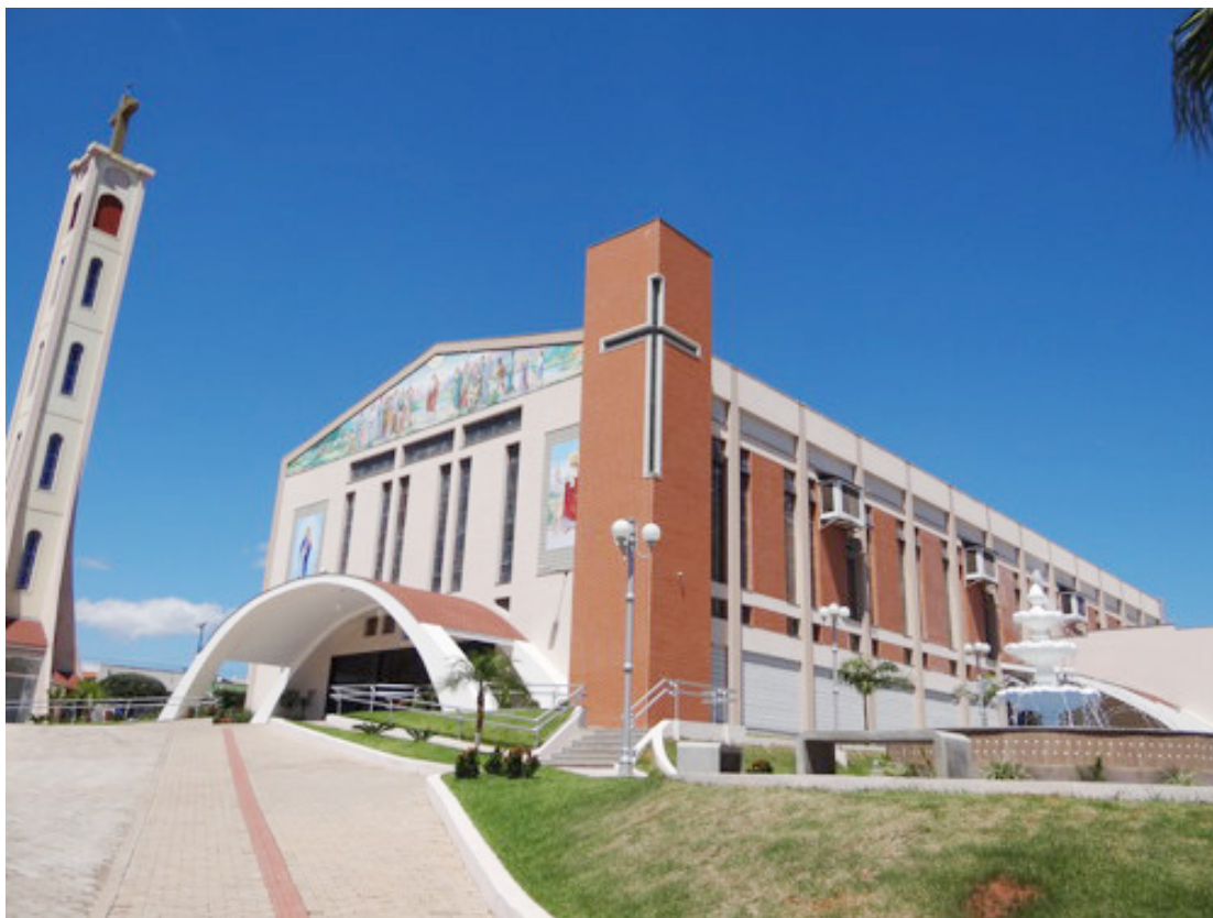
Na Igreja Matriz a programação começa às 6 horas com a Via Sacra

A programação segue às 18 horas, com o Terço das Mulheres ao pé da Cruz e às 19:30 horas, celebração das 7 Dores de Maria e procissão com Cristo Morto.