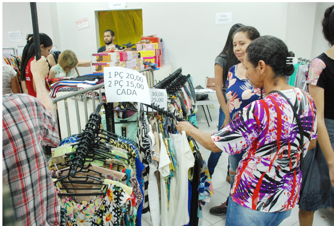
O feirão é tradicional e todos os anos é realizado pela ACIG