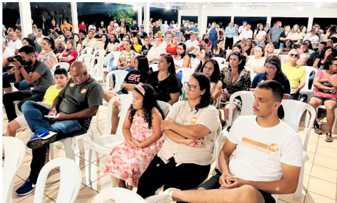
Muita gente se fez presente no evento organizado pelo PSD