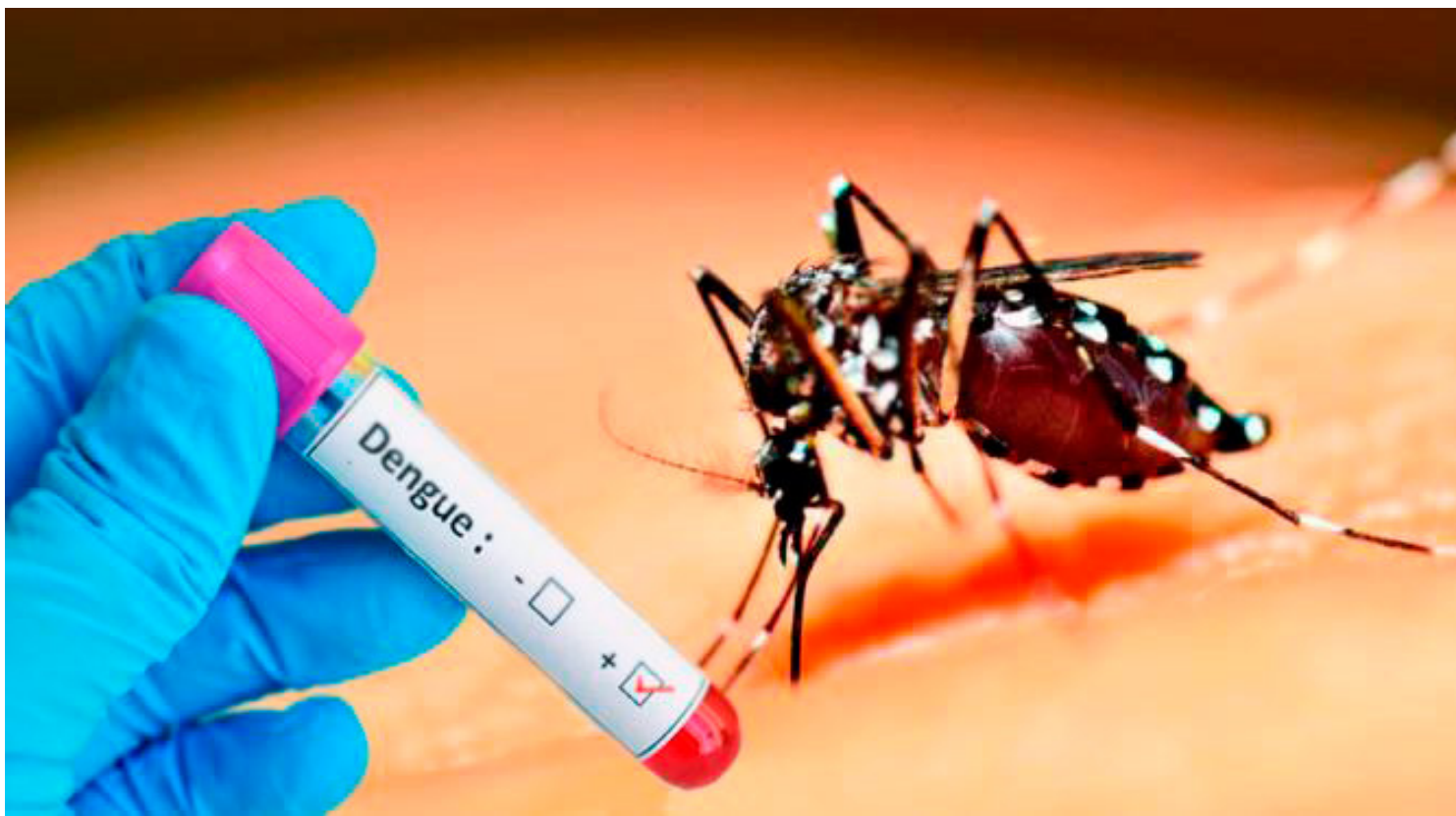
Na região Comcam, que congrega 25 municípios, os casos da doença se aproximam de 10 mil

Na região Comcam, que congrega 25 municípios, os casos da doença se aproximam de 10 mil. Campo Mourão segue na liderança, com 1.577 confirmações da doença, seguido por Peabiru, com 1.122, e por Roncador, que está colado em Peabiru, com 1.119.