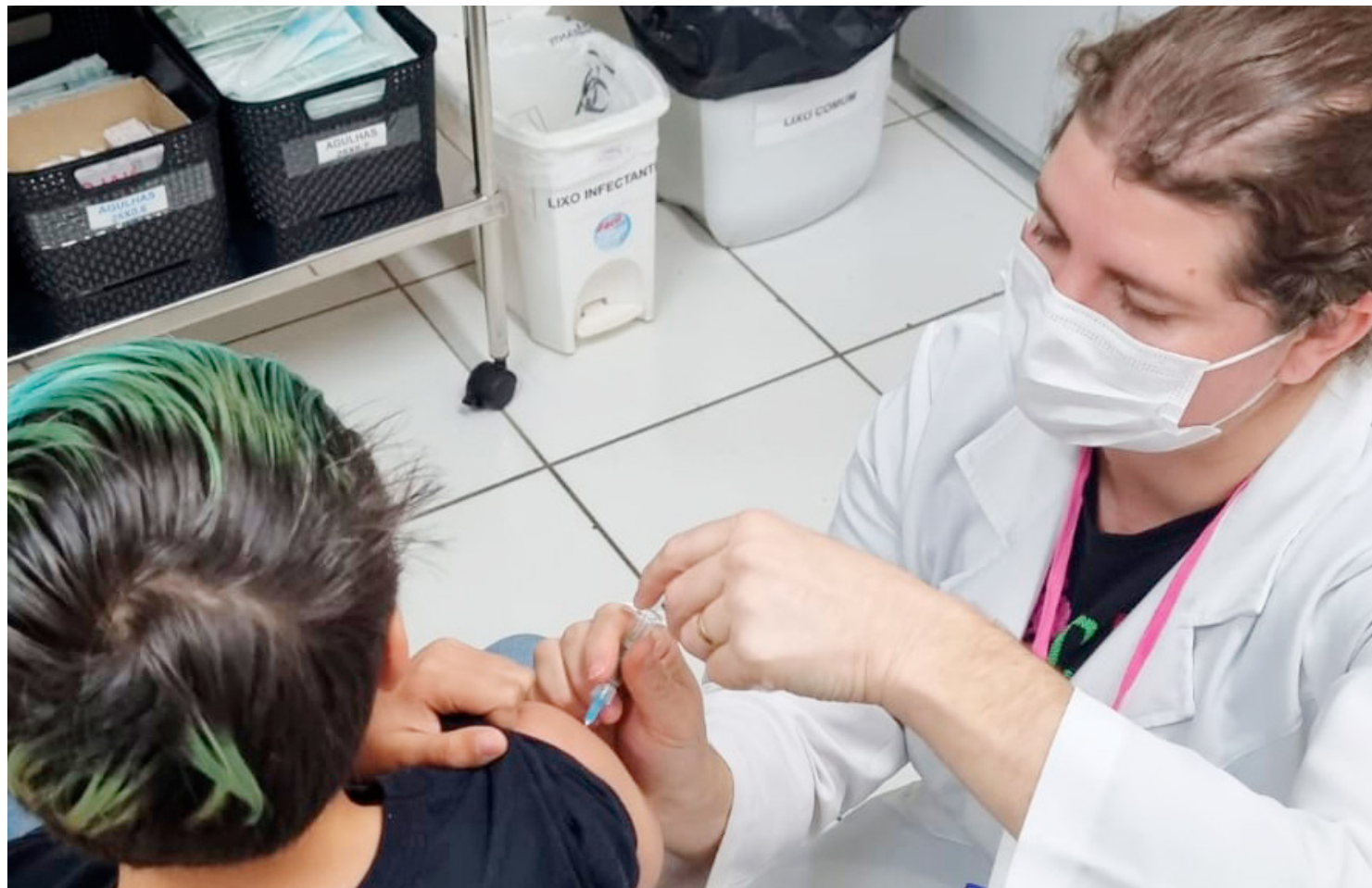
A ação segue até o dia 19 de abril em todo o Paraná. A população-alvo envolve crianças e adolescentes até 15 anos de idade

Serão disponibilizados todos os imunizantes do Calendário Nacional de Vacinação do Ministério da Saúde, com ênfase na vacinação infantil oral contra a poliomielite, vacina inativada contra a poliomielite, sarampo, pentavalente, febre amarela e Covid-19 (conforme público preconizado). Já para a população juvenil,