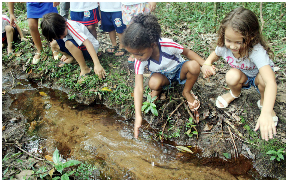
As crianças participaram das atividades e puderam apreciar a natureza

O trabalho vem sendo desenvolvido através de