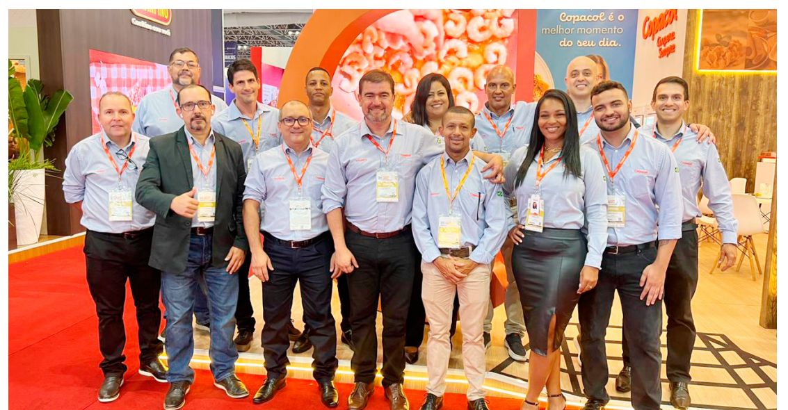
A Cooperativa lança oito novos produtos tanto para elaboração de pratos principais, como lanches e petiscos