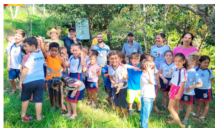
Alunos do CMEI Padre Alberto Pierobon participaram das atividades desta semana

parceria da Prefeitura Municipal, através da Secretaria de Agricultura e Meio Ambiente com o IDR Paraná.