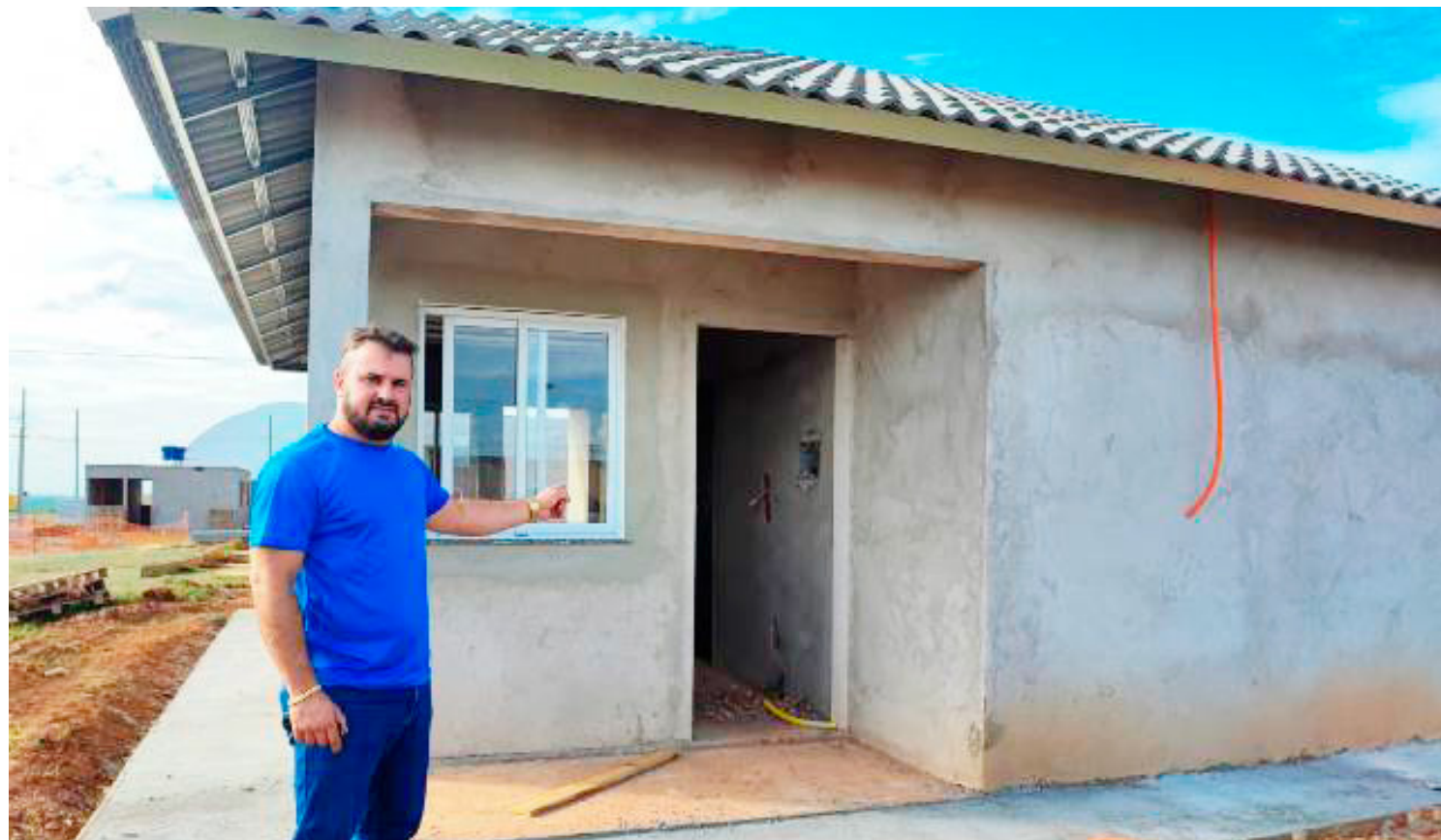
As casas estão em fase de conclusão: 37 novas moradias para a população

de entrega para junho do próximo ano, Cássio Zanuto sugere que, mantido o ritmo