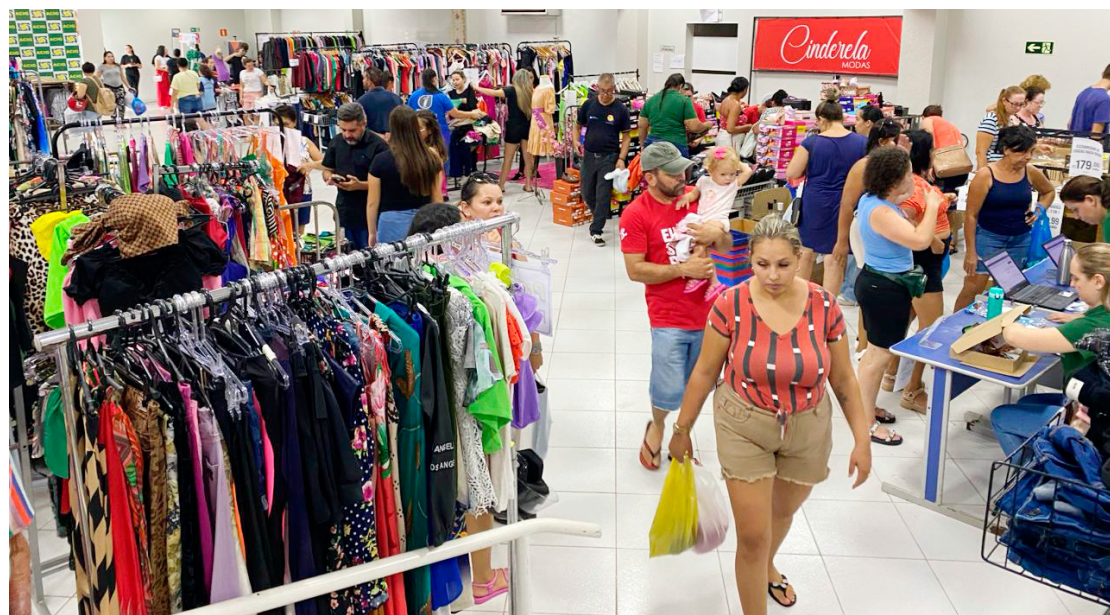
A encenação aconteceu no Parque de Exposições e foi muito prestigiada

Com a participação de diversas empresas, o evento oferece uma seleção abrangente de produtos, desde vestuário e acessórios até artigos para o lar.