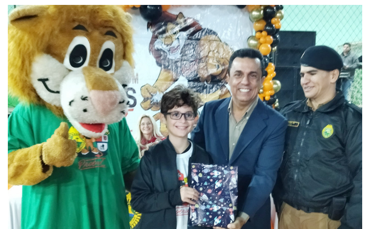
O ginásio de esportes ficou lotado pela participação de pais, professores, amigos e familiares dos formandos