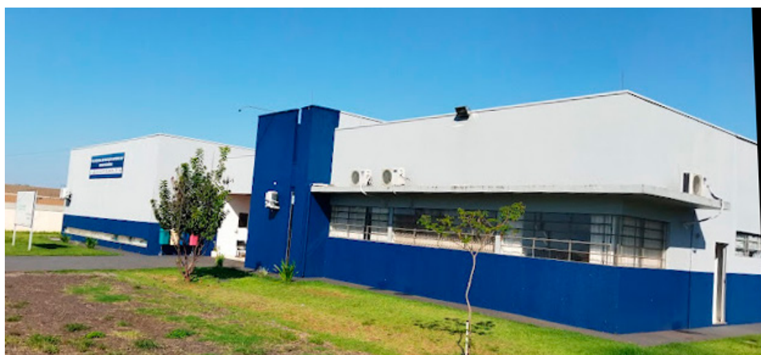
Os cursos serão oferecidos pela UEM na modalidade EAD

De acordo com a coordenação do Polo da UAB, as inscrições para o vestibular já estão abertas e poderão ser feitas até o próximo dia 5 de junho. As provas