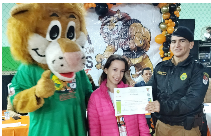
Alunos também foram premiados pelas redações falando do programa