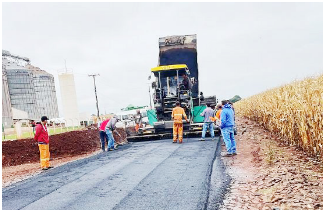
As obras estão bem avançadas: asfalto em estradas rurais

A pavimentação está sendo feita nas estradas que ligam a sede do município até as cooperativas Integrada e Coamo, além de mil metros