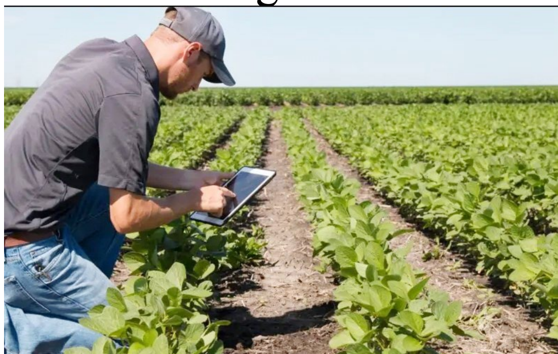
A data será comemorada com um café da manhã: reconhecimento e valorização

“Todos os dias quando almoçamos, jantamos ou tomamos algum lanche, devíamos refletir quantos produtos vem da agricultura, pois quase tudo o que ingerimos depende do trabalho do homem do campo”,