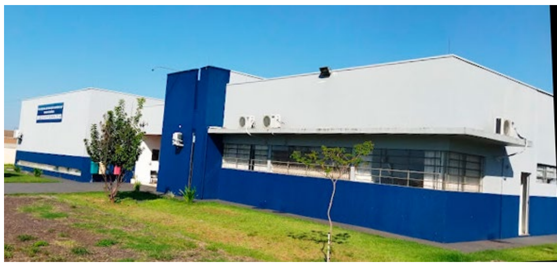
Os interessados em participar do curso devem fazer a inscrição pela Internet: aulas no Polo UAB de Goioerê

O curso é totalmente gratuito e, durante as aulas, os alunos têm tutores à disposição. Apenas a inscrição para o vestibular tem uma taxa a ser paga no valor de R$ 80,00, sendo que candidatos inscritos no Cadastro Único para Programas Sociais do Governo