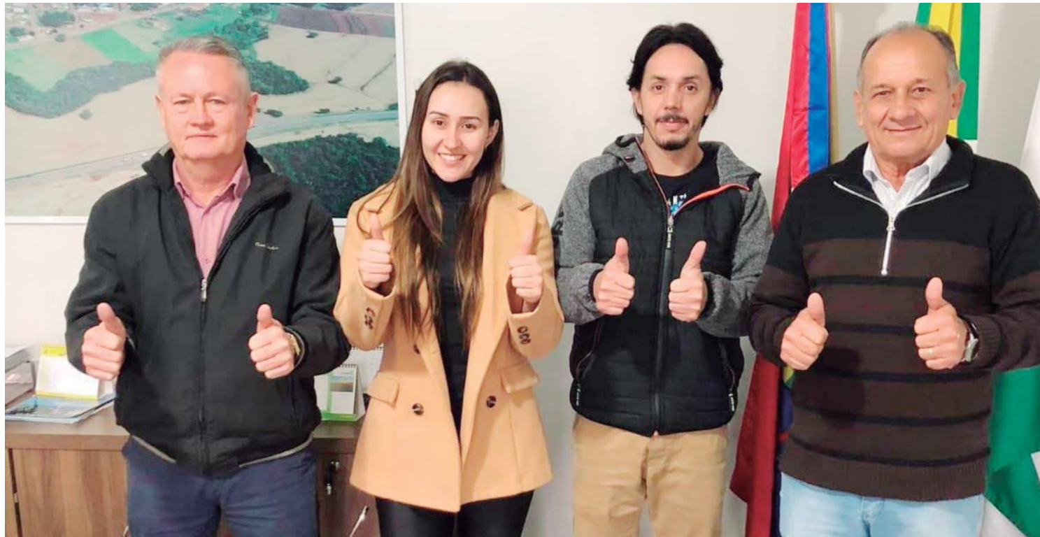
A assinatura do convênio foi comemorada pelo prefeito e equipe de assessores

No total serão cerca de 4 quilômetros de calçamento, melhorando em muito a qualidade de vida