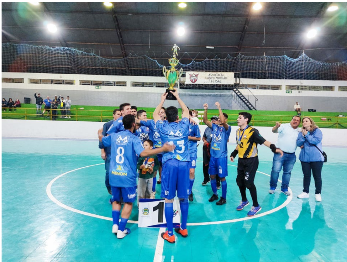
A competição começa sua fase final nesta sexta-feira: expectativa

“Temos um novo recorde de inscritos, a gente fica muito feliz pela confiança que os professores, que as escolas têm no Governo do Paraná, mas também a nossa responsabilidade aumenta. Vamos fazer uma festa bonita para os nossos atletas em Campo Mourão, já está tudo preparado – locais de