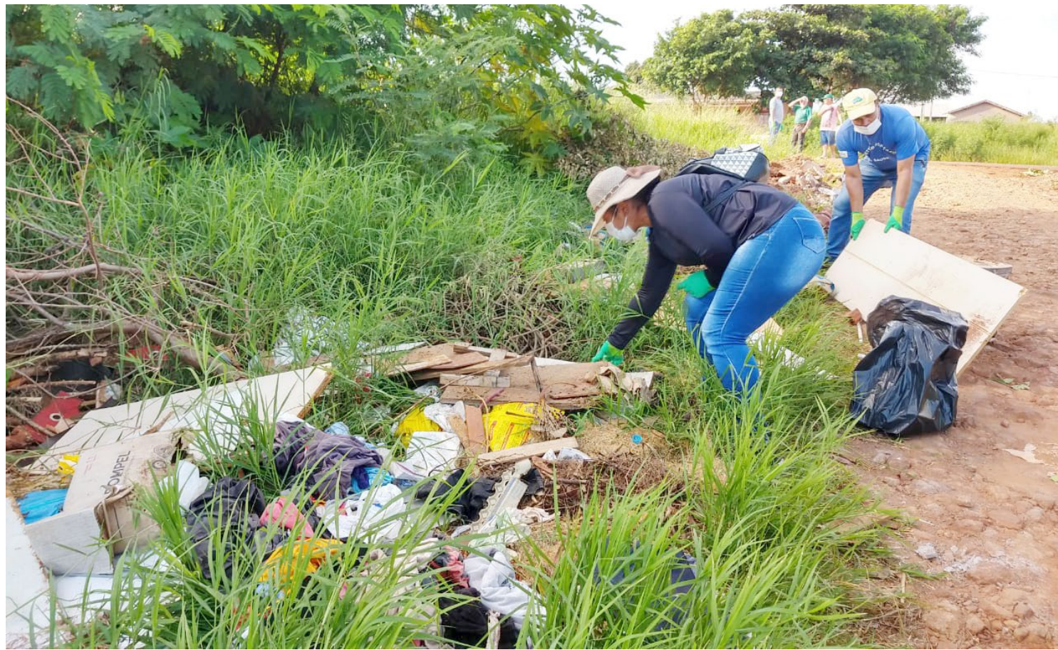
Entre as recomendações para se evitar a doença está a limpeza de quintais e terrenos baldios

Entre os principais sintomas da dengue estão febre com temperaturas acima dos