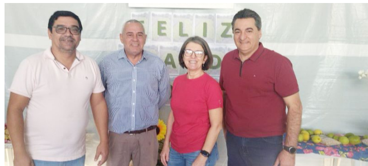
O evento aconteceu sábado e reuniu agricultores, técnicos e lideranças do setor

a Aprogoio mostrou sua força no encontro que teve a participação não só de agricultores, mas também de técnicos e instituições financeiras que dão apoio ao setor rural no município.