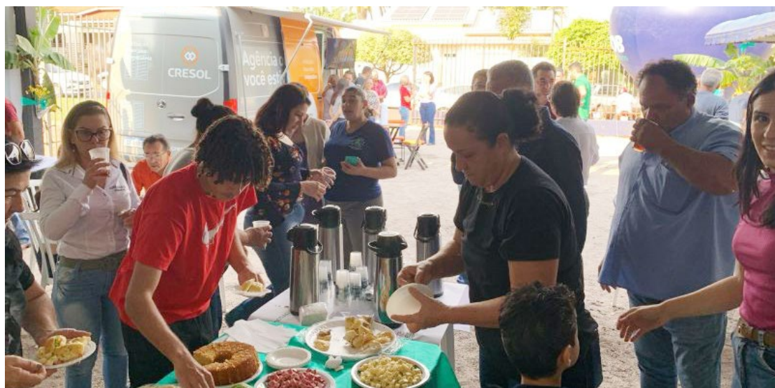
Um café da manhã foi servido para todos os presentes no evento