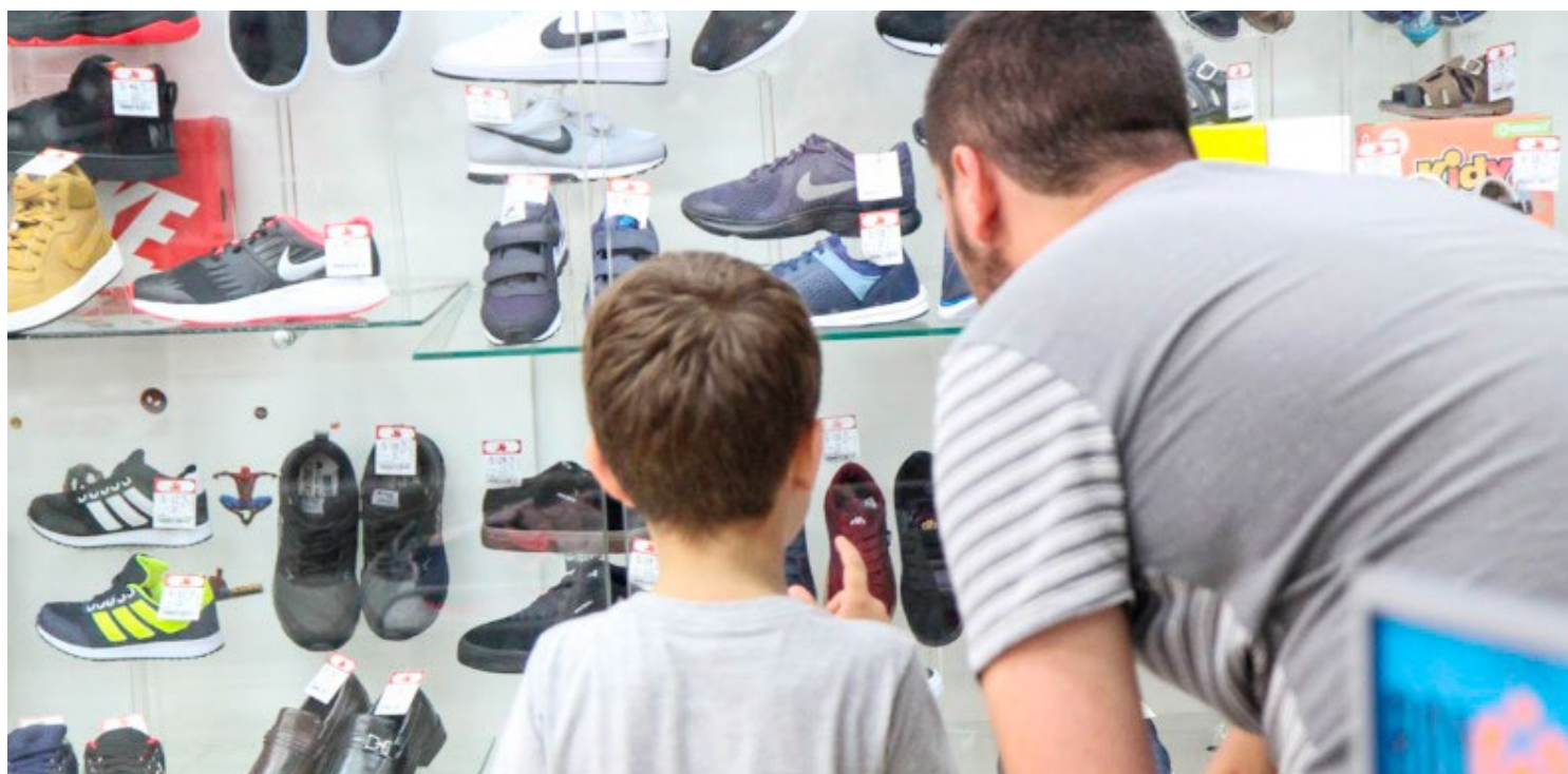
A promoção do Dia dos Pais está gerando grande expectativa nos consumidores