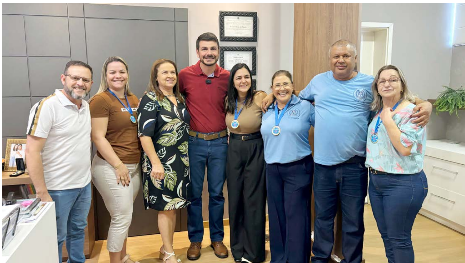
Administração reafirma seu compromisso com a educação e destaca a importância do trabalho colaborativo para o avanço contínuo das escolas

administração reafirma seu compromisso com a educação e destaca a importância do trabalho colaborativo para o avanço contínuo das escolas