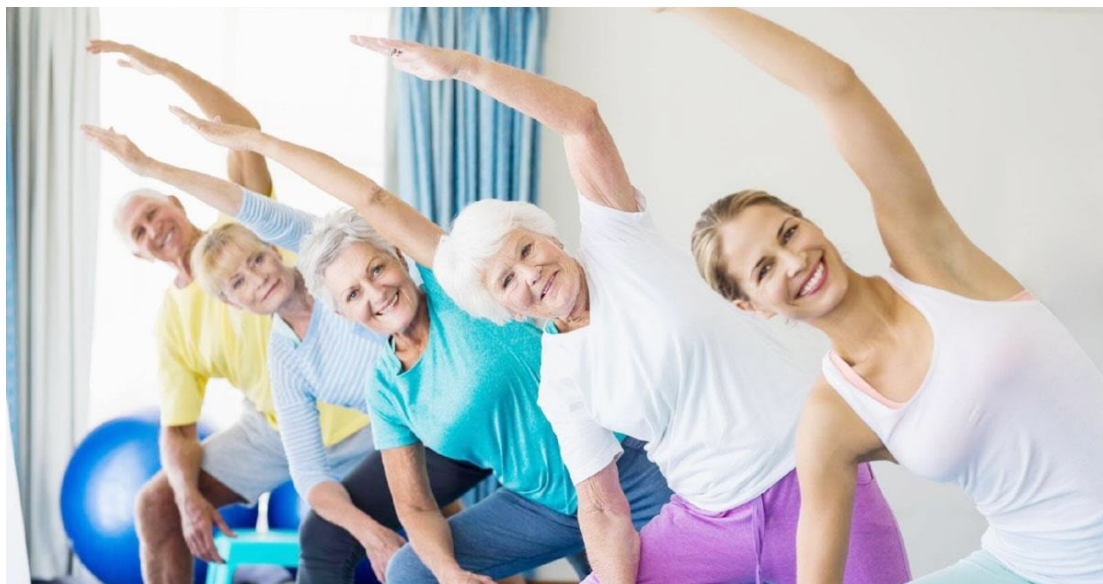
As inscrições já estão abertas, com as aulas começando no próximo dia 12 de agosto