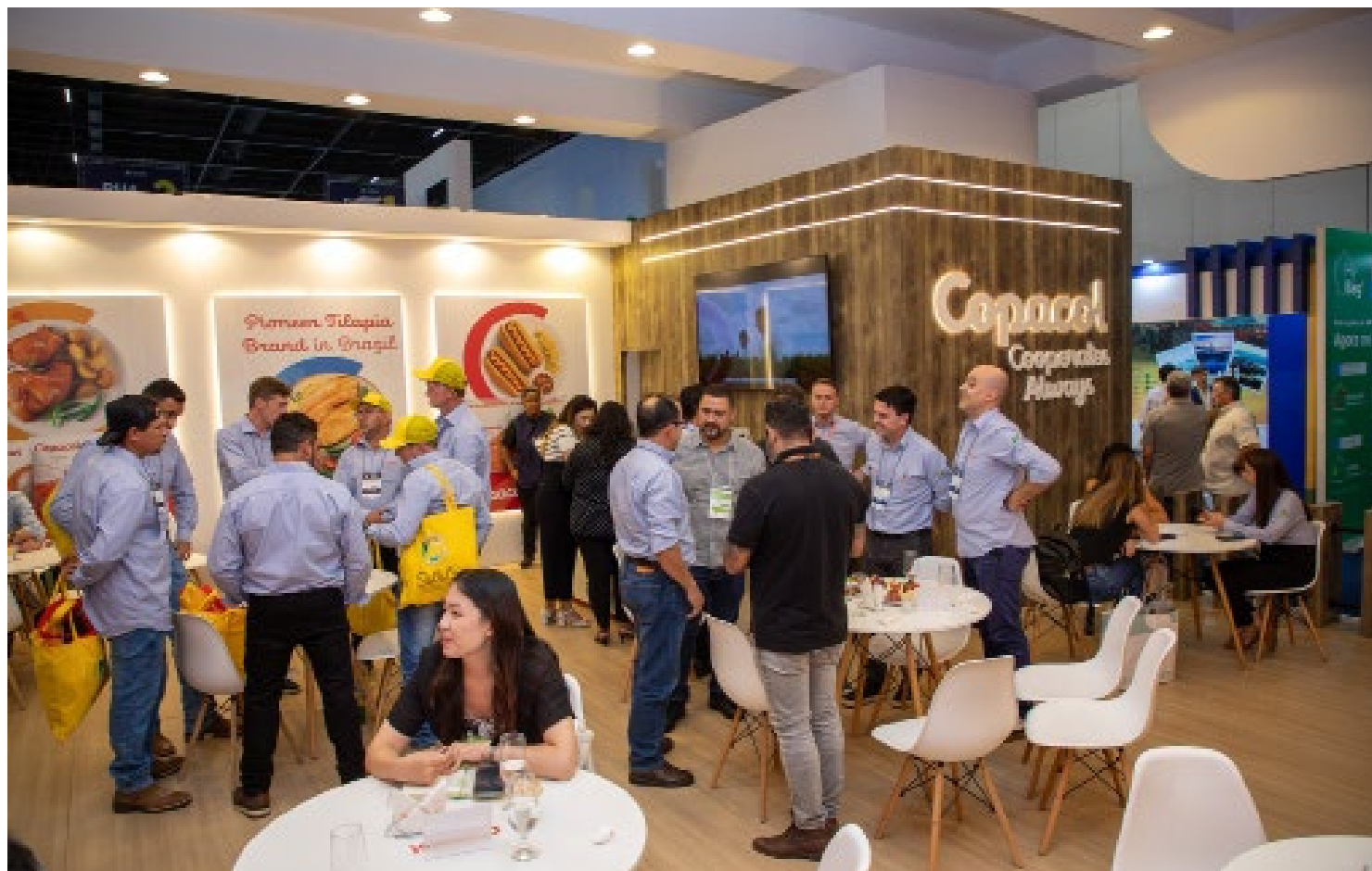
Considerado o maior evento das cadeias produtivas no Brasil, com foco em avicultura, suinocultura, piscicultura e ovinocultura, iniciado terça e que vai até quinta-feira, em Anhembi

Com mais de cem empresas do setor agroindustrial presentes em São Paulo, o setor comemora a reabertura do comércio na China – grande comprador de aves brasileiras – e o estreitamento da relação com o México, outro importante polo consumidor. “O Siavs é uma oportunidade para mantermos o relacionamento com nossos clientes, presentes em 70 países. Marcar presença e demonstrar nosso portfólio de produtos garante participação no mercado. Feiras como esta geram maior comercialização dos produtos e maiores oportunidades aos cooperados, que atuam na ponta, com excelência em qualidade e rendimento. O mundo todo reconhece esse padrão elevado do nosso produto”,