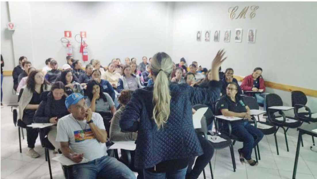
A capacitação aconteceu na última sexta-feira: ACS e enfermeiros

Durante a capacitação, as palestrantes destacaram pontos sobre o perfil do paciente, além de técnicas e ferramentas visando a qualificação do atendimento realizado pelos profissionais de enfermagem e ACS’s que atuam na rede municipal de saúde.