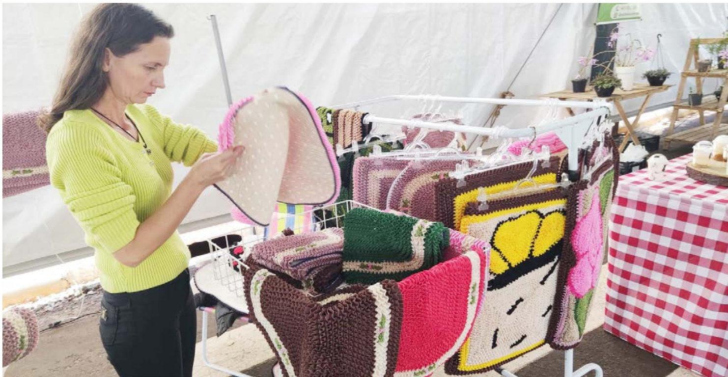
O último Feirão de 2023, foi um grande sucesso: expectativa para a nova edição

O Mega Feirão vai oferecer uma vasta gama de produtos e serviços, incluindo moda, cooperativas de crédito, tecnologia, alimentos e muito mais. “É a oportunidade perfeita para aproveitar