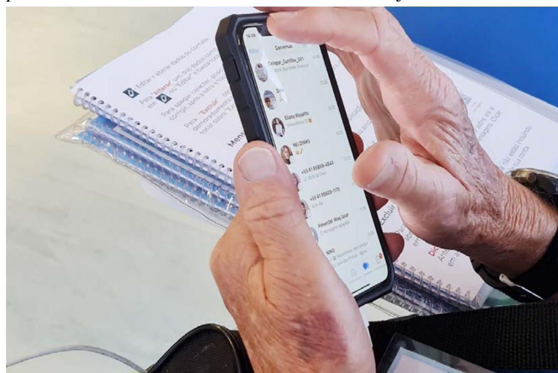
O curso será iniciado no dia 3 de setembro: oportunidade para aprender a mexer no celular