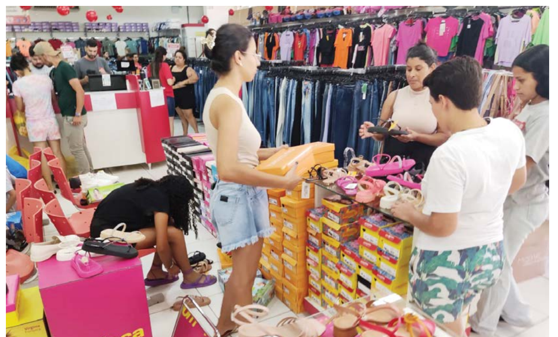
O sorteio da campanha será na próxima sexta-feira, dia 30

No total mais de 100 empresas participam da campanha, que segundo