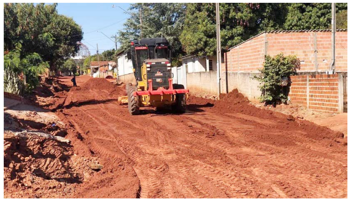
O programa contempla 100% das ruas de Bredópolis: qualidade de vida

No total R$4,3 milhões foram liberados para que a Prefeitura pudesse asfaltar todas as ruas da sede e distrito, melhorando de forma considerável a qualidade de vida dos moradores destas localidades. “A gente fica feliz em ver obras como estas, pois elas trazem mais