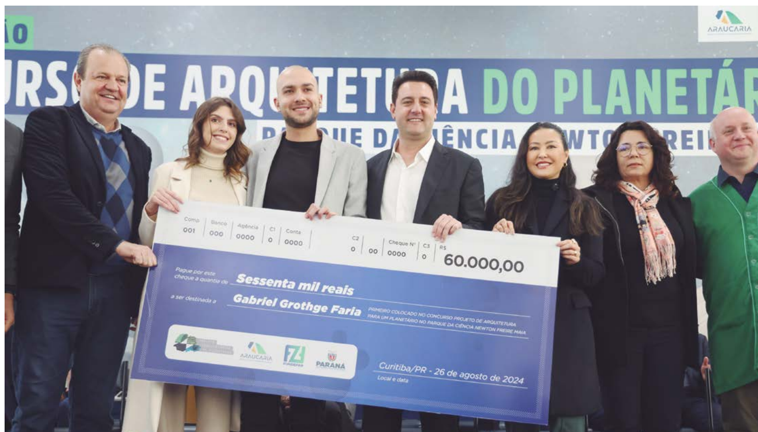
Governador Carlos Massa Ratinho Junior assinou nesta segunda-feira (26) contrato para elaboração dos projetos legais e executivos e do orçamento do novo planetário do Parque da Ciência Newton Freire Maia, em Pinhais.

“É um projeto que passa pelo nosso plano de ter a melhor educação do Brasil, mas não se limita a isso. Além de ser usado para que nossos es-