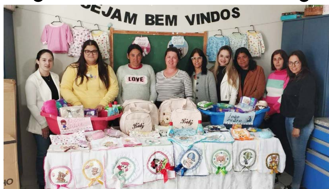
Os kits foram entregues na última sexta-feira: apoio às gestantes

A ação da prefeitura proporciona um serviço de suma importância para as gestantes do município, gerando uma