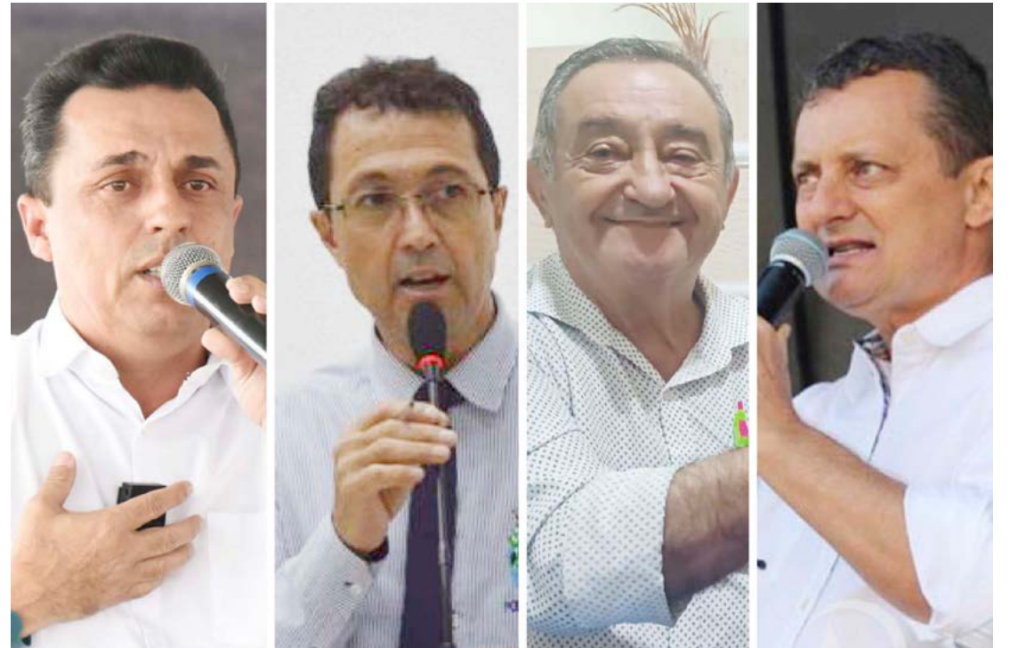
A partir desta sexta-feira, os candidatos começam a falar nos programas eleitorais