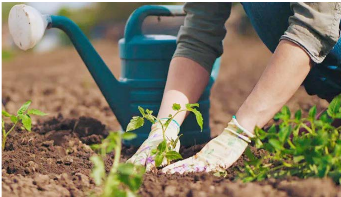
O curso será realizado no mês de setembro: interessados já podem se inscrever

Os organizadores citam também, que o curso busca ainda sensibilizar os participantes para os cuidados com a natureza e preservação de recursos naturais, trabalhando a educação ambiental através da jardinagem e ainda criar possibilidade de geração de renda para as pessoas interessadas neste tipo de prestação de serviços. Durante o curso serão