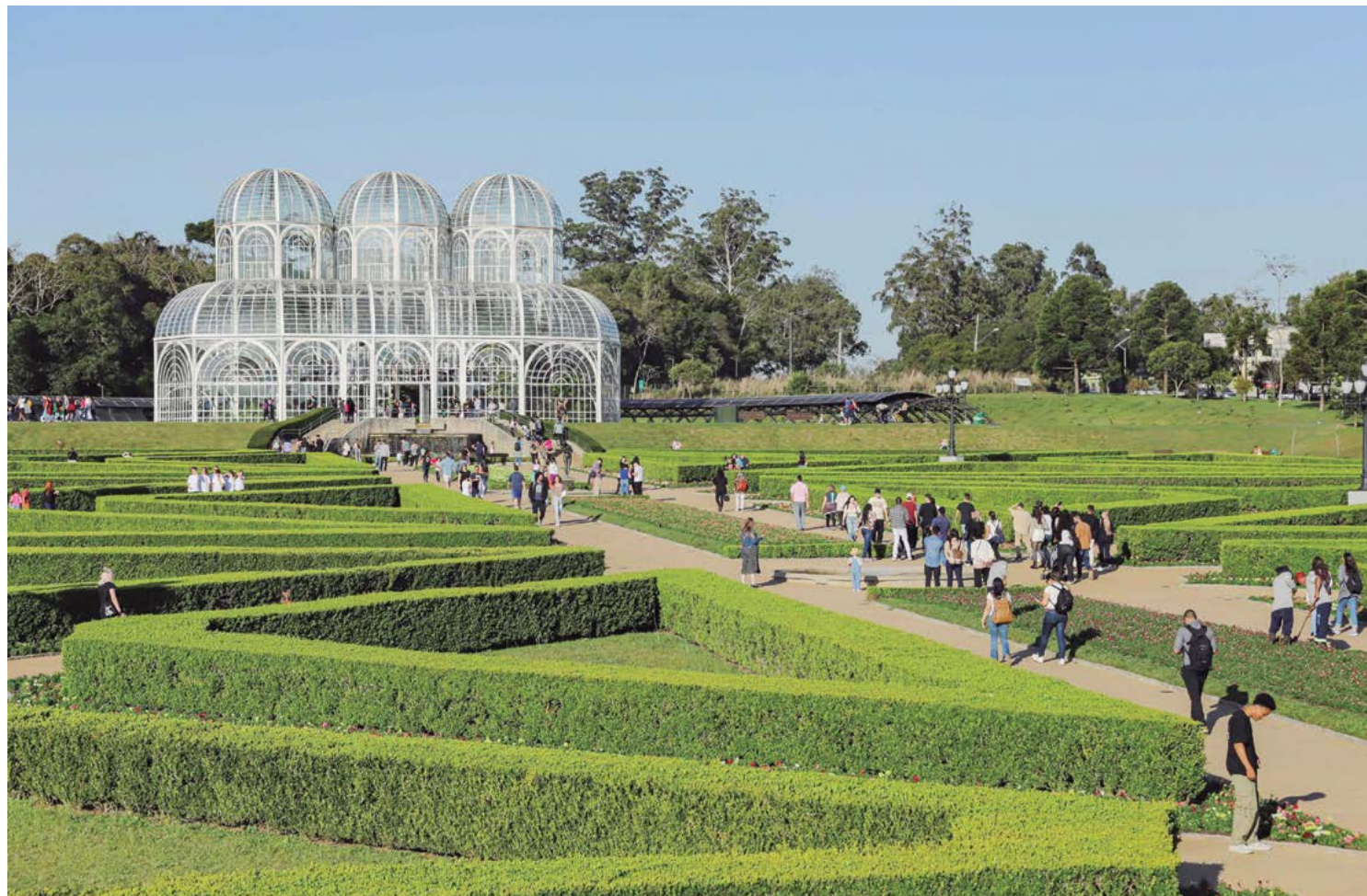
Evento começa no próximo sábado (24) e tem duração de três dias. No Estado, mais de dez empresas participam com ofertas exclusivas. Objetivo é promover um maior movimento de turistas especialmente durante a baixa temporada

No Paraná, a venda presencial acontece no Mercado Municipal de Curitiba, das 9h às 18h. “É uma grande oportunidade para quem busca viajar ou conhecer novos lugares gastando menos. Assim como os paranaenses podem adquirir viagens mais baratas, nós teremos a oportunidade de receber pessoas de todo o país”, destacou o