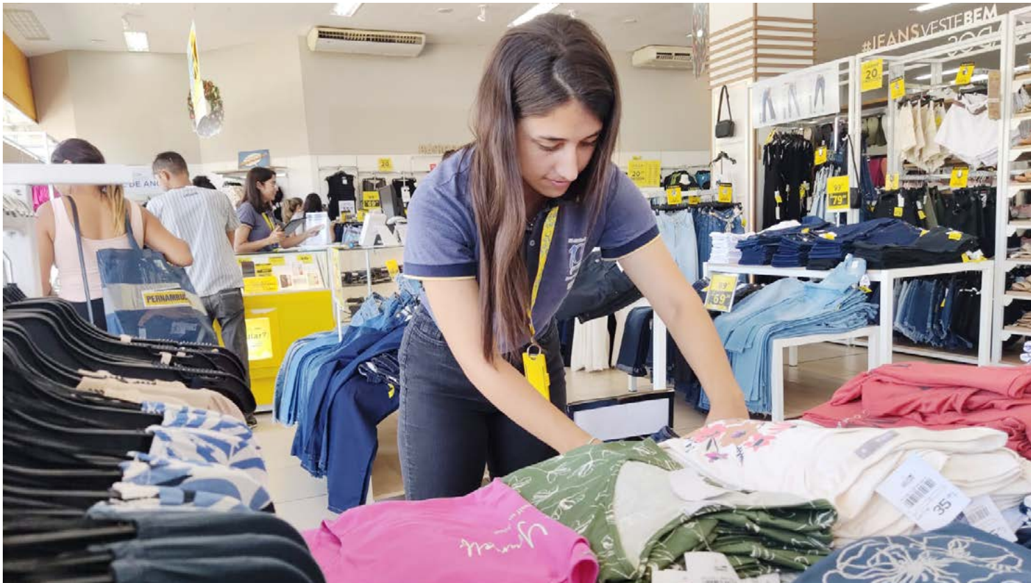
O reajuste dos salários foi aprovado em Convenção Coletiva na semana passada

Com o aumento, o salário dos empregados comissionados passa de R$ 1.952,80 para R$ 2.045,00. O reajuste é válido de forma retroativa, a partir de 1º de julho e com validade de 12 meses. Já o salário base do comerciante passa de R$ 1.888,45 para R$ 1.980,00. Cargos