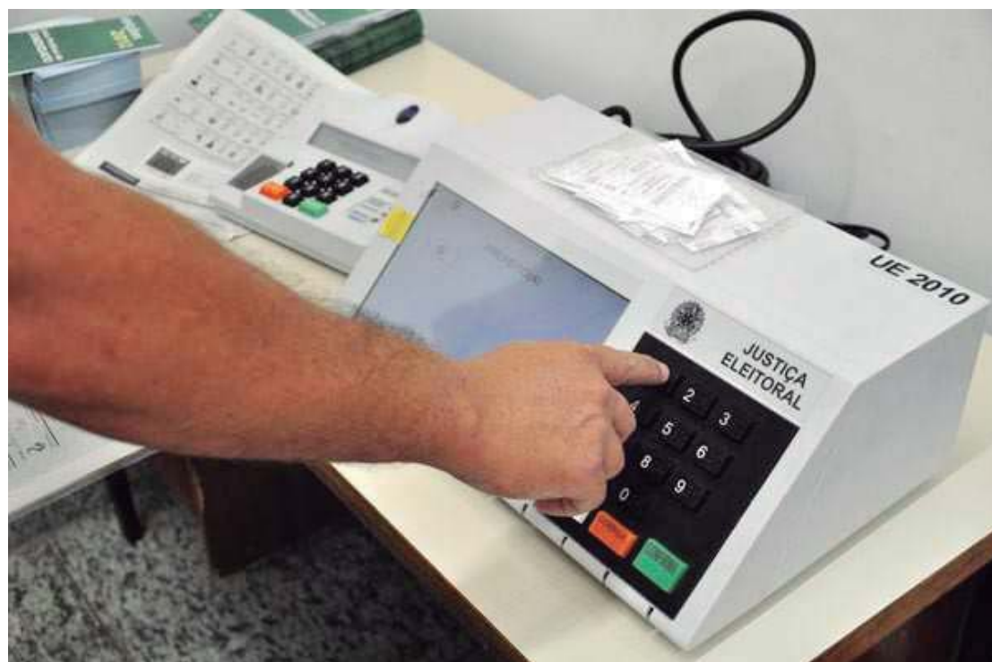
A reunião será no Cartório Eleitoral, às 9 horas desta quinta-feira