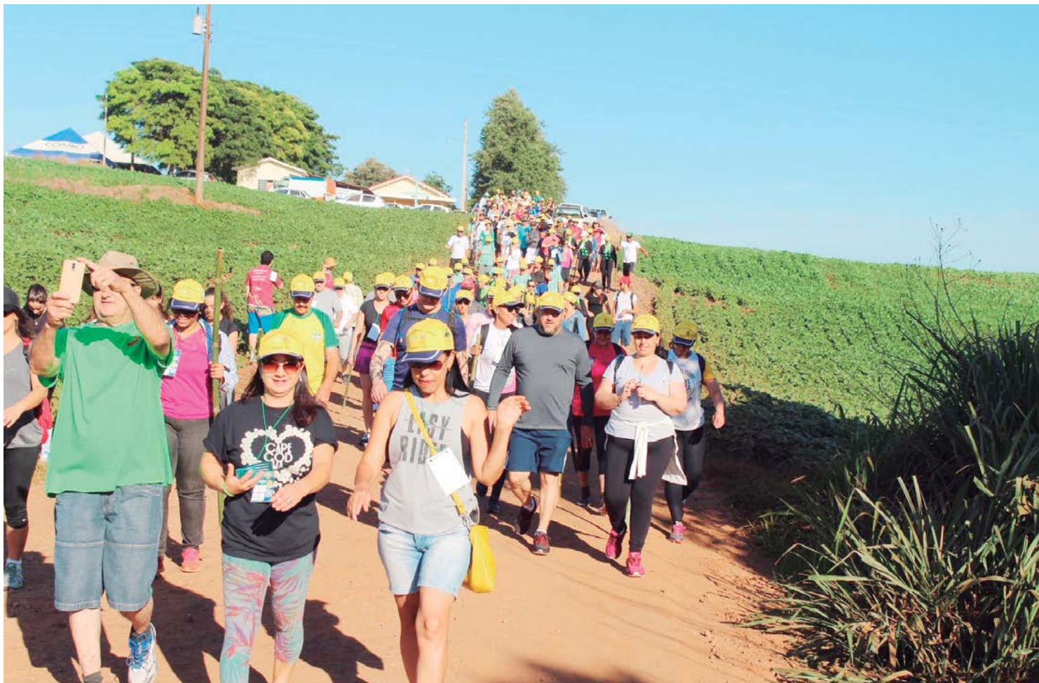
O percurso será de 10 quilômetros, passando por corredeiras, cachoeiras, igrejas rurais, um cemitério abandonado, represas e propriedades rurais

zanoski se diz otimista e esperando por um grande evento no município. "Sem dúvida, estamos otimistas