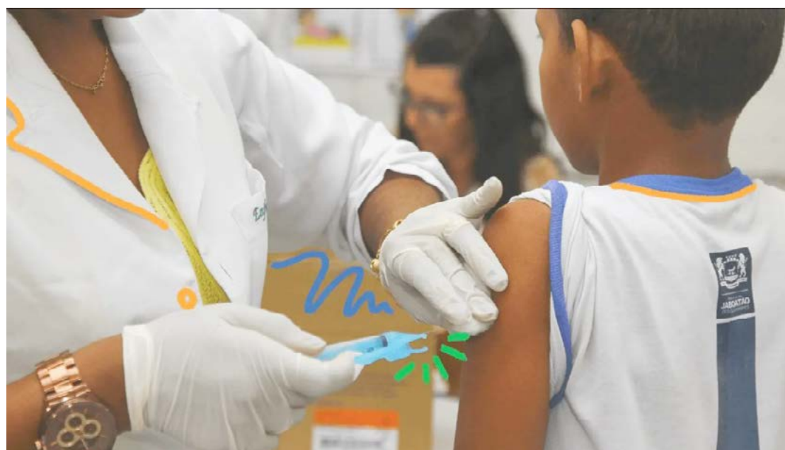
A vacinação começou nesta semana: imunização de crianças de 10 a 14 anos

Para receber a imunização, as crianças devem comparecer às Unidades de Saúde acompanhadas pelos pais ou por alguém responsável maior de idade. A vacina está disponível em todas as Unidades de Saúde de Goioerê.