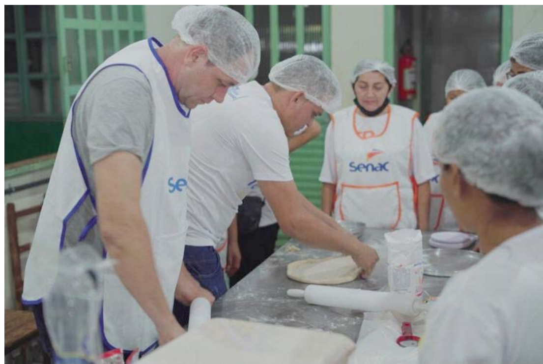
No total são 4 cursos oferecidos pela prefeitura e Senac: um deles é o de doces e salgados

Os interessados em alguns dos cursos poderão se inscrever presencialmente na Secretaria de Indústria e Comércio, que está localizada na Avenida Tiradentes, 150. As vagas são limitadas e gratuitas.