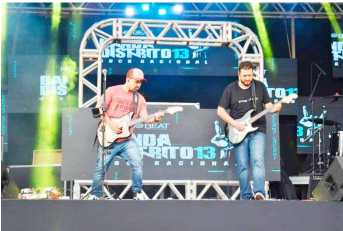
O evento está programado para acontecer no dia 8 de setembro

Os interessados em participar com suas bandas, poderão obter maiores informações pelo telefone (44) 3522-2266. As inscrições devem ser feitas no site oficial da prefeitura: https://www.goioere.pr.gov.br .