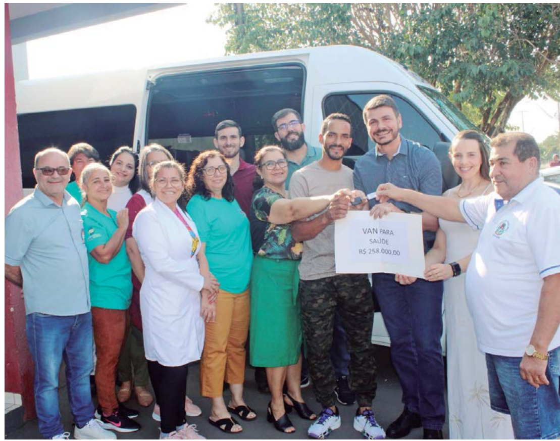
Diversas lideranças participaram do evento no Distrito de Paraná do Oeste

para Paraná do Oeste. “Somos agradecidos, pois temos recebido muito apoio”, frisou ele.