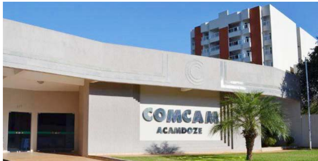
A reunião dos candidatos a prefeito será nesta quinta-feira, a partir das 8:30 horas

Estes são os municípios que integram a Comcam: Altamira do Paraná, Araruna, Barbosa Ferraz, Boa Esperança, Campina da Lagoa, Campo Mourão, Corumbataí do Sul, Engenheiro Beltrão, Farol, Fênix, Goioerê, Iretama, Janiópolis, Juranda, Luiziana, Mamborê, Moreira Sales, Nova Cantu, Peabiru, Quarto Centenário, Quinta do Sol, Rancho Alegre do Oeste, Roncador, Terra Boa, Ubitatã.