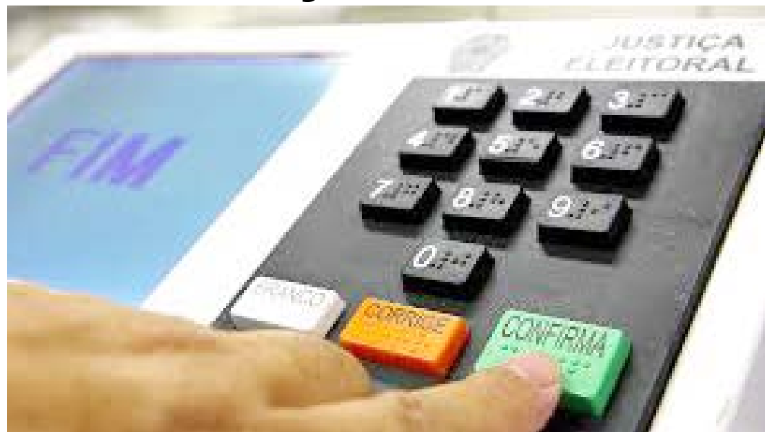
O número de jovens de 16 e 17 anos que fizeram o cadastro eleitoral e estão aptos a votar nas eleições municipais de outubro saltou 78%

Nas eleições gerais de 2022, os adolescentes haviam comparecido em número ainda maior, com o alistamento de 2,1 milhões (51,13% acima de 2018). O TSE, contudo, evita fazer a comparação entre os dois tipos de eleição, pois há localidades que não participam das eleições municipais,