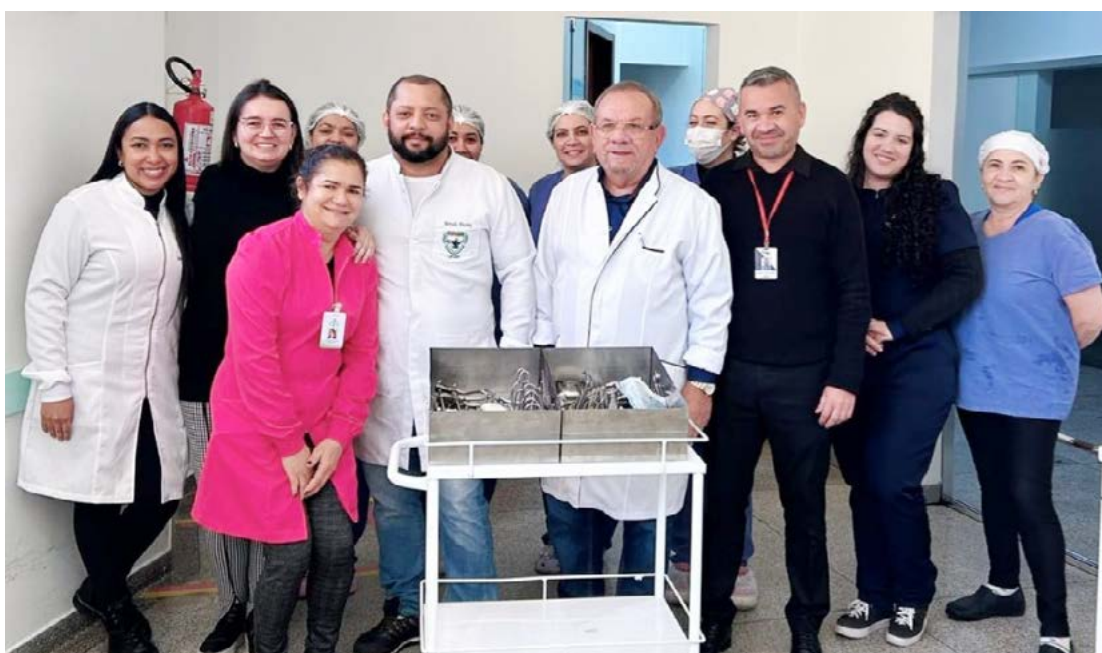
A entrega dos instrumentos foi feita nesta semana pelo município de Janiópolis

De acordo com a direção da Santa Casa, os instrumentos são de grande valia para o hospital e serão usados em serviços à poluição atendida.