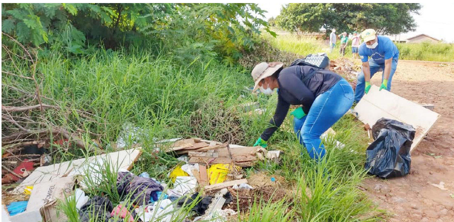
Os casos fazem parte do novo ciclo da dengue que começou no final de julho

Em nível estadual o boletim da Sesa traz mais 305 casos de dengue, sem óbitos. Soma-