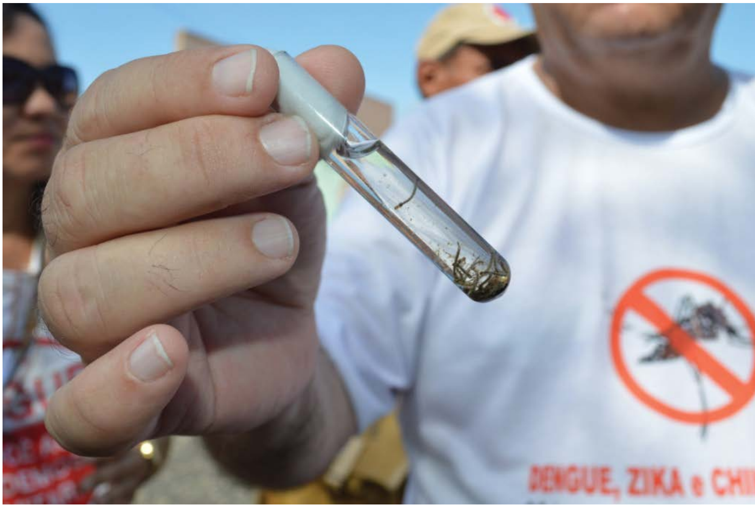
A dengue promete ser forte no verão deste ano em toda a região

De acordo com os dados, até agora 4 casos foram confirmados na cidade. Barbosa Ferraz, que faz parte da região, aparece na liderança com cinco casos. Depois aparece Fênix e Goioerê, com quatro cada.