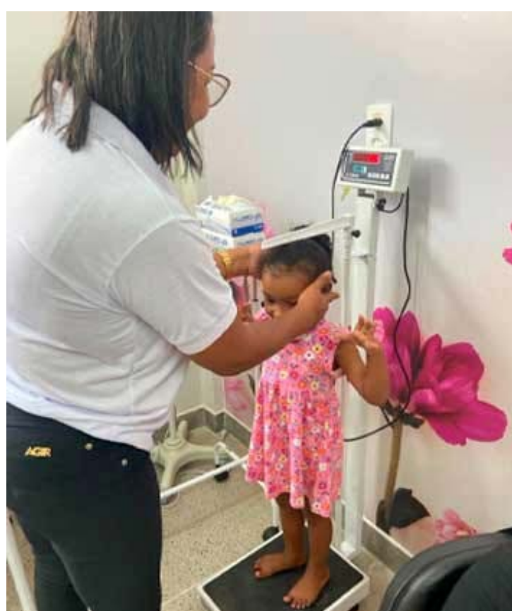
A pesagem será feita neste sábado, dia 28 em seis UBS's de Goioerê

Pelo cronograma estarão abertas as UBS's Central, Vila Guaíra, Santa Casa, Candeias, Universitário e Jaracatiá. "Essa é uma ação exigida e quem não fi-