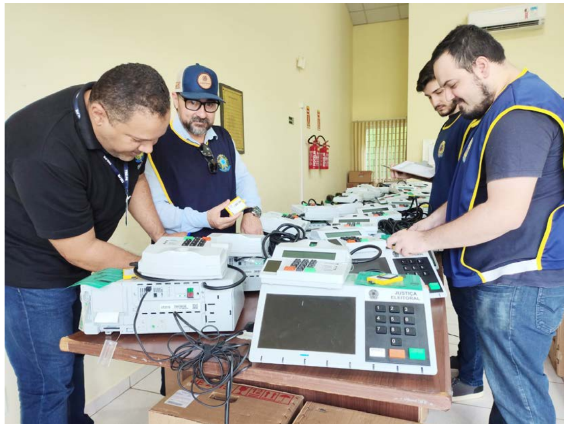
Os serviços de lacração das urnas já foi iniciado nesta quarta-feira

Durante esse processo, são inseridos os dados de candidatos e eleitores, garantindo a segurança do sistema. Na oportunidade também é feito testes de funcionamento e aposição