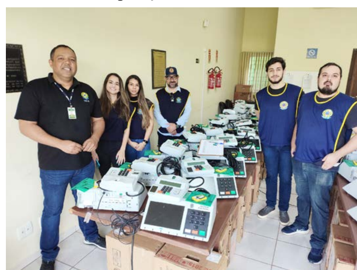
Equipe do Cartório Eleitoral que vai atuar nas eleições deste ano

de lacres nas urnas de seção e de contingência.