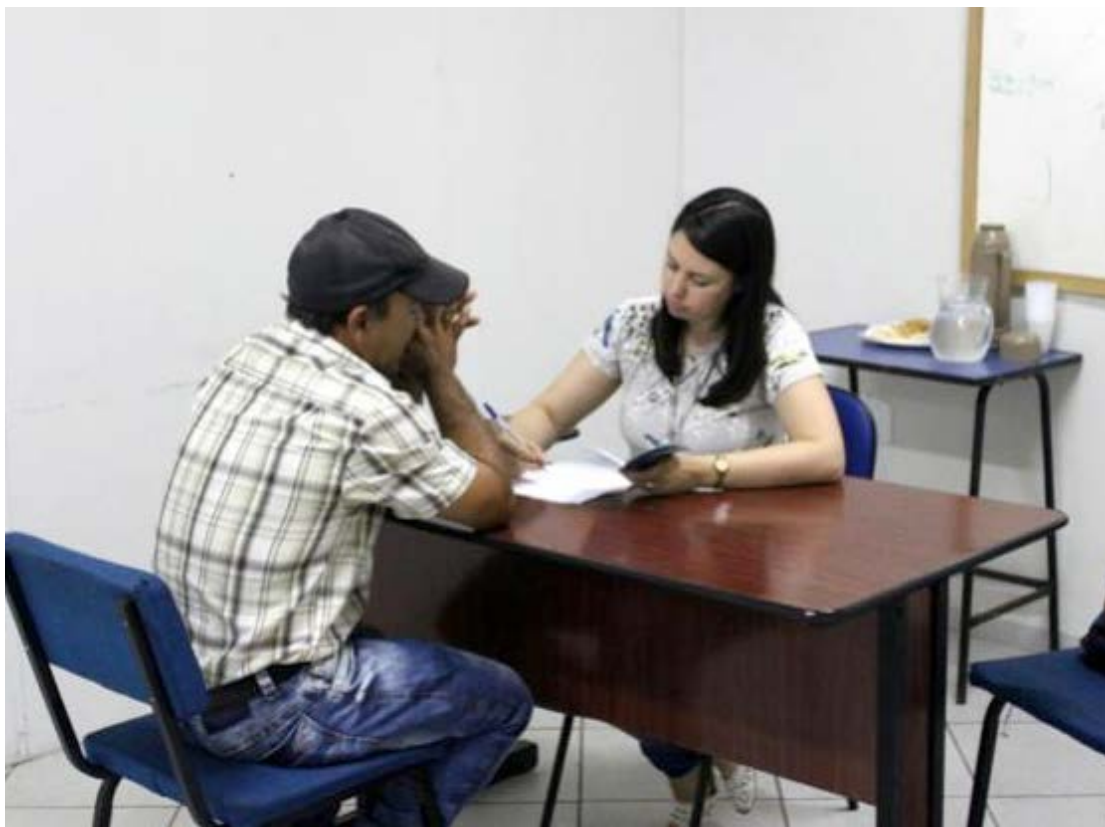
As entrevistas serão nesta quinta-feira, na Agência do Trabalhador

As entrevistas serão realizadas na Agência do Trabalhador e os interessados deverão comparecer no local munidos de todos os documentos pessoais, em especial da carteira de trabalho.