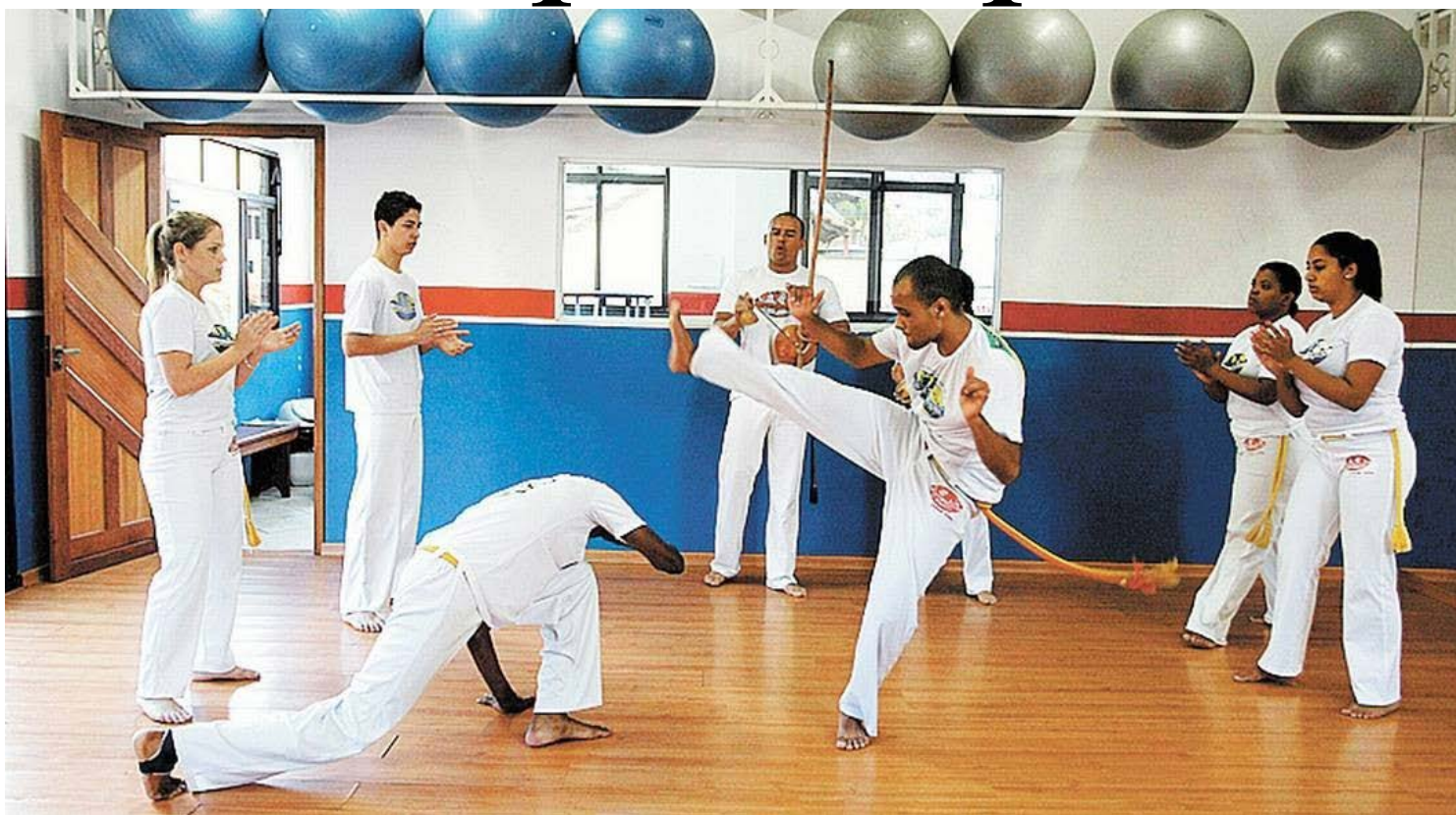
O projeto estará em Goioerê na próxima quinta-feira

A oficina, que mostrará como a arte, a música, movimento e danças estão presentes na capoeira, será realizada na próxima quinta-feira, dia 26 de