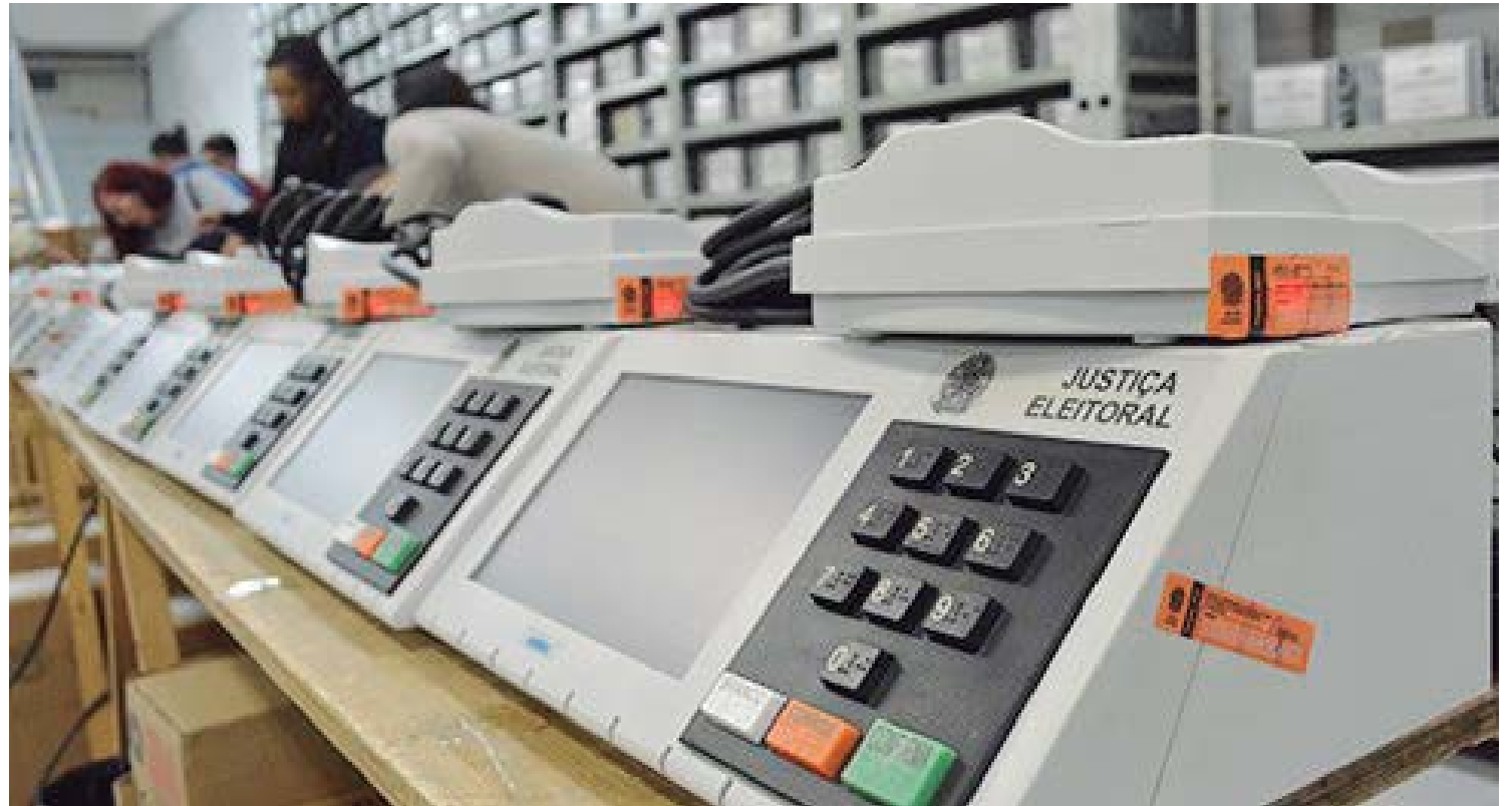
A geração de mídias e lacração das urnas estão previstas para a próxima semana

Coluna publicada simultaneamente em 22 jornais e portais associados. Saiba mais em www.adipr.com.br