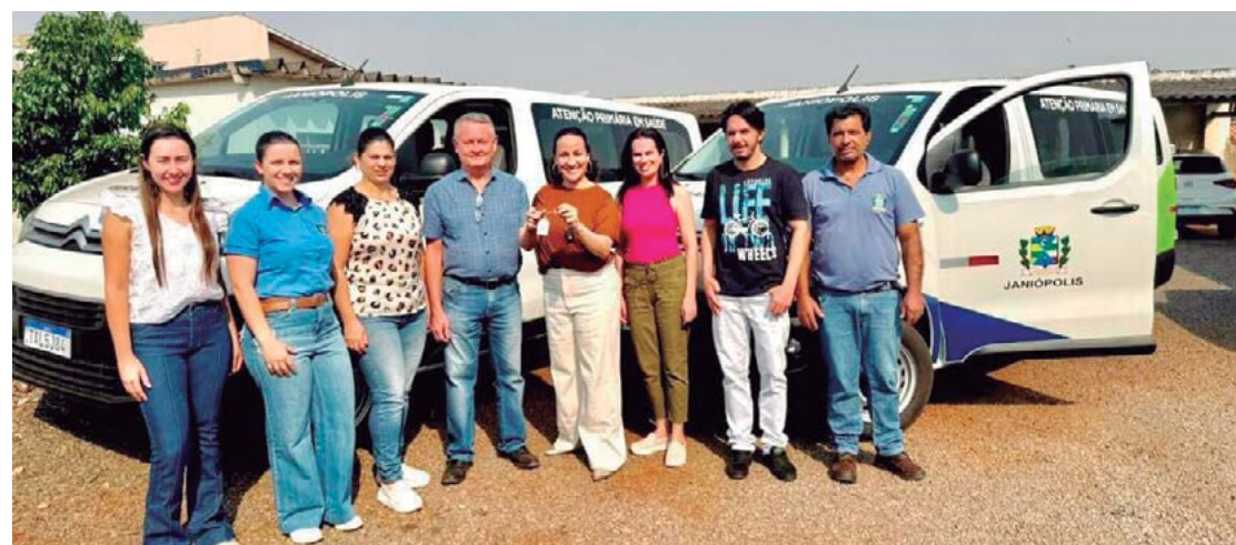
A entrega dos veículos foi feita na última sexta-feira: conquista da saúde

De acordo com a prefeitura, as vans, com capacidade de 11 lugares, foram adquiridas com recursos de R$ 215