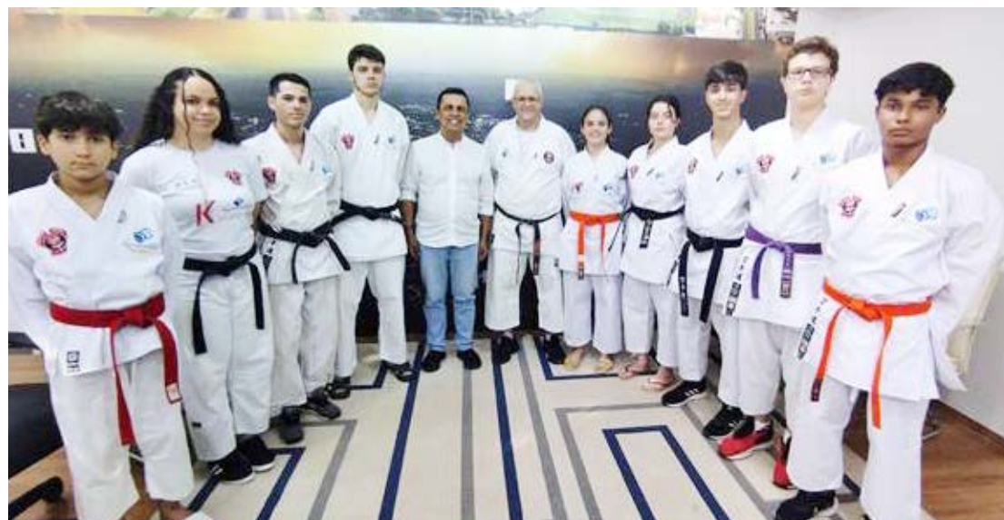
No total 9 atletas de Goioerê estarão participando da competição nacional