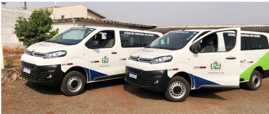
No total mais duas vans foram entregues para a Secretaria Municipal de Saúde