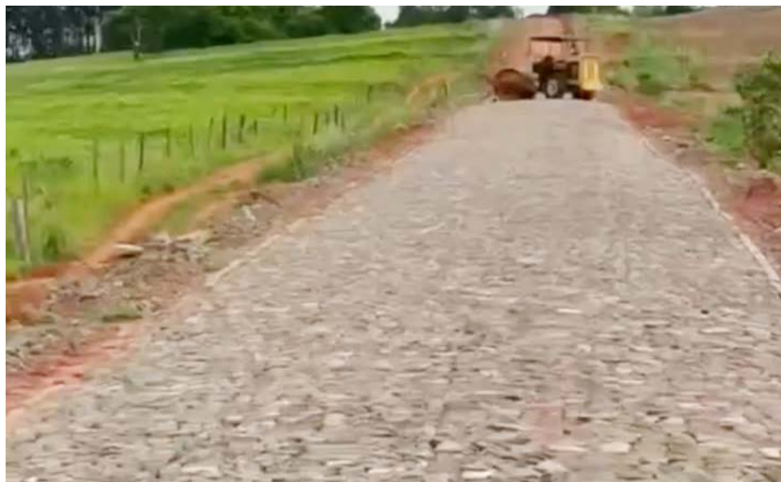
No total quatro quilômetros de estradas estão pavimentados: conquista importante

O prefeito explica que a comunidade de Vila Gianelo é um importante núcleo de moradores dentro do município e há muito se planejava investir na reestruturação dessa estrada. “Não