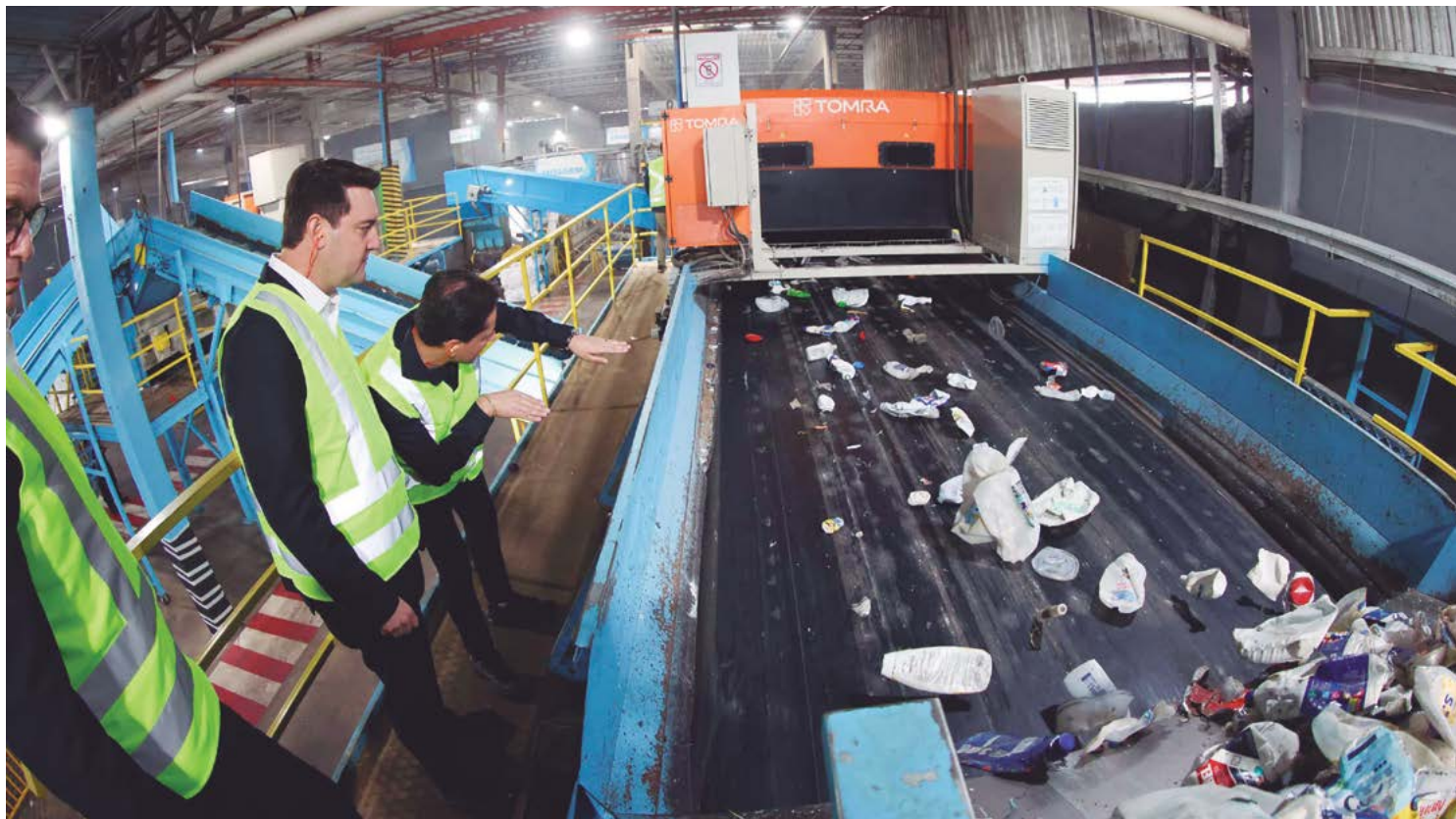
Fala de Ratinho Junior aconteceu durante visita a Clean Plastic, a maior empresa de reciclagem de plástico pós-consumo da América Latina, cuja primeira fábrica foi instalada em São José dos Pinhais.

“Somos considerados por quatro anos consecutivos como o Estado mais sustentável do Brasil e uma referência em sustentabilidade ambiental para a Organização para a Cooperação e Desenvolvimento Econômico (OCDE) graças a uma série de políticas públicas que implementamos, das boas práticas do nosso agronegócio, mas também por causa de empresas como a Clean Plastic, que é uma referência internacional em economia circular”, afirmou.