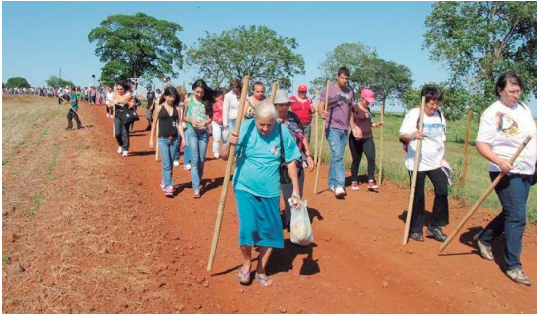
O evento é dos mais tradicionais e está marcado para acontecer no dia 22

Para se inscrever o interessado deverá procurar o ligar no Centro Catequético, no telefone (44) 3525-1634. Também poderá contatar o Santuário N. S. Aparecida, Paróquia Sagrada Família, Paróquia São Pedro (Roncador) e Paróquia N. S. Caravaggio.